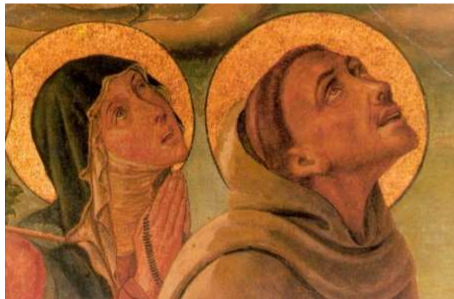
Frans og Klara i bøn til Maria.