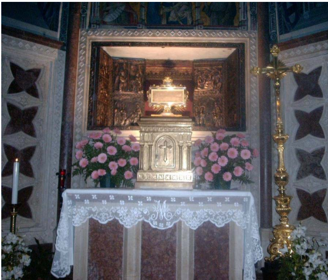
Marias sjal åbenbaret over det Hellige Sakramente i Basilica di San Francesco under Mariafejringen d. 8. december 2005

år gammelt, men det kan naturligvis ikke bevises, at det tilhørte Maria. Dette er dog forholdsvist ligegyldigt i forhold til den levende indre erfaring, at når vi tror, bliver stille og åbner os, så er det muligt for Gudsriget, Maria og hendes engle at komme til stede med deres nærvær. Jeg har hvert år d. 8. december fordybet mig foran dette sjal, og i 2004 og 2005 også sammen med december-retrætegrupperne. Vore individuelle erfaringer stemmer godt overens. Ved sjalet er der en nærmest rislende og meget bevægende tilstedeværelse af Maria som nogle fine, subtile, favnende og uendeligt kærlige vibrationer. Maria og Marias engle har helt mærkbart bevågenhed på at nedfælde det smukke Maria-nærvær netop omkring dette sjal i den ellers mere lodrette, ekspansive og brændende ind- og udstrømning over Frans' grav og hovedaltrene i under- og overkirken, som ligger bare omkring 25 skridt fra Marias sjal. Jeg glæder mig til også i år fra d. 2. december at dele denne specielle Maria-uge og Maria-fest med den gruppe af pilgrimme, som kommer på retræte.