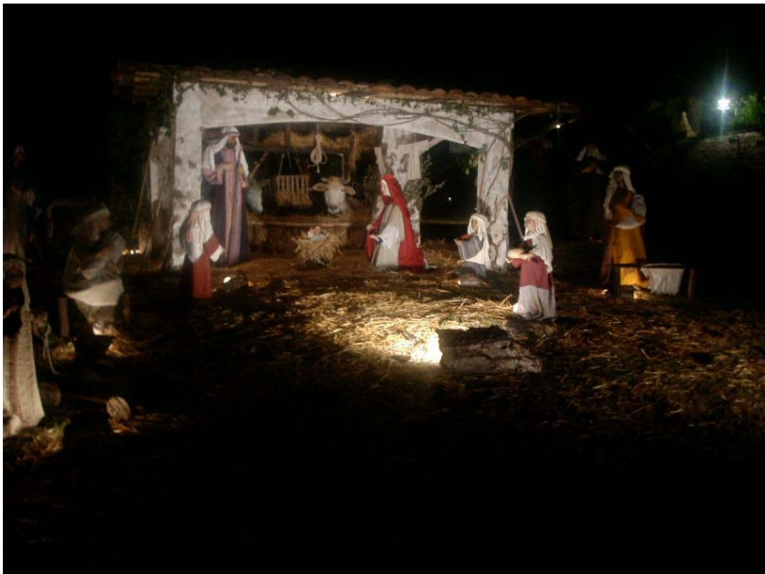
Julestemning i Assisi fra 2005 Krybben på plænen foran Basilica di San Francesco

I næste ASSISI NYT vil jeg naturligvis skrive om julen og nytåret i Assisi. Hvis du føler for det, kan du allerede nu ved overgangen til advent læse nyhedsbrevet fra julen 2005, som på side 3 også giver nogle forståelser omkring den uforklarlige tyngde og træthed, som mange lysarbejdere "døjer med" i tiden op til jul.