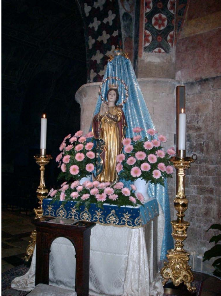
Maria ved hovedalteret i Basilica di San Francesco under Maria-fejringen i november 2006

Madonna findes) skal stå til rådighed for et lignende indre arbejde som i San Giovanni Rotondo. Endvidere planlægger jeg et ophold i Norditalien og Schweiz/Østrig for i Alperne at stå til rådighed for et indstrømningsarbejde, som også er inspireret som gavnligt for Europas udvikling som pioner for Den Nye Tid.