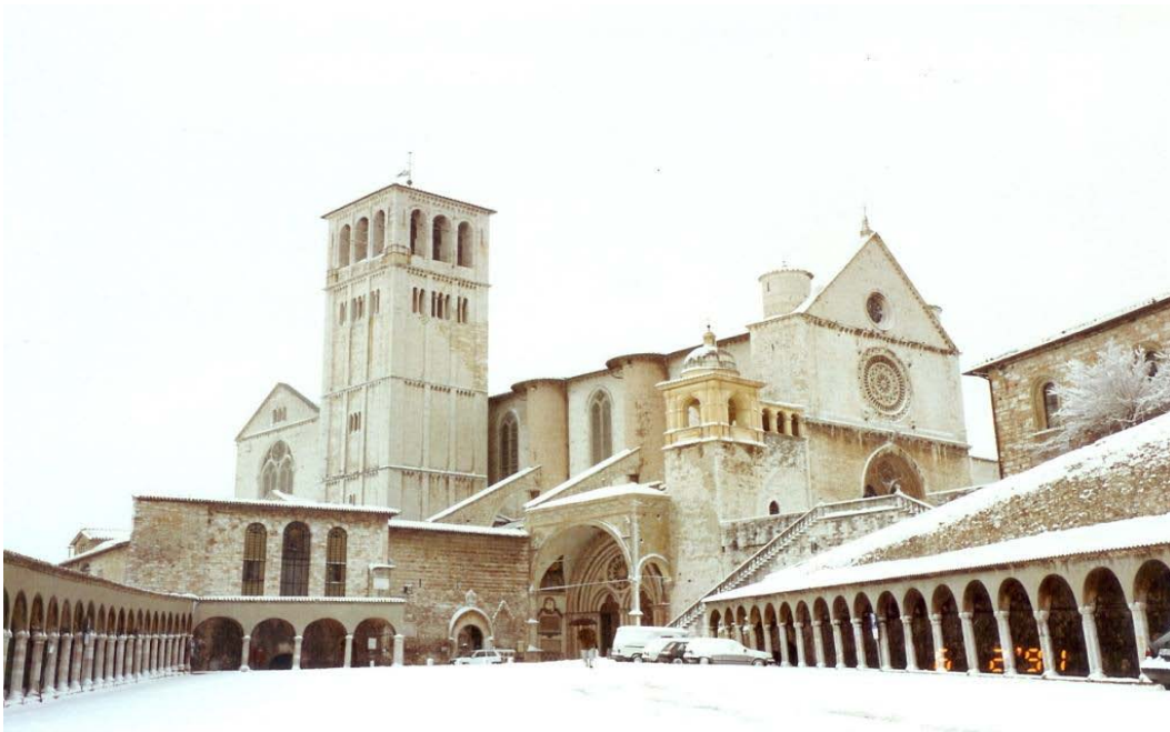
Basilica di San Francesco og Sacro Convento i sjældent snevejr

Hvis du er en af dem, der føler dig beriget af at læse nyhedsbrevene, og som både har mulighed og føler for at donere et valgfrit beløb til den interreligiøse dialogmission i Assisi, der gør det muligt at fortsætte og udvide den, modtages en sådan donation med stor taknemmelighed. Af en sådan donation i forbindelse med nyhedsbrevene vil evt. overskydende beløb i forhold til den interreligiøse dialogmission, gå til Sacro Convento og den vigtige mission, som dette moderkloster har i verden. Franciskanernes arbejde verden over hviler fortsat på donationer, idet de ikke, som nogle andre ordener, har ønsket at involvere sig i diverse erhvervsdrivende aktiviteter, men ønsker at virke tæt på det fattigdomsideal, som Frans lagde så stor vægt på ved sin stiftelse af de to tiggerordener, som i dag kendes som Den Franciskanske 1. og 2. orden (Franciskanerbrødrene af 1. orden og Klarisserne). Nyhedsbrevene udsendes naturligvis fortsat til alle de, der ønsker at modtage dem, uanset donation eller ej.