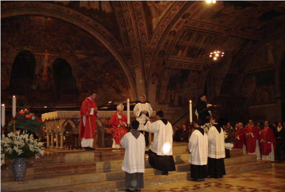
Santa Lucia messe d. 13. december 2006 i Basilica di San Francesco, underkirken