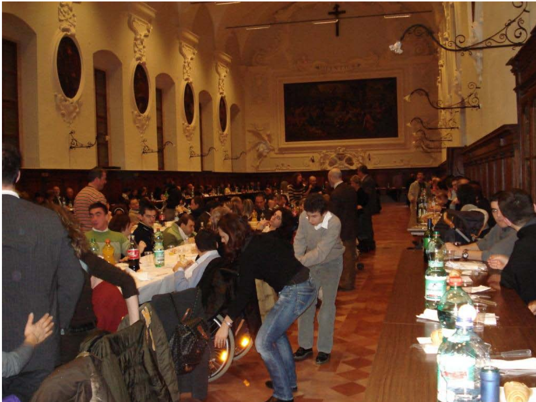
Festmiddagen for de handicappede i refektoriet på Sacro Convento

gengældt. Vore kære medbrødre og –søstre, der synes at leve så svært et liv med såvel fysiske som psykiske handicap, var tydeligvis ikke bare selv glade og kærlighedsfyldte, men også en kilde til glæde og kærlighed for os andre, øjensynligt mere ”privilegerede” mennesker. En ung multihandicappet pige lige over for os var et smukt vidnesbyrd. Hun var blind og psykisk retarderet, og så ud som om, at hun var absorberet ind i en virkelighed langt fra den ydre. Hun sad og spise, mens et smil så stort og lysende bredte sig over hendes ansigt. Mon hun kommunikerede med englens? Jeg tænkte under middagen ofte på de store kristne skikkelsers forståelser af, at i det mest ”usle”, fattige og lidende menneske møder vi Jesus. Padre Pio udtrykte det på den måde, at i os alle bor Kristus, men i de fattige, nødstedte, lidende og handicappede bor Kristus dobbelt.