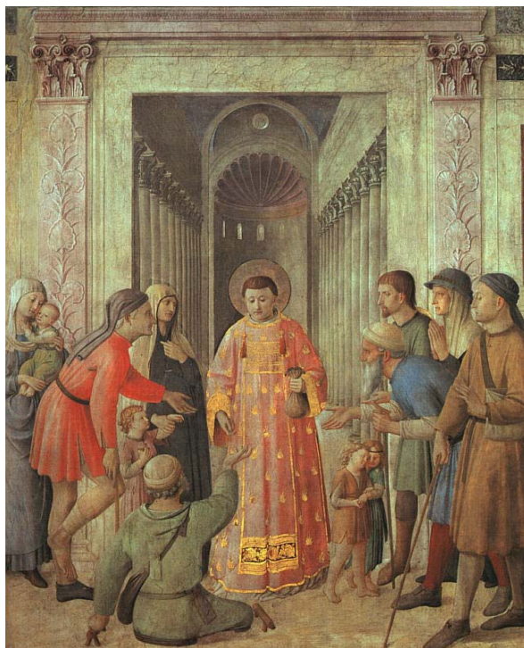
San Lorenzo skænker kirkens skatte til de fattige

I kunsten vises han som diakon ofte med den rist, som han ifølge overleveringen blev brændt på. Han er naturligvis skytshelgen for de fattige samt for alle dem, der i deres virke har noget med ild at gøre, så som brandfolk, kokke etc. Hans festdag er d. 10. august.