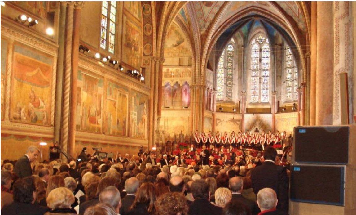
Præsentation af julekoncerten d. 16. december 2006 i Basilica di San Francesco, overkirken

Koncerten er også tidligere blevet sendt i dansk tv, men det ser desværre umiddelbart ikke sådan ud i år, i hvert fald ikke d. 25. december. Har du parabolantenne, vil du dog sandsynligvis kunne se koncerten over den italienske hovedkanal RAIUNO eller måske på et forskudt tidspunkt via Sverige og Norges TV.