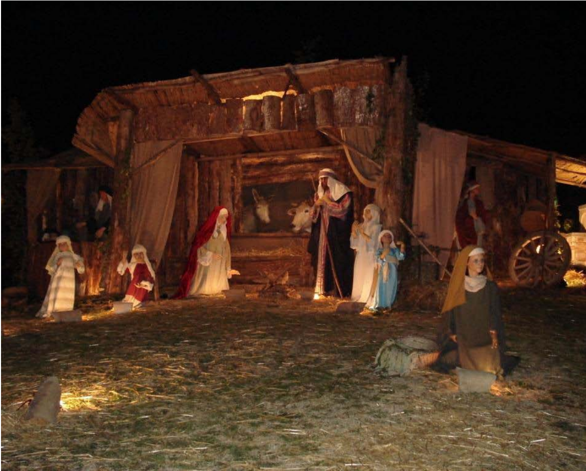
Udsnit af Betlehems-scenen på plænen foran Basilica di San Francesco, Assisi, d. 14. december 2006 Stalden med Maria og Josef