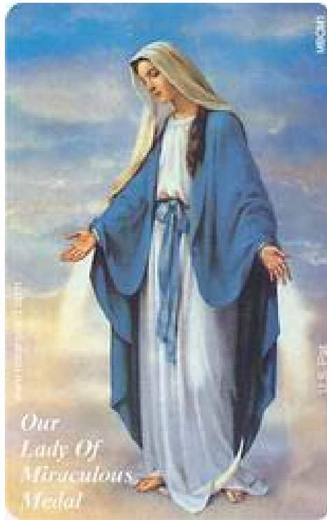
Maria – healingens, fredens og kærlighedens Moder

menneskerettigheder og Skabelsen, solidaritet med svage gruppe, social tryghed, lighed også mellem kønnene og hjælp til alle de brødre og søstre på jorden, der lever under langt ringere vilkår. Når jeg lyttede til de brasilianske pilgrimme, var det endvidere med stor glæde over deres engagement i og optagethed af de mange problemer i deres eget hjemland.