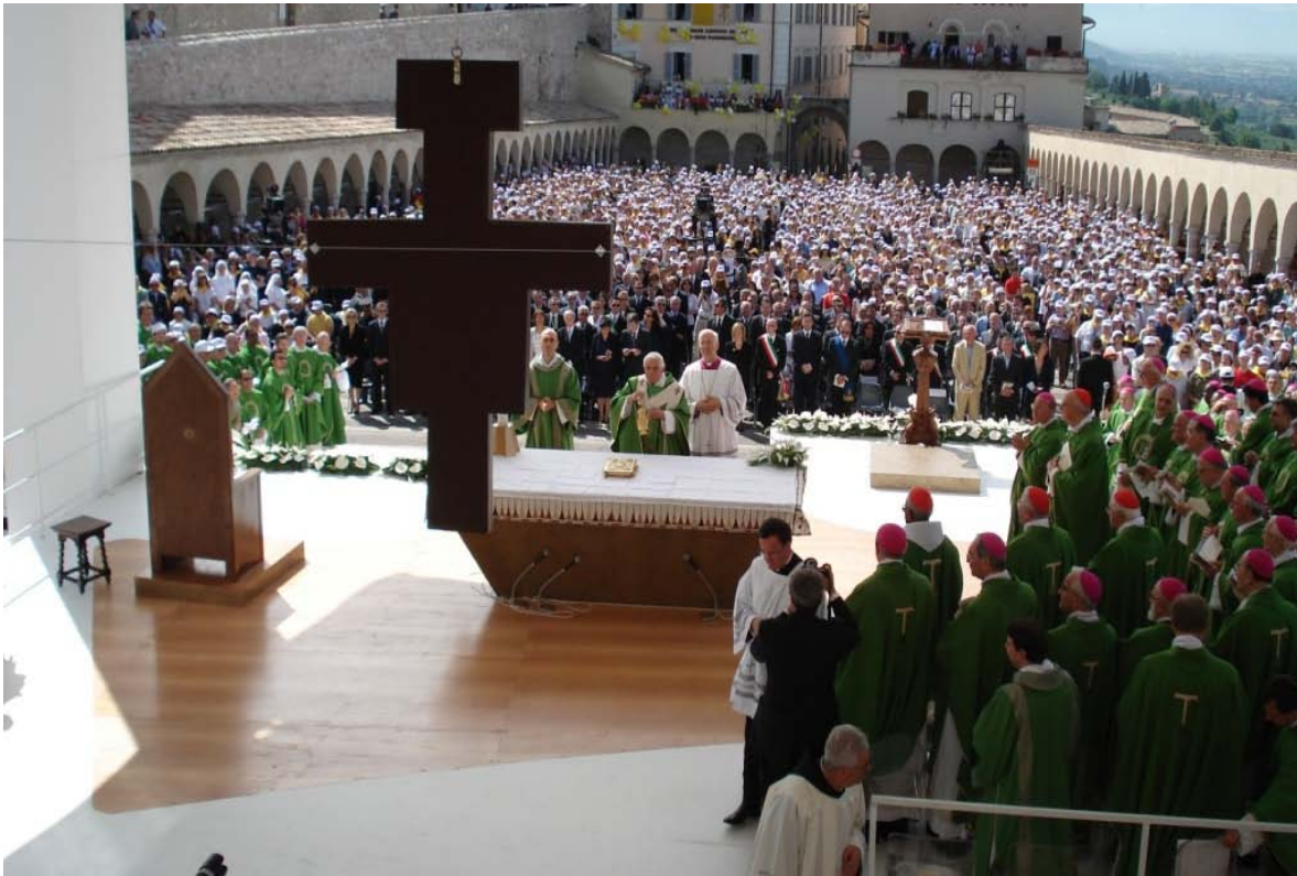
Pave Benedikt XVI som hovedcelebrant i pontifikalmessen på Piazza Inferiore foran Basilica di San Francesco d. 17. juni 2007