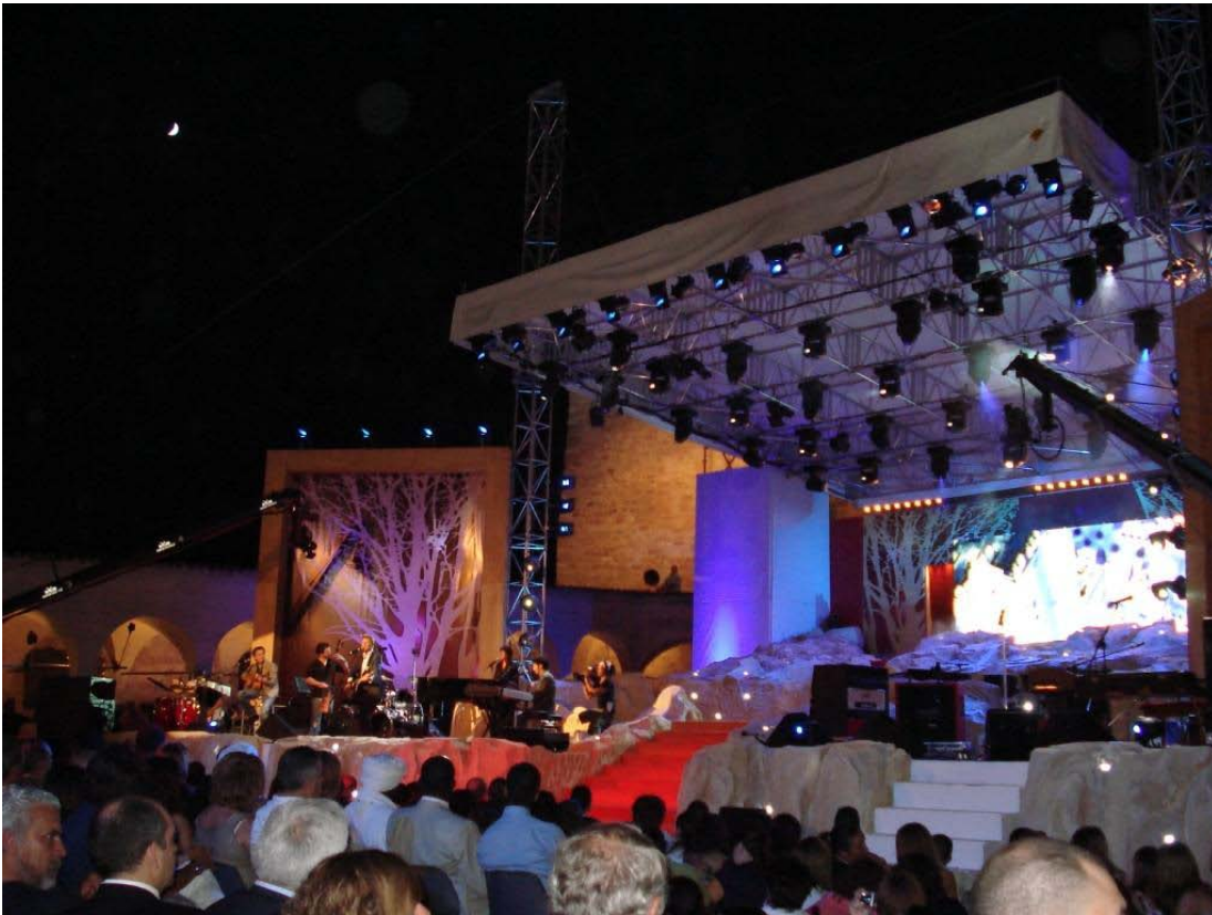
Koncerten ”Nel Nome del Cuore” i Assisi, d. 21. juni 2007