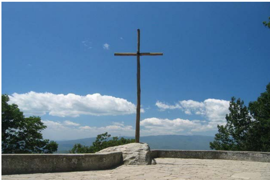
Det franciskanske kors på La Verna, som vi besøger på oktober-retræten

Kloster: De Svenske Søstre (Brigitta-ordenen). Tilmelding senest 30. september 2007 for gruppebillet.