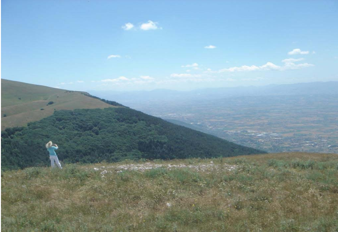
På toppen af det hellige bjerg, Monte Subasio, med gruppen i juni 2007 Der er en uendeligt smuk og kraftfuld indstrømning af healende Helligånd på Subasio

ASSISI MISSION ♦ c/o Bente Wolf Via Fortini 7 ♦ I-06081 Assisi (PG) ♦ Italy tel: +39 075 8155 278 ♦ e-mail: bente@assisimission.net web: www.assisimission.net