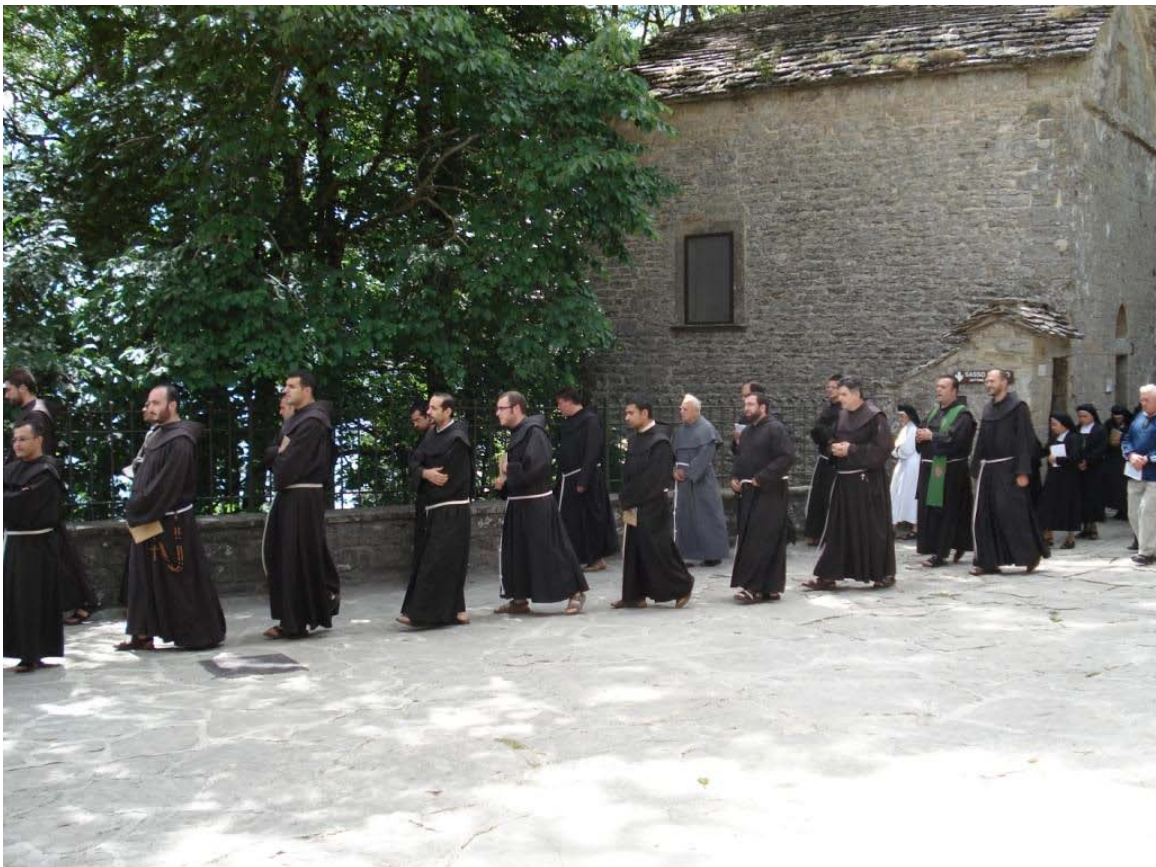
På La Verna med gruppen i juli 2007

Sidste nyhedsbrev blev udsendt lige før sommerens to kursusretræter, der blev afviklet over 14 dage i slutningen af juni og begyndelsen af juli. I den første uge var vi sammen med en stor gruppe fra Norge med enkelte deltagere også fra Danmark, og i den efterfølgende uge var det en mindre gruppe fra Danmark. Når vi evaluerer en sådan kursusuge, er det altid med en følelse af stor taknemmelighed og glæde over at have kunnet følge søgende menneskers dybere overgivelse og opleve, hvordan hele deres væsen begynder at skinne om kap med solen, øjnene får nye, varme og milde dybder og hjerterne åbner sig dybere i medfølelse, kærlighed, glæde og fred. Så er det, at vi igen og igen takker Gudsriget for den store gave, som skænkes til sensitive mennesker, der med længsel i hjerterne er kommet til Assisi.