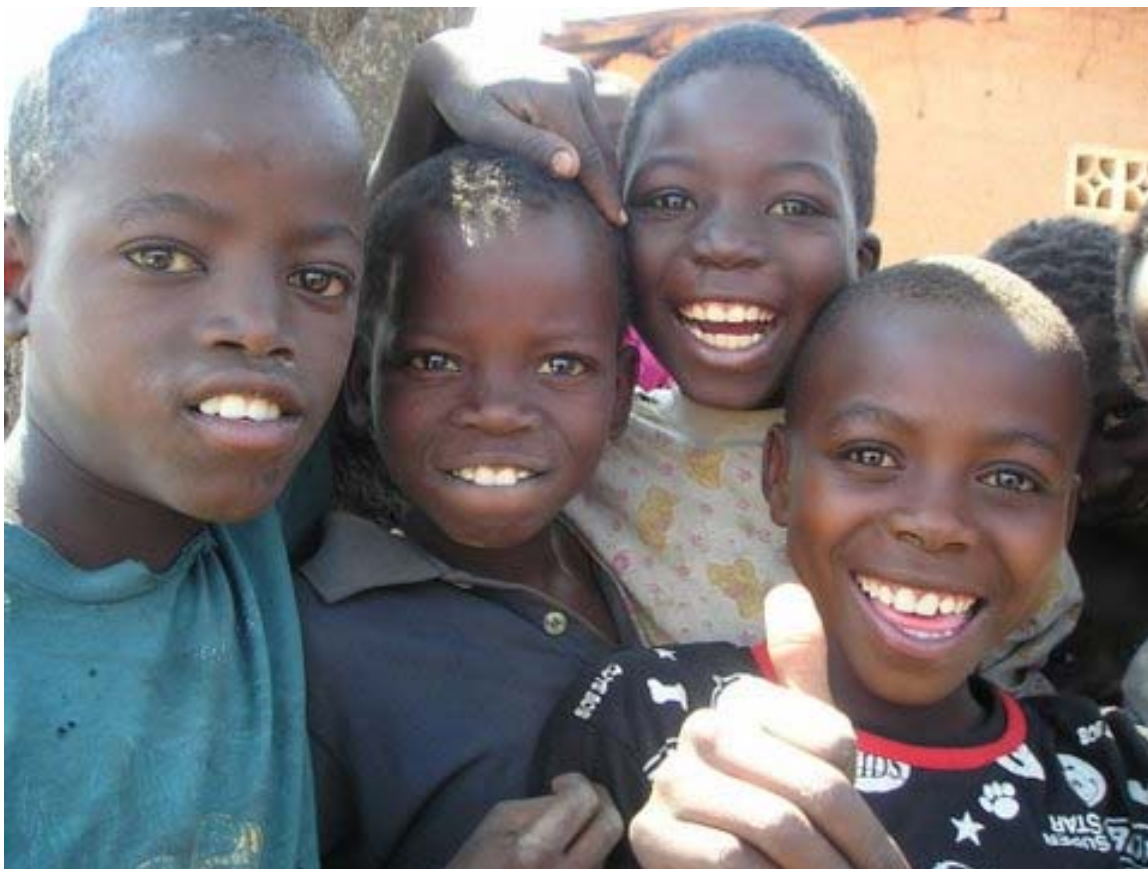
Glade børn modtager hjælp af den franciskanske mission i Afrika

Jeg ser også tydeligere og tydeligere, at den spirituelle hjælp og vejledning, som så mange i den vestlige verden søger i deres processer, er så forskellig fra den hjælp og vejledning, der er brug for i de fattige områder af verden. Også derfor er kirkernes og ordenernes indsats her af så stor betydning. I det sidste århundrede kom Frans og Klara via ordenernes missioner for alvor til Østen, Afrika og Sydamerika. Hvor er der brug for dem!