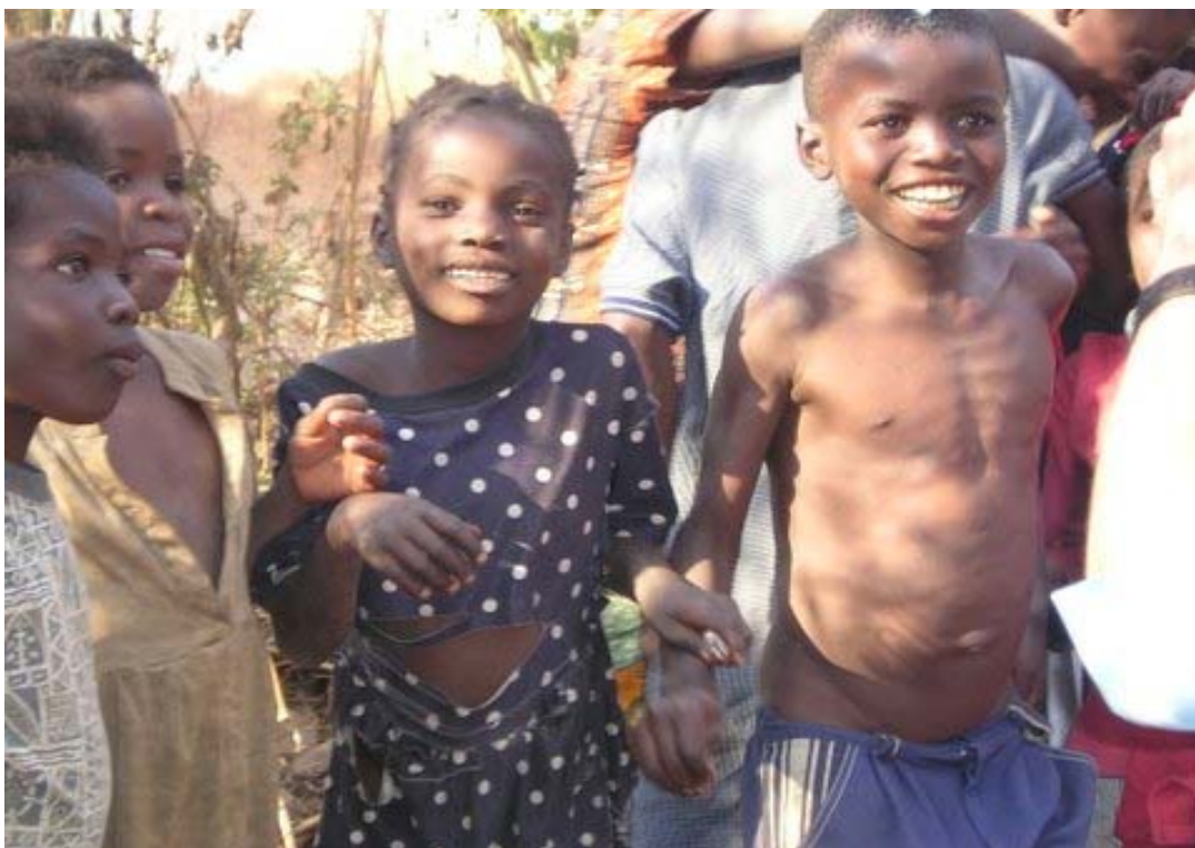
Et franciskansk out-reach program til forældreløse børn i Zambia

Vi driver skoler, hvor vi underviser unge piger og drenge. Når de har gennemgået den elementære uddannelse, søger vi at undervise dem i forskellige færdigheder, f.eks. et håndværk, så de kan starte et erhverv op, og dermed blive selvhjulpne. Vi har et trykkeri og trykker bøger og tidsskrifter, ligesom vi har flere "out-reach" programmer, hvor vi går ud og besøger sognebørnene i deres hjem. Vi søger at give dem mad, og derfor må vi tigge for mad eller penge, og så kan vi hjælpe de fattige. Nogle brødre arbejder også hårdt på at skaffe medicin, ligesom vi er involveret i landbrugsprojekter, hvor vi søger at undervise i sund landbrugsdrift, således at de kan klare sig selv. Nogle af brødrene har kontakt til regeringen og søger at øve indflydelse på denne måde. . Vi underviser i Gud, i livet. Så vor mission i Zambia dækker mange områder."