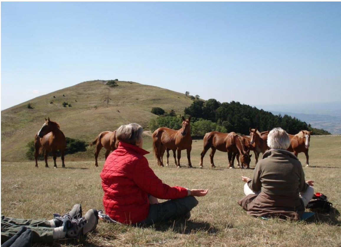
Helligåndsmeditation på toppen af Monte Subasio - vor kære venner de brune hopper med føl

Perioden siden sidste nyhedsbrev i august har været præget af meget både ydre og indre liv i Assisi. Pilgrimme er strømmet til Assisi i stort tal, og festerne for henholdsvis Klara og Maria i august måned tiltrak endnu flere, som ønskede at være til stede ved de smukke religiøse fejring i Assisis kirker. September og oktober er måneder, hvis mildere sommertemperatur lokker mange pilgrimme til Assisi. Også ASSISI MISSION afholdt et kursus i september, der var velsignet med mange smukke oplevelser og dybe indre erfaringer, og takket været "the Spirit of Assisi" rejste gruppen hjem til Danmark med varme i hjerterne og lys i øjnene.