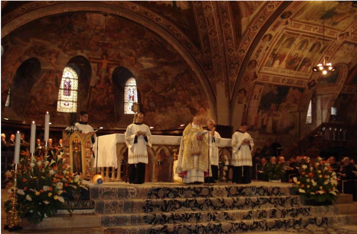
Fest-vesper i Basilica di San Francesco om eftermiddagen på festen for Frans d. 4. oktober 2008

problemstillinger, der har med naturens riger at gøre, men da han var bortrejst fra Italien i de dage, hvor gruppen var her, mødte jeg dem.