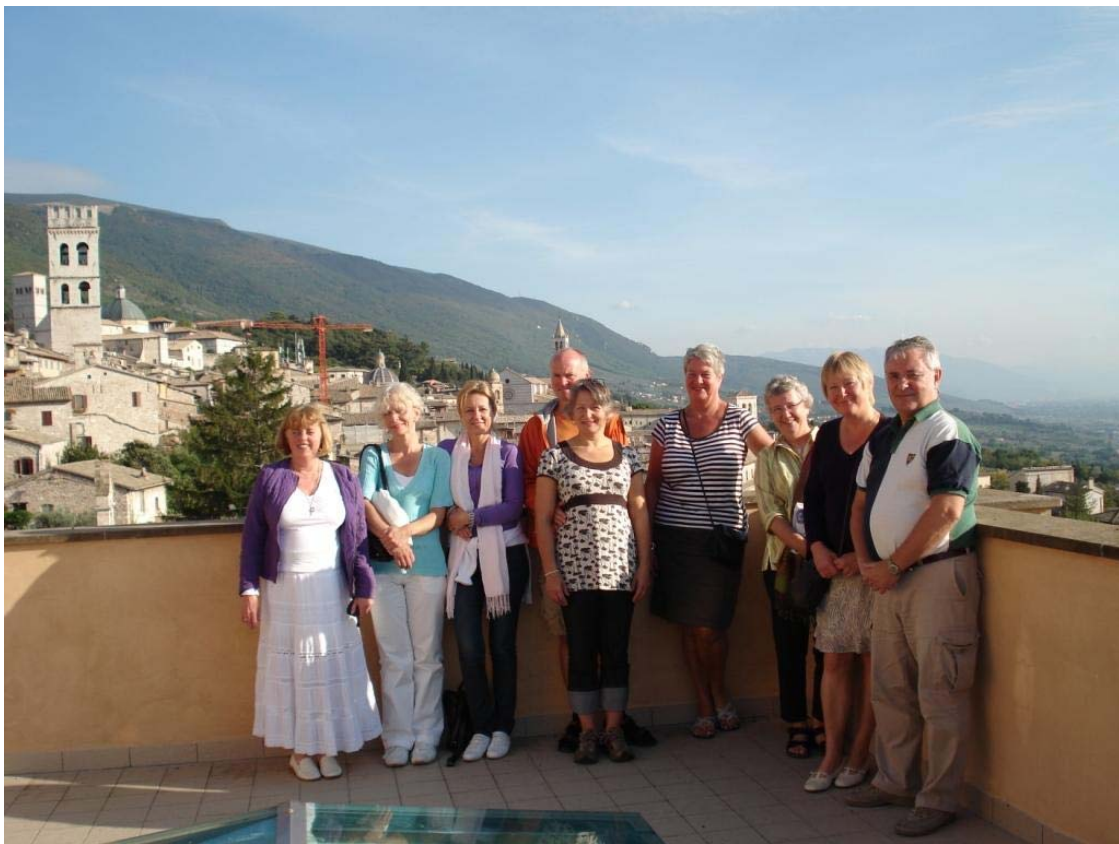
Oktoberretræten - Afslapning på CEFID's terrasse med den storslåede udsigt over Assisi, bjerge og dalen

os med indre arbejde i Assisi, Sacro Convento og CEFID, og vi også tog på heldagsture til både La Verna og som noget nyt Rieti-dalen, hvortil Frans vandrede flere gange i sit liv og opholdt sig i bøn, faste og meditation i huler rundt omkring i bjergene. I denne storslåede dal omkranset af frodige bjerge stod vi til rådighed med indre arbejde i de vigtigste af helligstederne efter Frans, Greccio og Fonte Colombo, og dernæst modtog vi en meget tiltrængt healing til vore trætte indre legemer i La Foresta. På vor tur til og fra Rieti-dalen, hvortil vi blev bragt i lejet bus (til forskel fra Frans, der vandrede barfodet hele vejen!), talte vi om, hvor utroligt det er, at man kan være nærmest totalt udmattet af træthed efter en dag, hvor den fysiske aktivitet har været meget begrænset. Det indre energiarbejde kræver ofte så meget, at også det fysiske legeme er udmattet, som havde ”Broder Æsel” hele dagen virket i en krævende udfoldelse af fysiske kræfter.