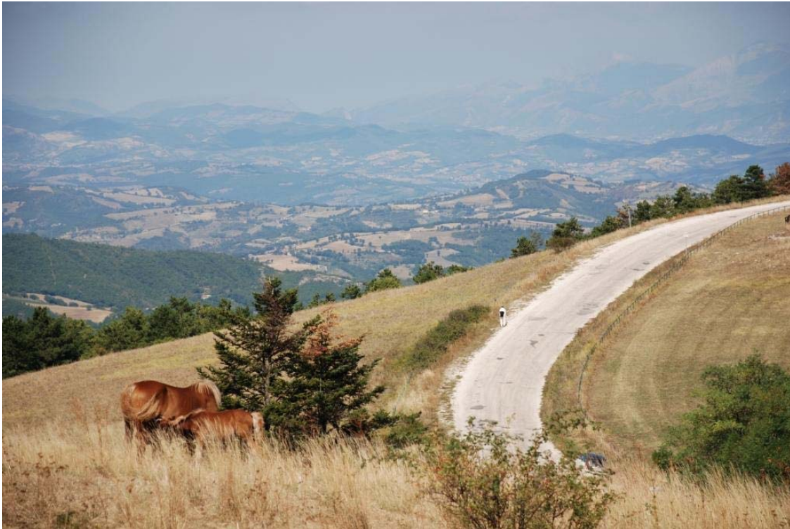
Septemberretræten – udsigt fra toppen af Subasio over bjergene Et par af vore venner hestene græsser

dens størrelse, i hvert fald vil koste euro 5.-6.000 at udgive, har Ordenen brug for en håndsregning.