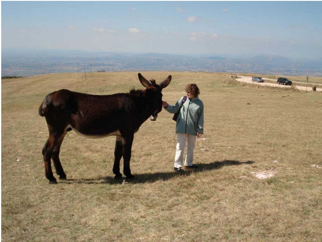
Broder Æsel og fødselsdagsbarnet i dialog

Da vi var færdige med meditationen, kom Broder Æsel helt hen til os. Det viste sig, at han elskede at blive kløet bag de enorme ører, og ikke mindst elskede han de frokostrester, vi kunne tilbyde ham. En af kursusdeltagerne havde fødselsdag netop denne dag, og det var som om, at Broder Æsel slet ikke ville løsrive sig fra hende. Han vedblev med at følge efter hende og skubbe og puffe venligst til hende med sin store mule. Også fra hende fik han da lokket det fine æble, som skulle have været hendes dessert.