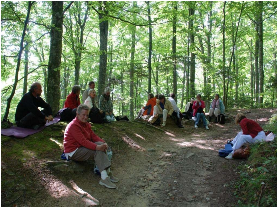
Septembrisretræte i Assisi Meditation i skoven på La Verna