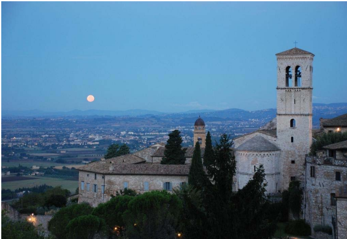
Udsigt fra Piazza Santa Chiara over solnedgang i bjergene

Invitationen er vedhæftet dette nyhedsbrev, således at du allerede nu kan se den. Jeg ser meget frem til at gense Assisi-venner i Drammen og måske også møde nye.