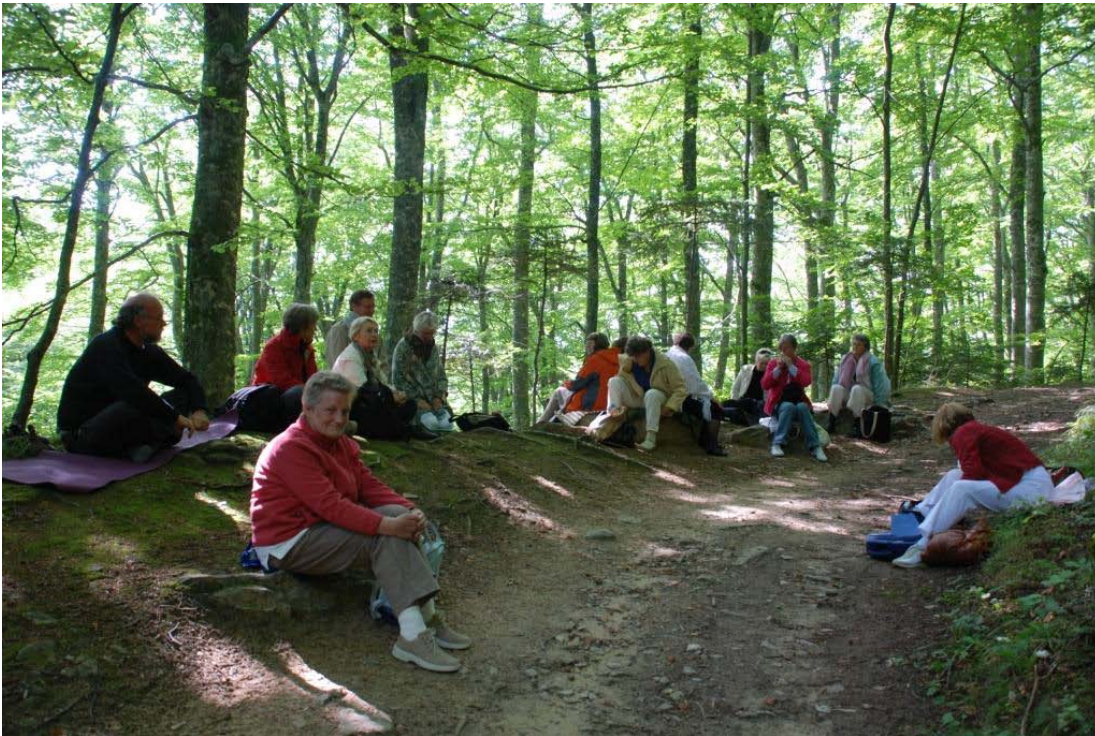
Meditation i skoven på La Verna under september-retræten 2008

Når jeg ser tilbage, er den sammenfattende forståelse, at opgaven i Assisi ikke mindst på et indre plan, er blevet manifesteret både dybere og bredere i år 2008, og det er jeg naturligvis både glad og taknemmelig for. Dette kunne ikke have været sket uden den uvurderlige støtte, der er givet fra mange sider, specielt fra medlemmer af ASSISI MISSION , og naturligvis ikke mindst fra de indre hjælpers side. Jeg sender en stor tak af hjertet især til alle medlemmer af ASSISI MISSION for jeres engagement og også til alle øvrige læsere af ASSISI-NYT , som med varme, kærlighed, interesse, bønner og megen respons har givet støtte til missionen i Assisi.