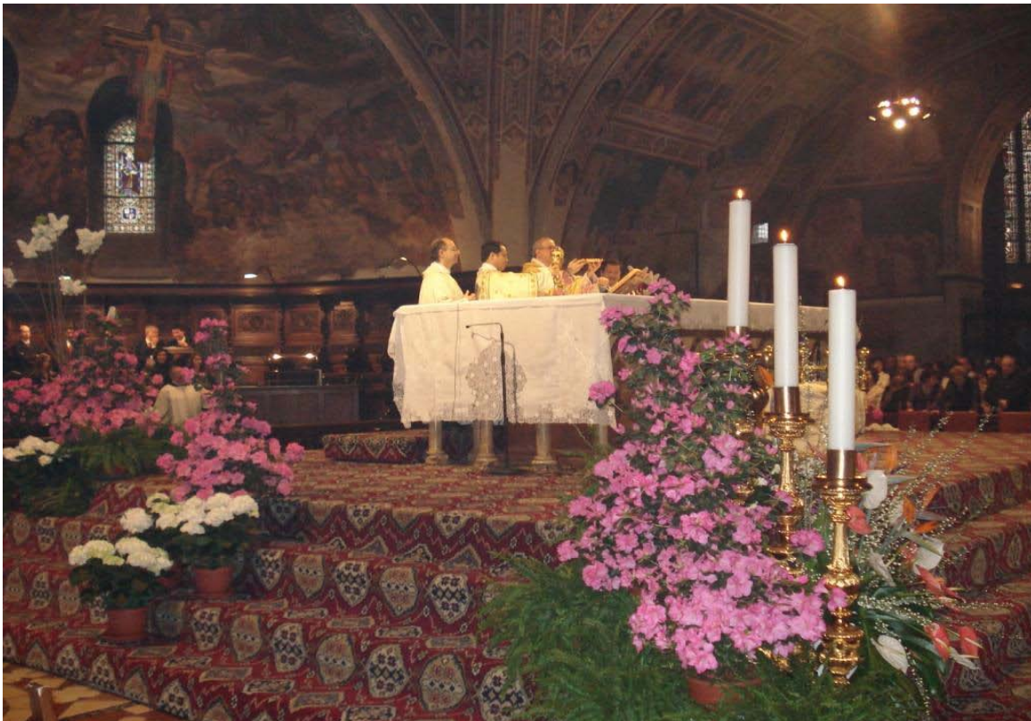
Påskehøjmesse i Basilica di San Francesco i 2008

Der er til påskeretræten udsendt en særlig invitation, som ikke er udlagt på hjemmesiden, men du kan rekvirere den ved henvendelse til mig.