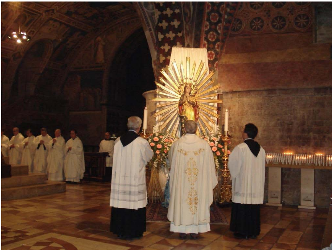
Novenamesse som forberedelse af festen for Maria d. 8. december 2008 Hovedcelebranten beder foran Basilikaens Maria-statue

ASSISI-NYT – julen 2006, ASSISI-NYT – nytåret 2006/2007