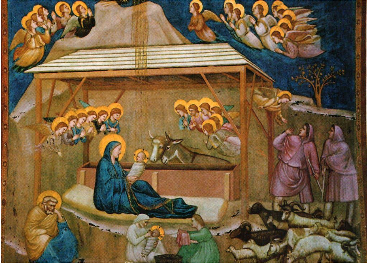
Fødslen af Jesus – freske af Giotto i Basilica di San Francesco, Assisi