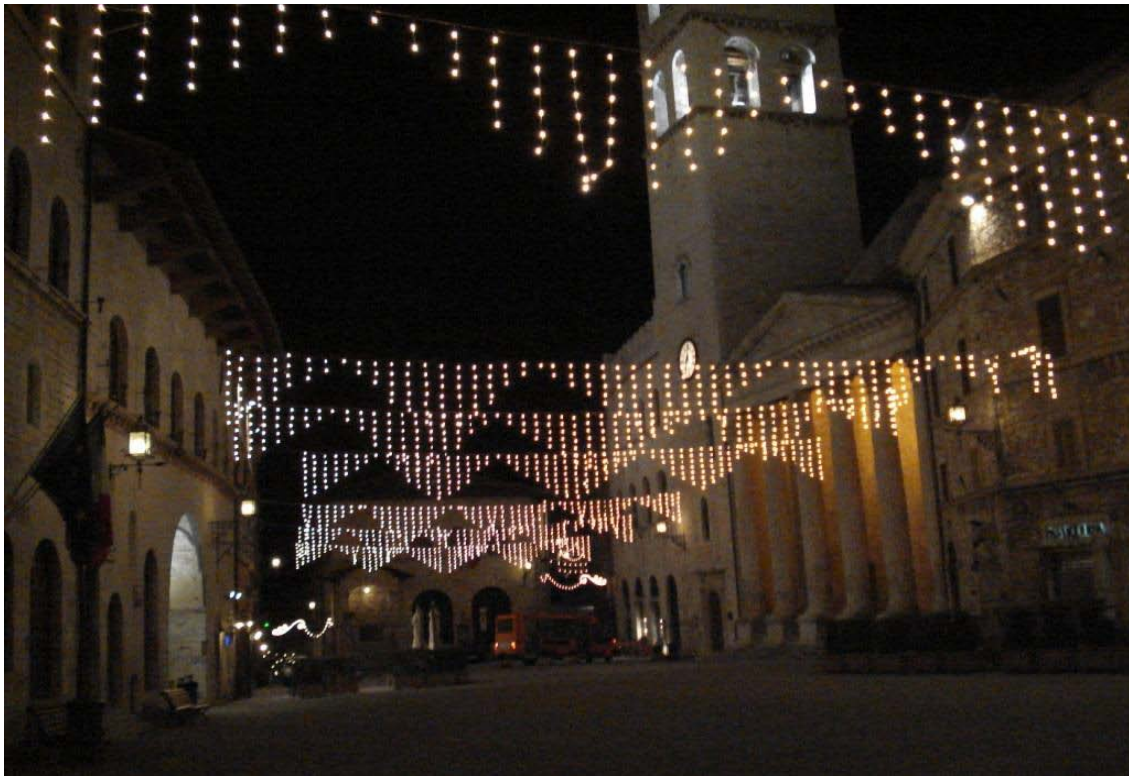
Julestemning på Piazza Comune

ASSISI MISSION ♦ c/o Bente Wolf Via Fortini 7 ♦ I-06081 Assisi (PG) ♦ Italy tel: +39 075 8155 278 ♦ e-mail: bente@assisimission.net web: www.assisimission.net