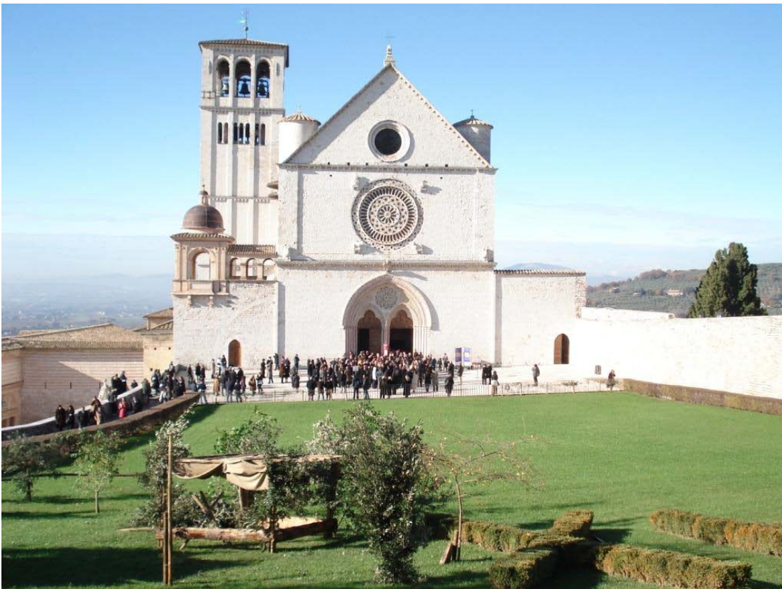
Nogle af gæsterne i Concerto di Natale 2008 i Overkirken - Bethlehemsscenen er ved at blive opstillet

Hvis du ikke kan åbne ovenstående link, kan artiklen findes på Den Gyldne Cirkels hjemmeside, www.dengyldnecirkel.dk under "Nyhedsbreve" og "Hjerteprocesserne og fredens jul".