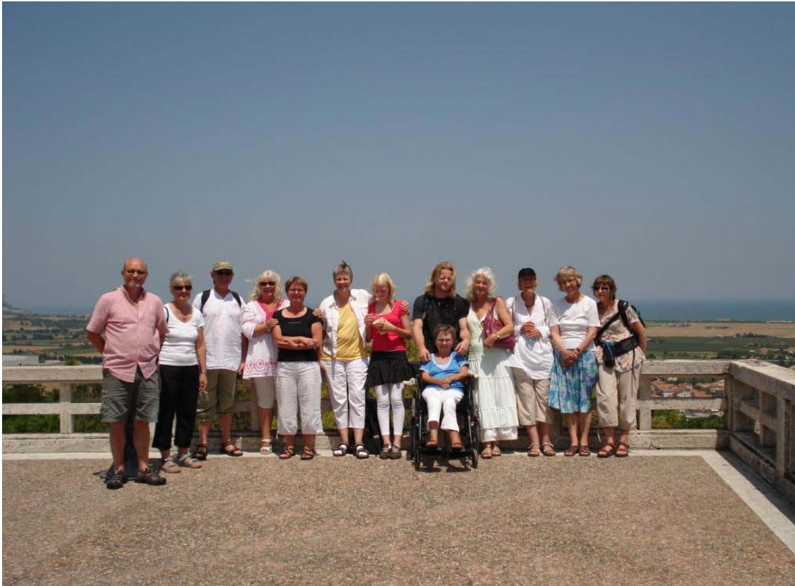
På Italiens vigtigste Maria-helligsted Loreto ved Adriaterhavet under sommerretræten i juli 2008

Også andre rejser med hovedvægt på det indre nedfældningsarbejde har præget året. Foruden årets 4 rejser med kurser, generalforsamling og møde i Danmark og rejsen til Finland samt Italien rundt blev det også til et par rejser til Amalfi-kysten samt endnu en rejse til Polen til forberedelse af den indstrømningsopgave i maj 2009, som vi som nævnt er en gruppe, der har påtaget os.