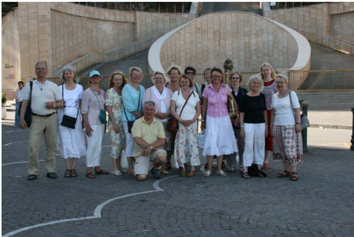
Lysrejsen "Italien Rundt" i maj 2008 I San Giovanni Rotondo foran Padre Pios korsfæstelsesvej, der snor sig op at bjerget

Den ene var lysrejsen "Italien rundt", hvor vi i en gruppe på 16 lysarbejdere og medlemmer af ASSISI MISSION opholdt os med dybt indre tjenestearbejde i henholdsvis La Verna, Assisi, San Giovanni Rotondo og Rom. Der var fra de indre arbejdsgiveres stor opmærksomhed og støtte til denne rundrejse, og efterfølgende er der givet impulser om at vægte sådanne tjenesteopgaver også i fremtiden. Således er vi en gruppe medlemmer, der rejser til Polen i maj 2009, og igen i september 2009 er det planen at tilbyde en retræte, hvor vi foruden ophold i Assisi også opholder os i San Giovanni Rotondo, og hvor det indre tjenestearbejde vægtes højt.