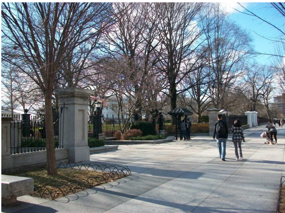
Pennsylvania Avenue d. 25. januar 2010 - Det Hvide Hus skimtes i parken bag træerne