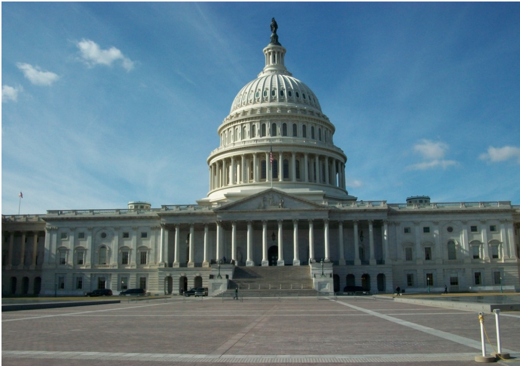
US Capitol fra stedet, hvor jeg onsdag mediterede

meditativt indstrømningsarbejde i det fri. Og egentligt var det jo meget velegnet, at jeg ca. 8 timer inden Obama skulle ankomme til Kongressen for at holde sin store tale, sad på netop dette sted og intensiverede det indre arbejde.