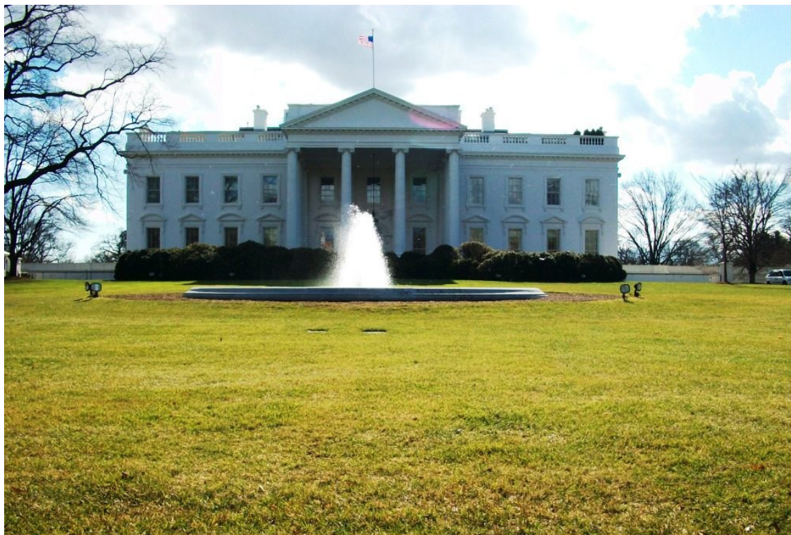
Det Hvide Hus d. 25. januar 2010 – fra nordsiden ved Pennsylvania Avenue

lodret. Efter ½ times meditation begyndte jeg langsomt vandringen rundt om Huset for at intensivere den offerild, der brænder hele vejen rundt i kanten af gralen. Inden rejsen havde det indre råd fremhævet, at det var en vigtig del af det indre arbejde at intensivere gralens offerild, for netop denne frekvens af Kristi ild bremser de modkræfter, der søger at stoppe Obamas og hans administrations fornyelsesarbejde. Vandringen rundt om Huset tog næsten 3 timer (dog afbrudt af ½ times frokost), fordi jeg flere steder oplevede, at nu gik en endnu stærkere og mere brændende strøm igennem mig – vel nok fordi der lige på dette sted skulle intensiveres ekstra kraftigt med offerild.