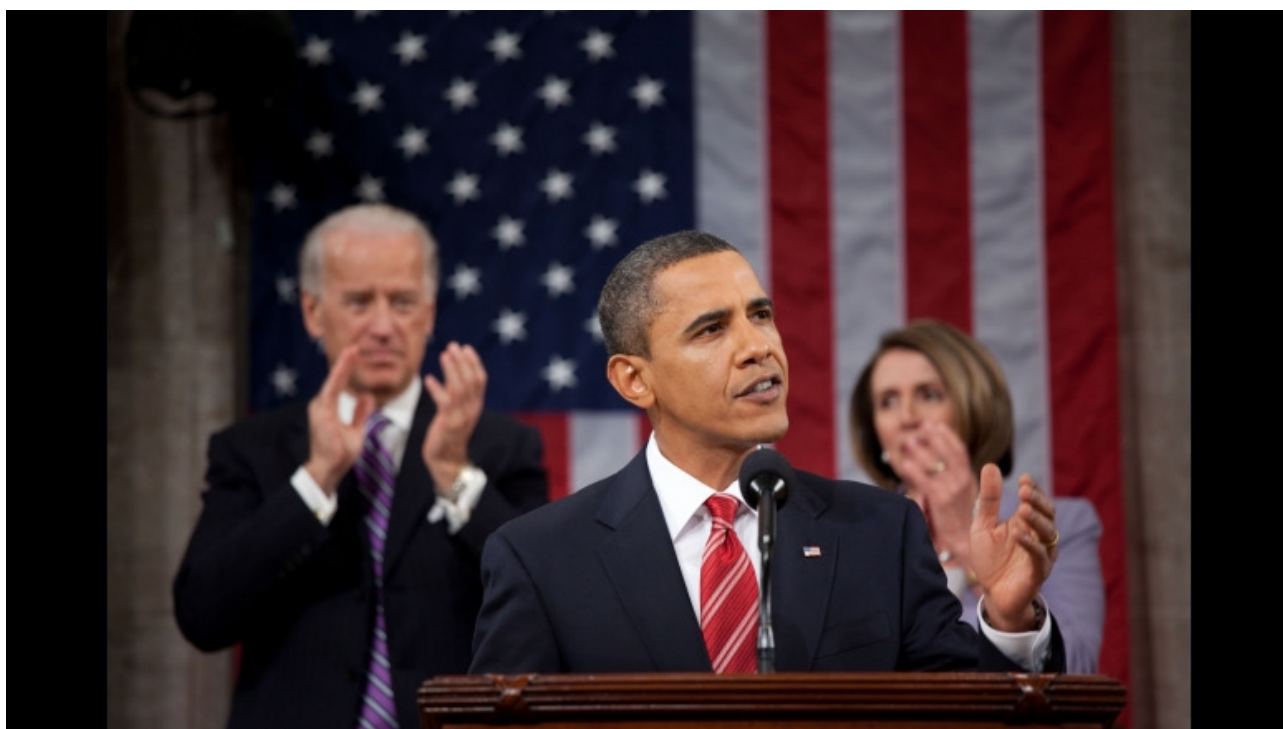
Obama under ”State of the Union Address” i Kongressen d. 27. januar 2010