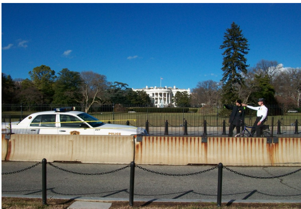
Det Hvide Hus fra sydsiden d. 25. januar 2010 Som det ses, kan vi ikke mere komme helt op til heget omkring parken

Også med mine søstre her på klosteret har jeg ført flere samtaler om Obama og den nye indenrigspolitiske situation, som de alle beklager, ligesom de udtalte, at de er blevet klar over, at de med Obama har fået en stor præsident, der er frigjort fra snævre særinteresser, og som gør et vedholdende visionært arbejde for at løfte USA's fattige og middelklassen og dermed skabe et samfund, der i langt højere grad er i tråd med kristne idealer, end den tidligere administration gjorde det.