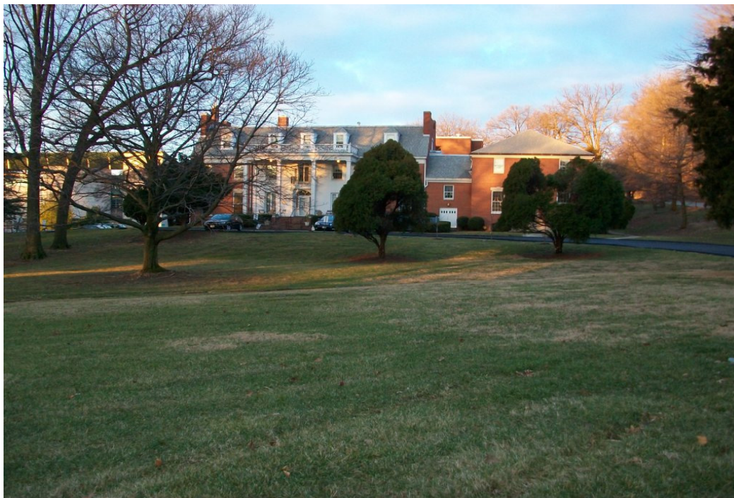
Washington Retreat House set fra parken i morgensolen d. 26. januar 2010 Et perfekt sted at bo for at have ro til det indre arbejde

Flyet tog en anden rute end sidste gang, hvor vi fløj så højt mod nord, at vi næsten ”rørte” Grønlands sydkyst. Denne gang drejede maskinen nærmest stik vest lige syd for Paris, og så gik der ellers godt 6 timer med at flyve over Atlanterhavet, førend vi igen fik land under os. Vi overfløj det sydlige Canada, som syntes totalt dækket med is og sne, men vejret skiftede, da vi fløj ind i USA, hvor der lå et tæt skydække, således at jeg først ved ankomsten i Washington kunne se, hvordan landskabet egentligt så ud her i januar måned. Det ligner umiddelbart meget normal vinter i Skandinavien. Efter en hård frostperiode og snestorm i december er naturens farver nu her i Washington grå/brune, og nedbøren kommer som regn. Det finregnede men var ganske lunt, da jeg i taxien blev kørt fra lufthavnen ind gennem centrum af byen, hvor jeg med gensynsglæde fik øje på Lincoln Memorial og senere Det Hvide Hus og US Capitol. Der blev således allerede på ankomstaften trukket yderligere ”spor” i den triangel, der går mellem disse vigtigste indstrømningssteder i Washington.