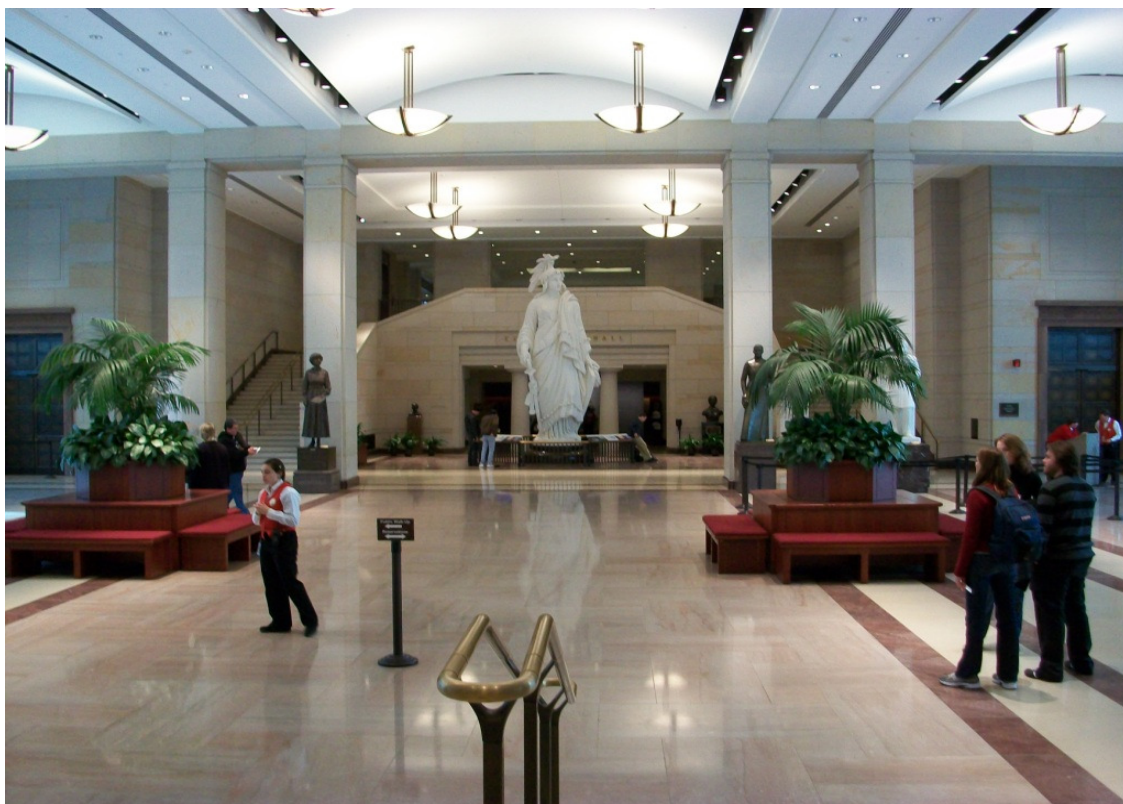
Indgangshallen til US Capitol – Statuen i baggrunden er en kopi af den frihedsstaute, der er på toppen af kuplen

Under rundvisningen i Kongressen ser vi også det første Senatslokale samt det lokale, som husede de første medlemmer af Repræsentanternes Hus, hvor uenigheder ofte blev søgt afgjort ved, at man simpelthen gik i fysisk håndgemæng. Endvidere opholder vi os i den meget smukke sal under den store imponerende kuppel, hvor guiden stolt fortæller om USA's historie ud fra de 8 store malerier, der hænger i rummet.