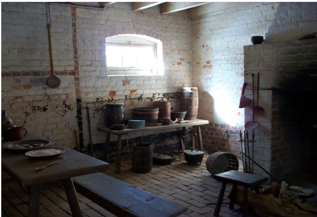
Et udsnit af slavernes kvarter på Mount Vernon – køkkenafdelingen. Det daglige måltid bestod af en mindre fisk og en brødlignende vælling. Det er ufatteligt, hvordan de kunne arbejde så hårdt på så lidt føde

Foruden at George Washington regnes som nationens fader, var han en banebrydende pioner også på andre områder. Som eksempel stod han på Mount Vernon for at udvikle landbruget, og tog metoder i brug, der var helt ukendte i hans samtid, ligesom han anlagde en urtehave og en botanisk have, som andre søgte at tage ved lære af.