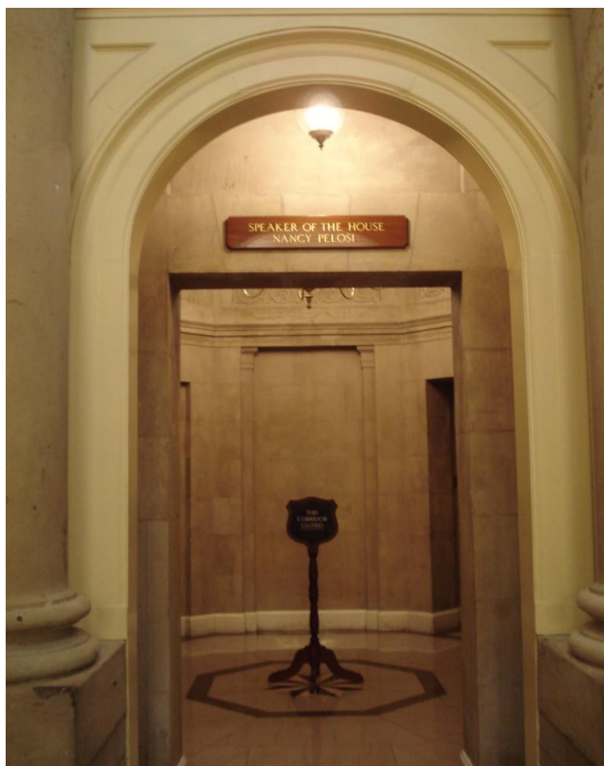
Indgangen til Nancy Pelosis kontorområde i Kongressen

Det er de færreste i Kongressen, der har en mere direkte adgang til dette høje mentale univers. Det vises, at der i Kongressen går en hel del rundt, der virker så formørkede, at de er helt stivnede – som sorte kulstykker. Men der går også en del kongresmedlemmer rundt med en god vilje, som er optagede af at gøre deres bedste, og som søger at tjene USA's brede befolkning, tjene nationen, være med til at løfte nationen. Der er nogle enkelte kongrespolitikere, der lyser meget stærkt. Det er en forbindelse mellem gralen i Det Hvide Hus og disse lysende politikere, der søges uddybet, således at disse kan næres og stå mere fast i den friktion, som de står i. Obama er mere beskyttet i Det Hvide Hus – af gralen der vibrerer så stærkt – således at den værste friktion, oplever han, når han går ud af Huset. Men de store lysende politikere i Kongressen står dagligt i denne friktion, fordi de direkte er omgivet af de kræfter, der modarbejder al fornyelse, der modarbejder al fremgang for den brede befolkning, der plejer særinteresser.”