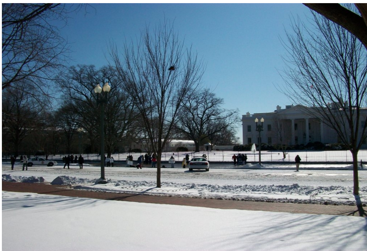
Det Hvide Hus d. 31. januar 2010 – Finansministeriet skimtes til venstre bag træerne

ASSISI MISSION - c/o Bente Wolf - Via Fortini 7 - I-06081 Assisi (PG) - Italy tel.: +39 075 8155 278 - e-mail: bente@assisimission.net web: www.assisimission.net