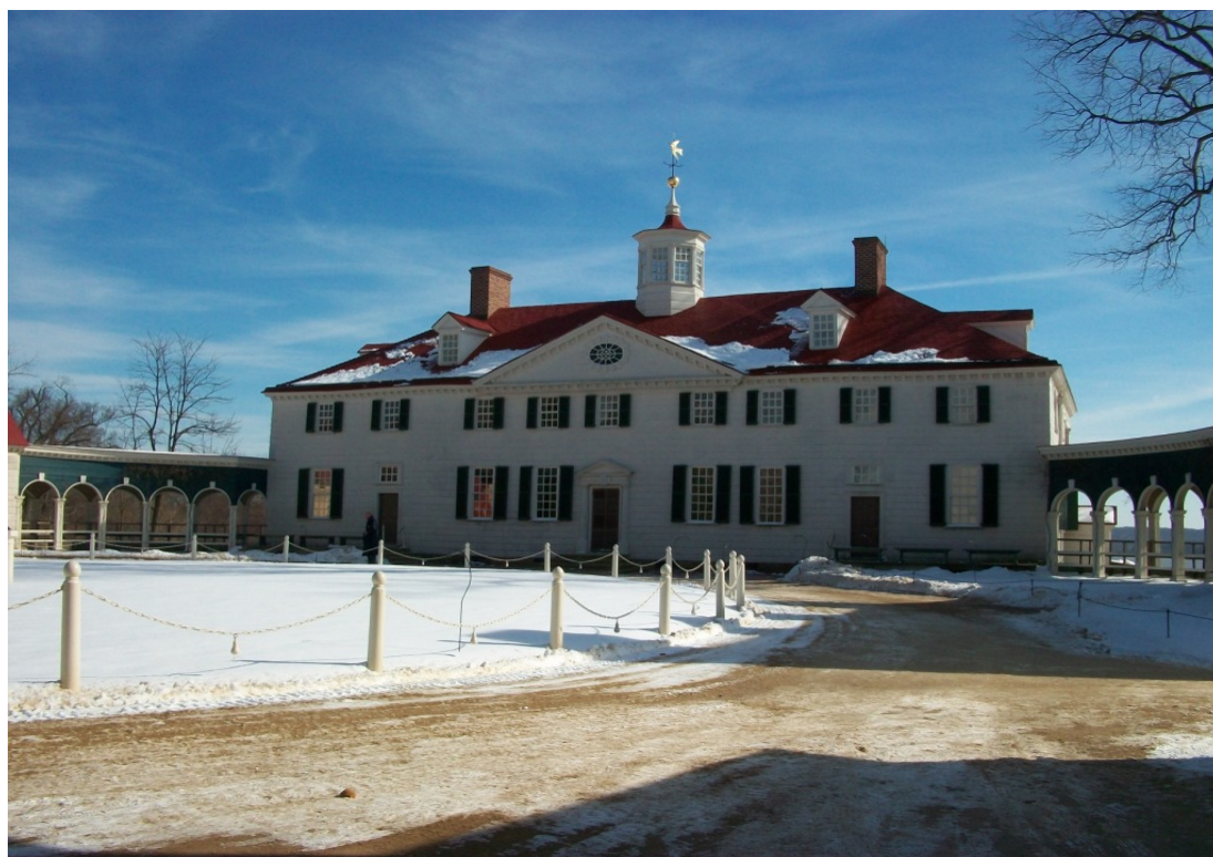
Hovedhuset på Mount Vernon med pragtfuld udsigt over Potomac-floden George Washingtons hjem og landsted

På vor fællesrejse til Washington i maj/juni vil vi hen mod slutningen af opholdet åbne os for healing efter nogle foregående dage, der måske har været præget af krævende indre arbejde. En healing i smuk, frodig natur kunne gå til Mount Vernon i Virginia, ca. 40 km sydvest for Washingtons bymidte. Mount Vernon er USA’s første præsident George Washingtons hjem og landsted beliggende på skråninger ned mod Potomac floden, og naturen er overordentligt frodig og