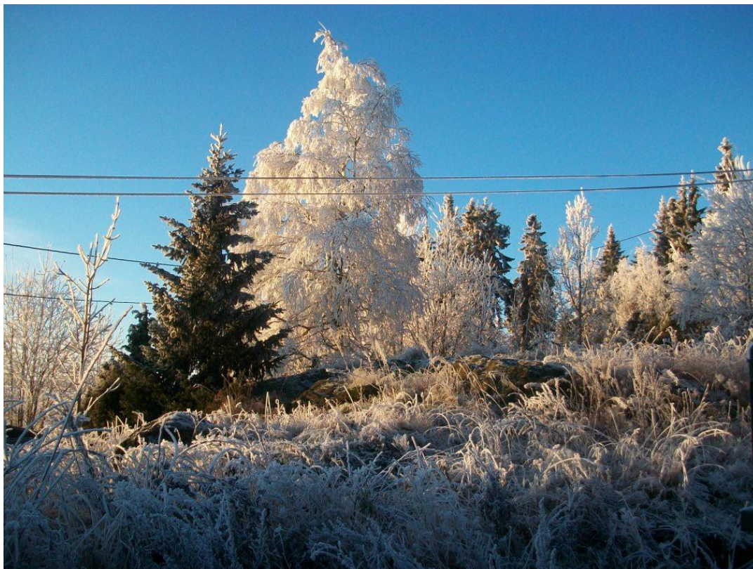
Det smukke højlandsområde Sollihøgda

med de mange hvide træer dækket af rimfrost mod den klare blå himmel og et indre meget believevende naturliv. Vi var bevidste om, at opgaven ved og på Utøya ville blive vanskelig, og Sollihøgda's skønhed gav os en opløftende hjælp til at begive os dybt ind i de tunge bevidsthedslag, der omgiver Utøya.