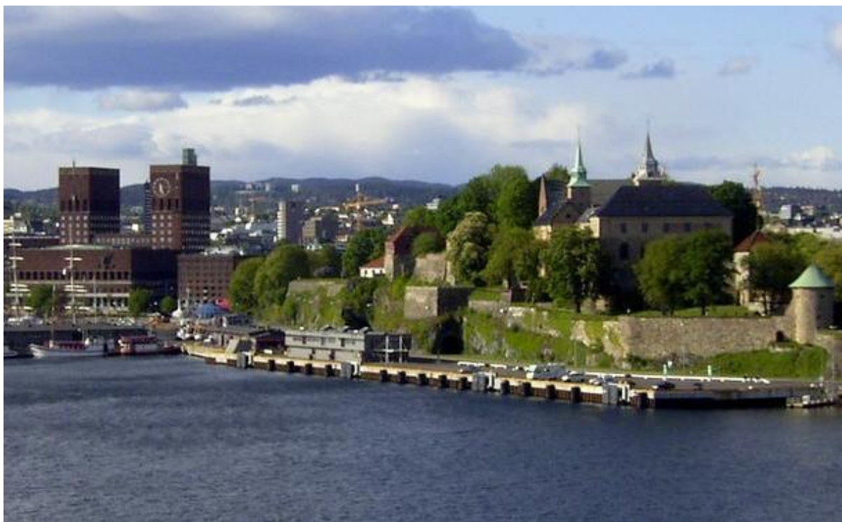
Akershus Festning – Oslos kendte vartegn i bunden af Oslo-fjorden.

som vi dog ikke kunne lokalisere i det store kompleks af bygninger spredt over et stort område.