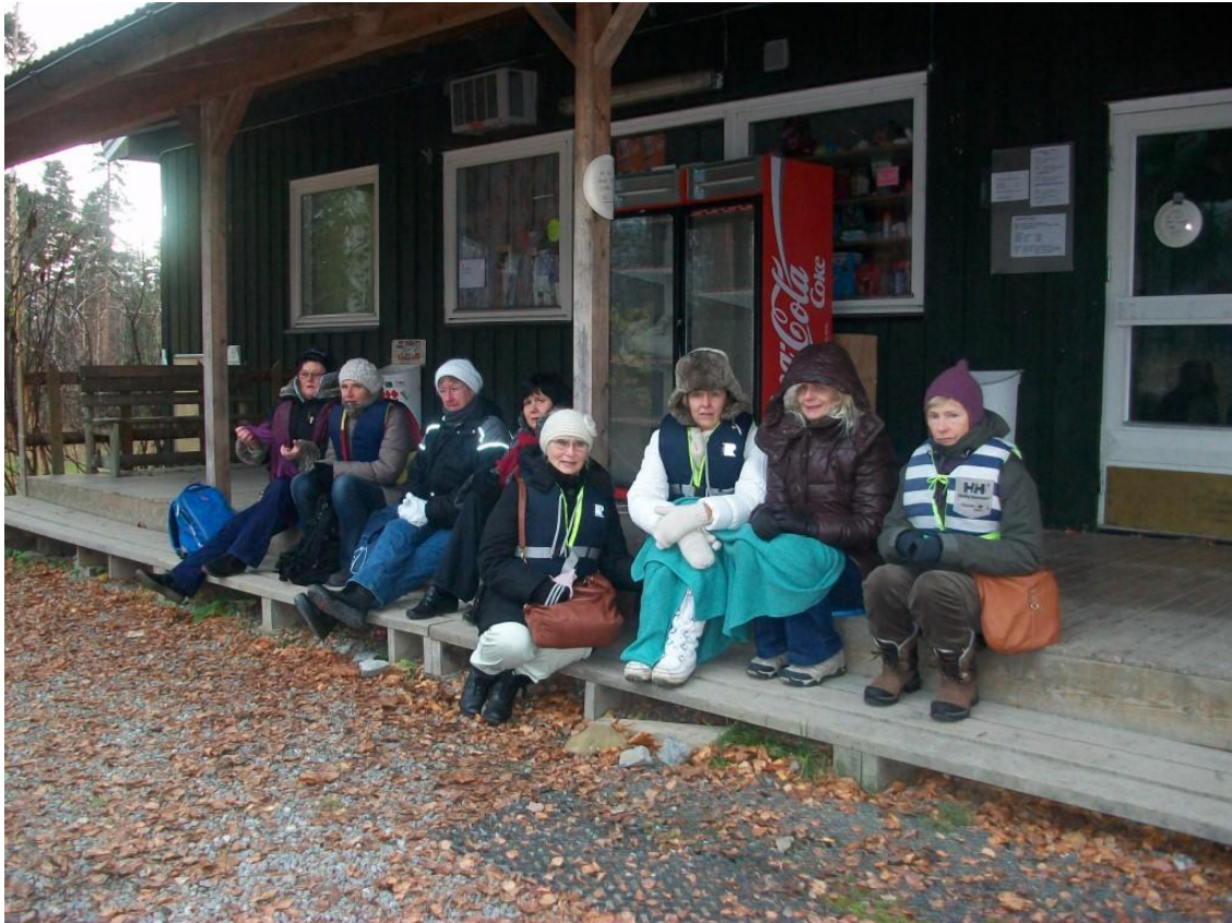
Tjeneste på Utøya - ved skolestuen på øens højeste punkt