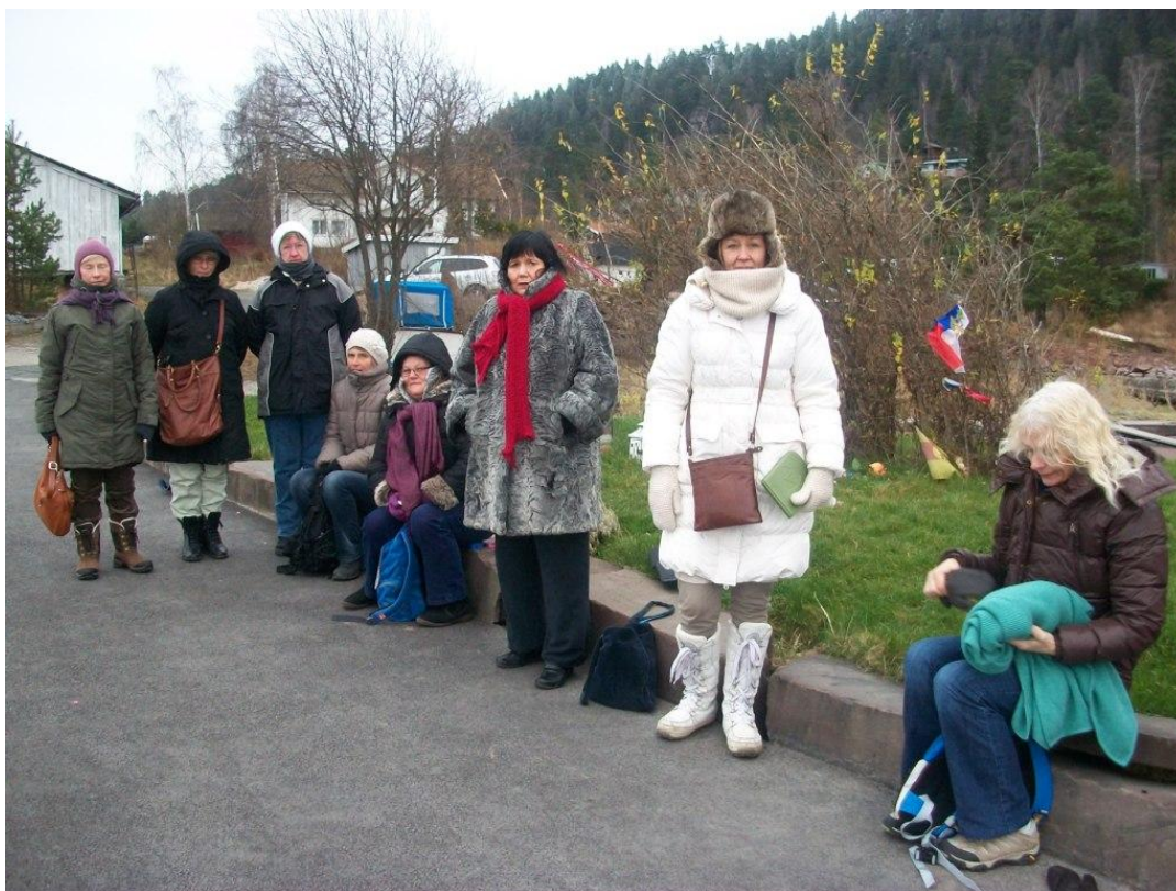
Kajen ved Utvika Camping, hvor vi havde vor første tjeneste om torsdagen

Vi steg ud af bilerne ved Utvika Camping og iklædte os ekstra varmt vintertøj til den senere kolde tur ud på vandet. I alt det vintertøj følte jeg mig nærmest som en tæt polstret astronaut, der kun vanskeligt kunne bevæge sig rundt på det fysiske, men hvor vægtløshed ville have været en stor hjælp. I den store sorgstemning var der dog ingen følelse af vægtløshed.