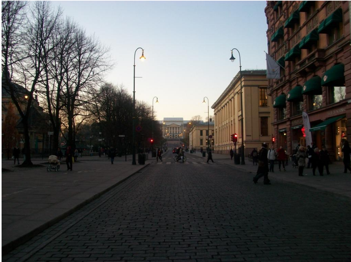
Karl Johans gate i skumringen med Kongeslottet i baggrunden