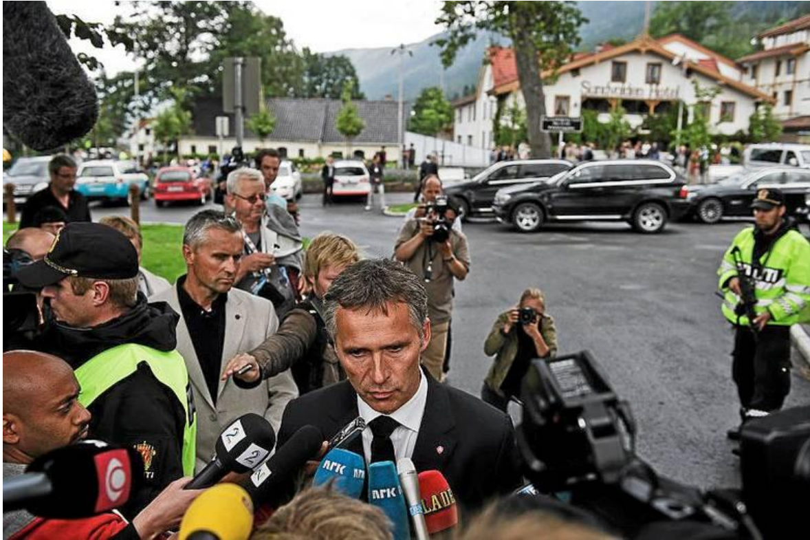
Sundvolden Hotel i dagene efter massakren

Nu var det blevet tid til varm og styrkende frokost, og denne foregik meget passende på Sundvolden Hotel , som efter massakren modtog og husede de mange overlevende, påførende, hjælpemandskab og politi, og som vi så meget mediedækning fra.