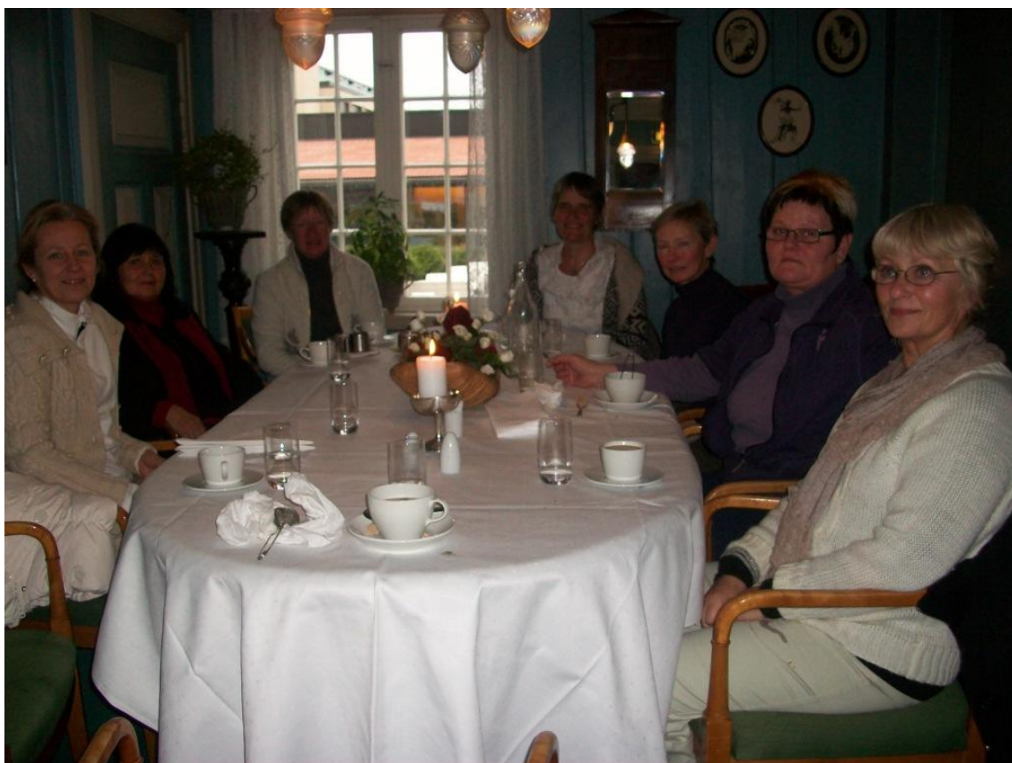
Frokost på Sundvolden Hotel – vi har lige fået at vide, at maden er en gave til os, fordi vi har bedt på Utøya