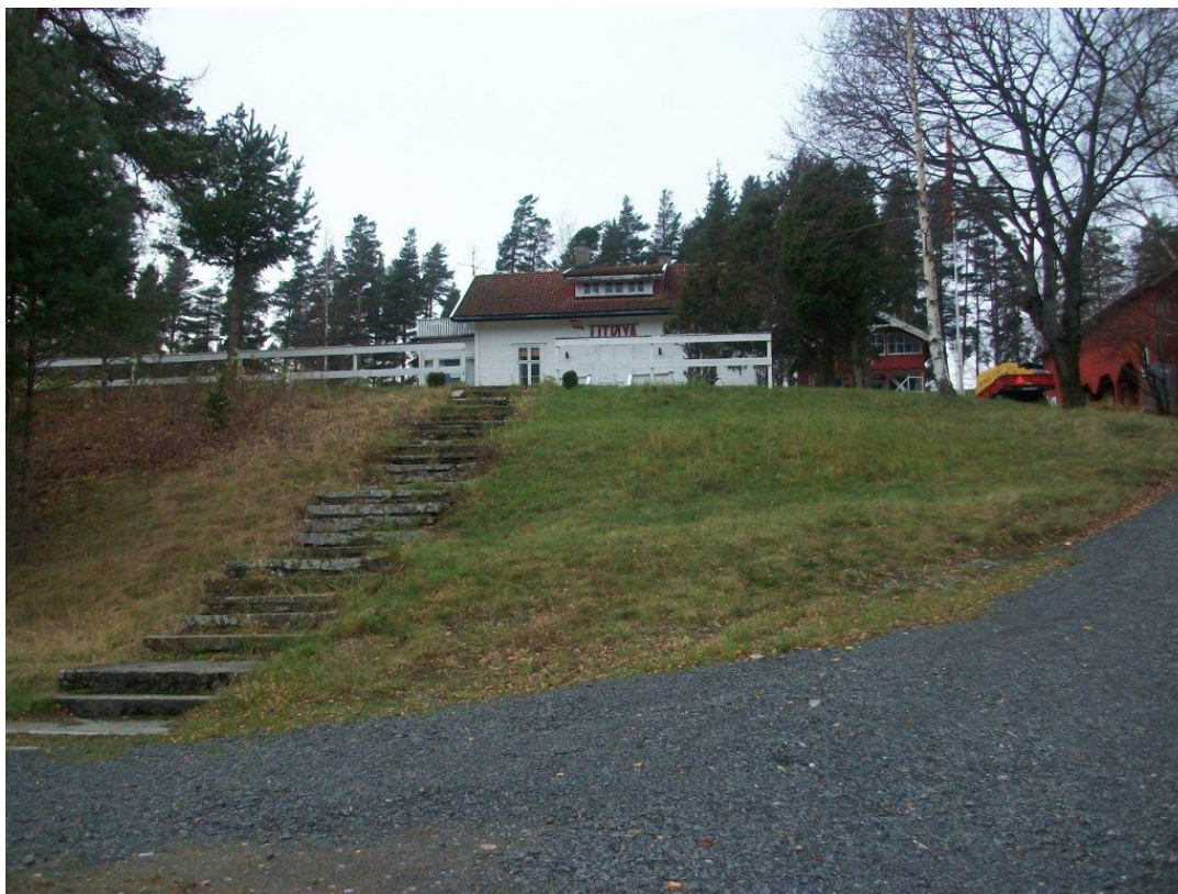
Det hvide hovedhus på Utøya

kvinder steg ud, og på min forespørgsel fortalte vor båd ejer os, at de havde fået ganske travlt i en ellers stille tid på året med at fragte mennesker over til øen.