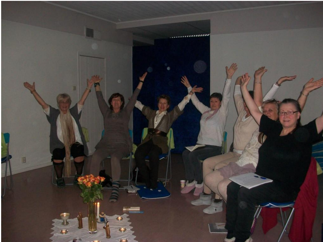
Nogle af os styrer ved afslutningen på kurset i Ålesund