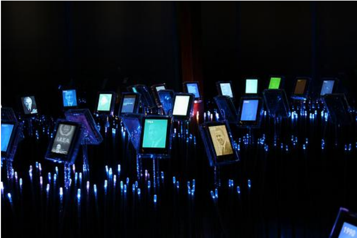
"Nobels Hage" hedder den permanente udstilling af fredsprisvindere på 1. salen i Nobels Fredscenter