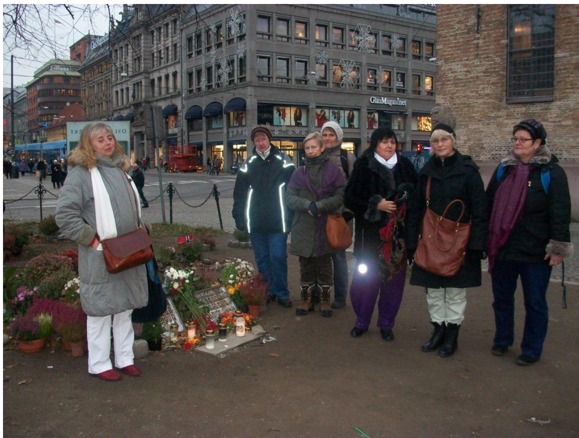
Ved blomster, lys og billeder uden for Oslos Domkirke

stod der, holdt flere forbipasserende en stund med stilhed og eftertanke ved mindesmærkerne. Det var en meget bevægende fordybelse for os – stor alvor og stilhed prægede os. Det er planerne at indrette en permanent mindelund i den lille park - en lund, der – når indstrømningen ind i Domkirken er stærk nok – sandsynligvis vil blive præget af den medfølelse, favnende Kristus- og Mariakærlighed som en hjælp til alle de mennesker, der i fremtiden vil fordybe sig her.