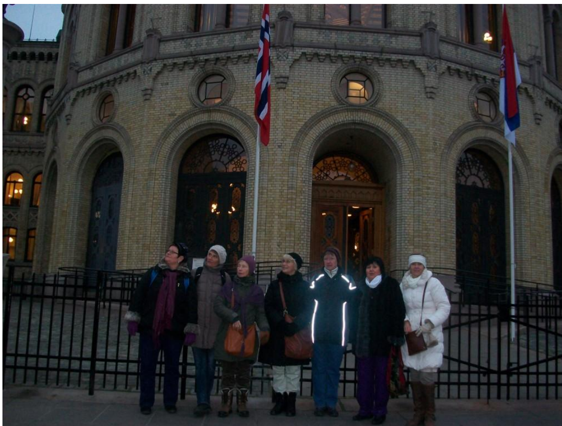
Indgangen til Stortinget

Som sidste udendørs-opgave denne første fælles dag trak vi spor til Stortinget , der svarer til Danmarks Christiansborg. Stortinget er en meget smuk bygning, og her dvælede vi i det begyndende tussmørke, førend vi fandt vej til "trikken" – det norske ord for de sporvogne, der er så almindelige i Oslos gadebillede.