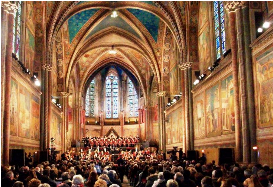
Julekoncert i Basilica di San Francesco, december 2010

Julekoncerten transmitteres i Eurovision af den statslige italienske tv-kanal, RaiUno, d. 25. december kl. 12.30 efter Pavens velsignelse "Urbi et Orbi" fra Peterspladsen, som starter kl. 12.00. Det er hvert år en meget smuk koncert med en verdenskendt dirigent, RaiUno's store symfoniorkester, Basilikaens kor, et børnekor samt forskellige solister. I år er det bl.a. den amerikanske sanger Randy Crawford, der er solist. Den redigerede koncert, der transmitteres 1. juledag, er suppleret med smukke billeder fra Assisi og fra freskerne i Basilikaen, der gør den endnu mere stemningsfyldt og inderlig. Flere lande jorden over sender koncerten direkte d. 25. december eller senere. De modtagere i Skandinavien, hvis tv-programpakke indeholder RaiUno, vil kunne se koncerten, og det ved jeg, at flere læsere af ASSISI-NYT ser frem til hvert år.