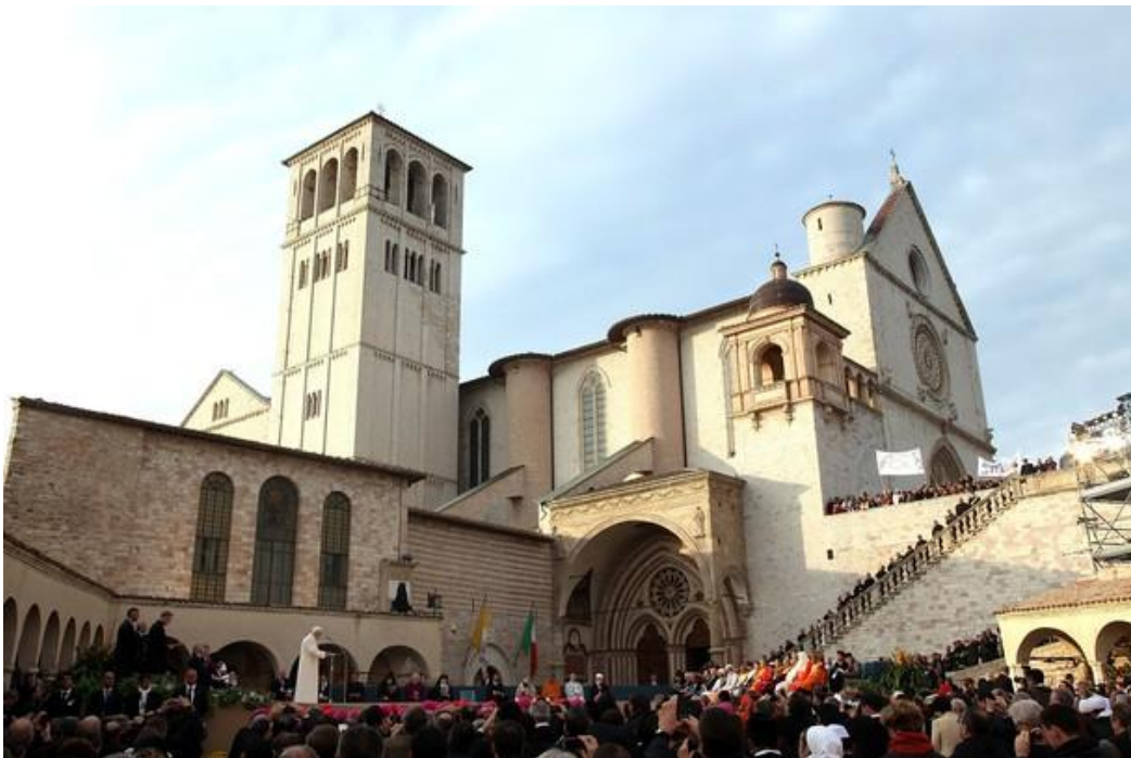
Piazza Inferiore d. 27. oktober 2011

Mødet startede i Basilica di Santa Maria degli Angeli, hvor de mest prominente af lederne skiftedes til at give et indlæg. Efter en ydmyg franciskansk frokost med brødrene i Porziuncola blev mødedeltagerne kørt til Assisi, hvor eftermiddagens program på Piazza Inferiore foran Underkirken skulle finde sted.