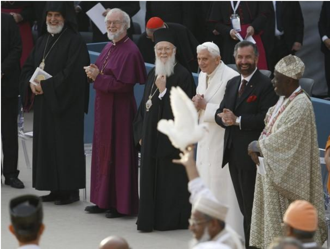
Fredsduerne skabte en stemning af glæde

fredsduer løs, blev den smukke meditative stemning fyldt med glæde, som det ses på fotoene nedenfor.