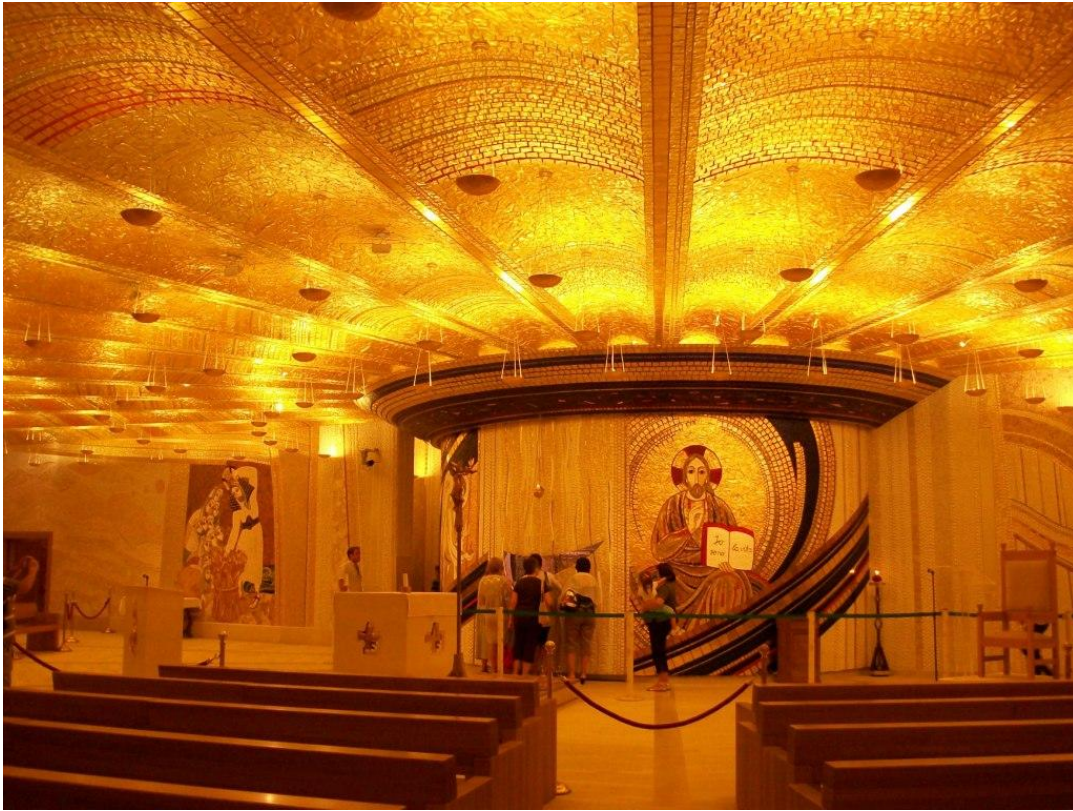
Syditalien, San Giovanni Rotondo i september 2011 - Den Gyldne Krypt med Padre Pios grav

hvor dybt meningsfyldte og opløftende sådanne aktiviteter er. Denne er beskrevet i ASSISI MISSION NYT nr. 5 i 2011.