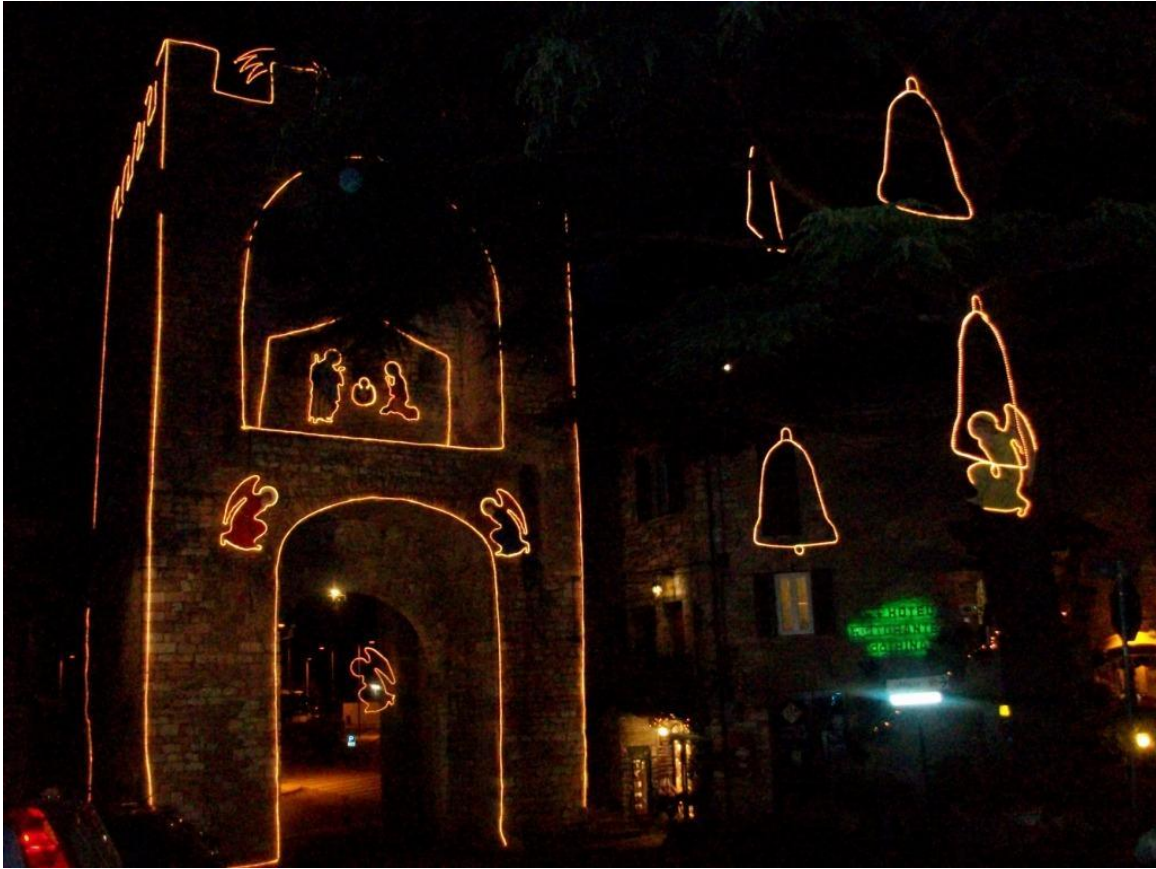
Julebelysning i Assisi julen 2011

ASSISI MISSION ♦ c/o Bente Wolf Via Fortini 7 ♦ I-06081 Assisi (PG) ♦ Italy tel: +39 075 8155 278 ♦ e-mail: bente@assisimission.net web: www.assisimission.net