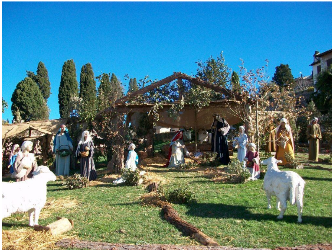
Udsnit af den store Bethlehemscene på plænen foran Overkirken til Basilica di San Francesco