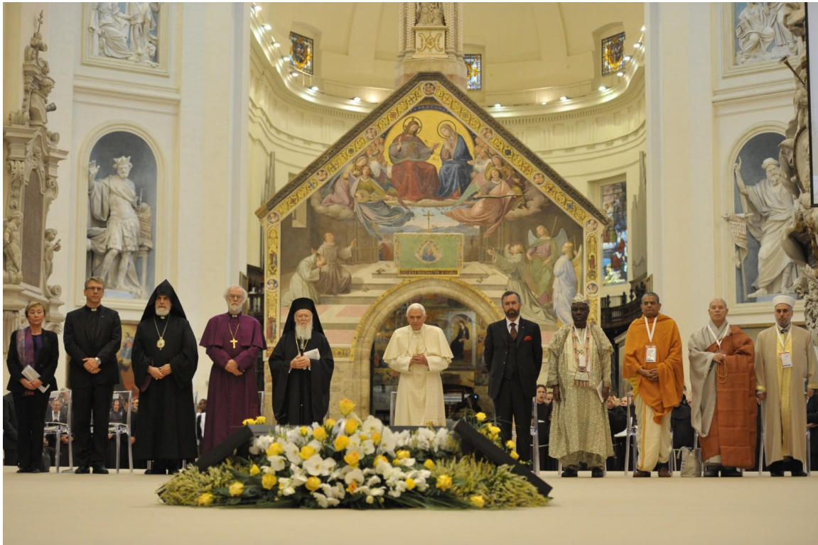
27. oktober 2011, verdensreligionerne til fredsmøde i Assisi

http://martinbenedict.org/lingue/eng.html