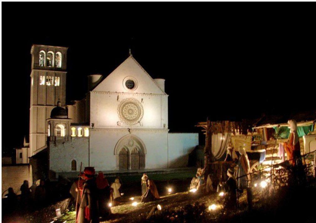
Bethlehemsscenen på plænen foran Basilica di San Francesco

Joseph Mohr gav digtet til sin ven, skolemesteren og organisten Franz Xaver Gruber, som satte musik til. Salmen blev for første gang opført julenat 1818 under midnatsmessen i Oberndorf, hvortil Joseph Mohr nu var blevet overført. Joseph Mohr døde i 1848 lige så fattig som han var kommet til verden, fordi han gav hele sin indkomst til uddannelse af unge mennesker og til pasning af de ældre i sognet.