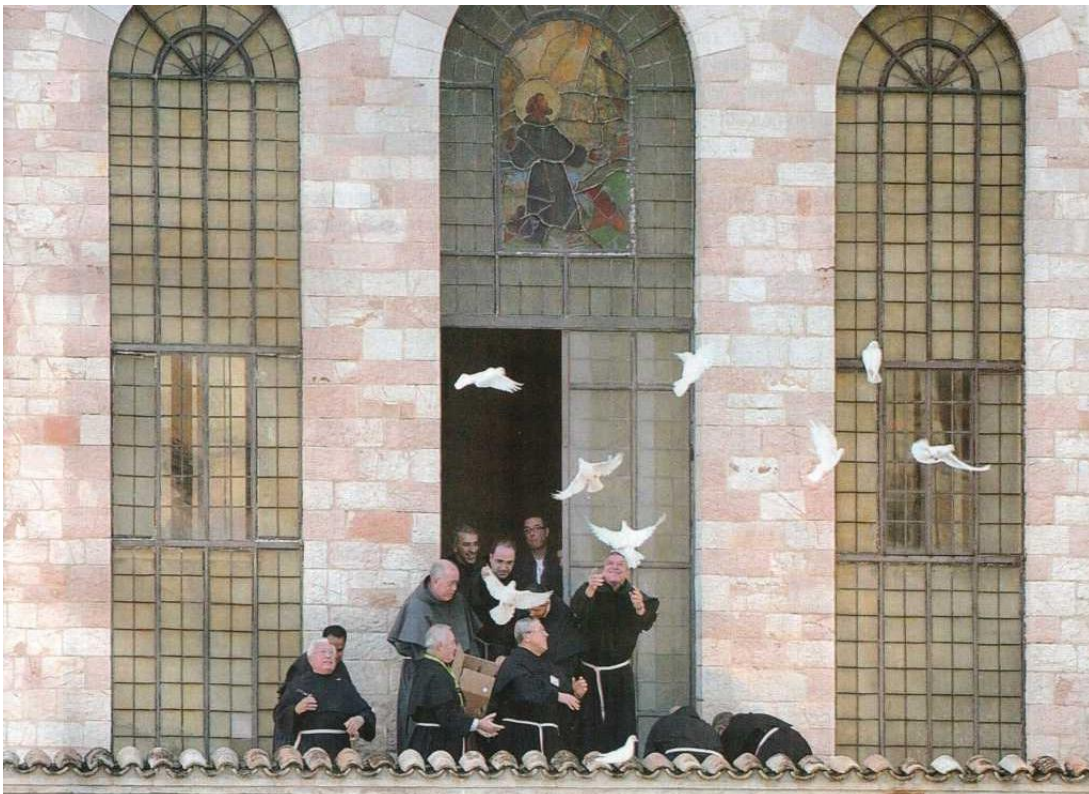
Brødrene på Sacro Convento slipper de 27 hvide fredsduer løs