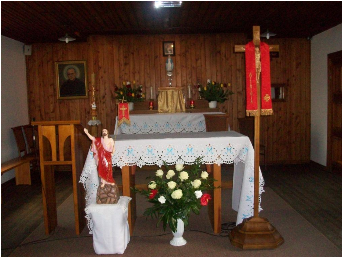
Polen i maj 2011 - alteret i Maximilians Kolbes trækirke fra 1927, hjertet på Niepokanalow

tænker jeg også tilbage på lysrejserne med stor glæde efter de indre inspirationer om, at de gjorde en forskel for Guds arbejde med helliggørelse af jorden og menneskeheden.