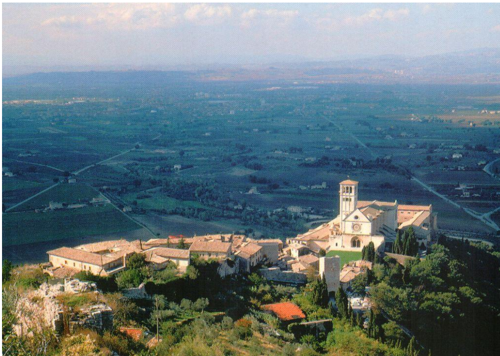
Assisi-gralen med et focus i Basilica di San Francesco