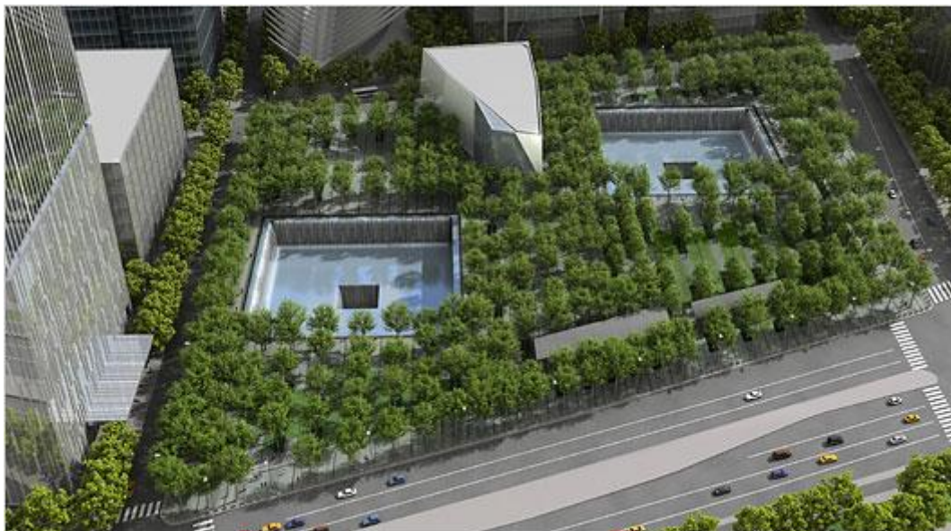
Mindeparken 9/11 i New York på stedet, hvor de to tvillingetårne stod. Mindeparken åbnes officielt d. 11. september 2011