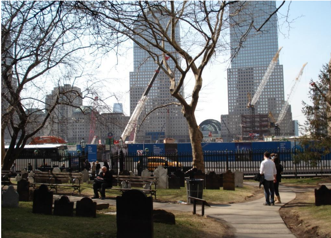
Byggepladsen Ground Zero set fra den lille kirkegård til St. Paul Chapel i januar 2009