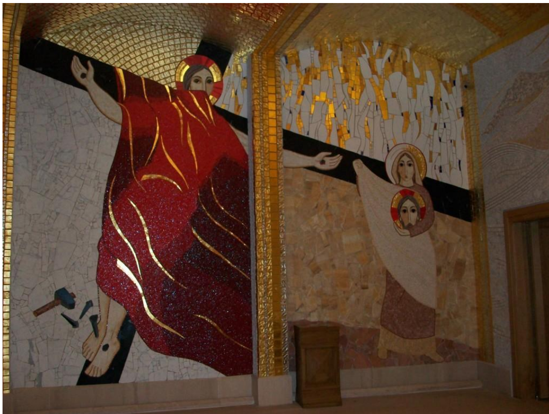
Udsnit af Den Gyldne Krypt i San Giovanni Rotondo, der i dag rummer Padre Pios grav

Jeg glæder mig ser meget til atter at drage til Washington med en gruppe, og ser også frem til at fordybe mig i Martin Luther Kings pionermission og hans nøgleforståelser om demokrati, retfærdighed, håb og kærlighed, når vi næste år opholder os ved Potomac Rivers smukke Memorials og indstrømningssteder.