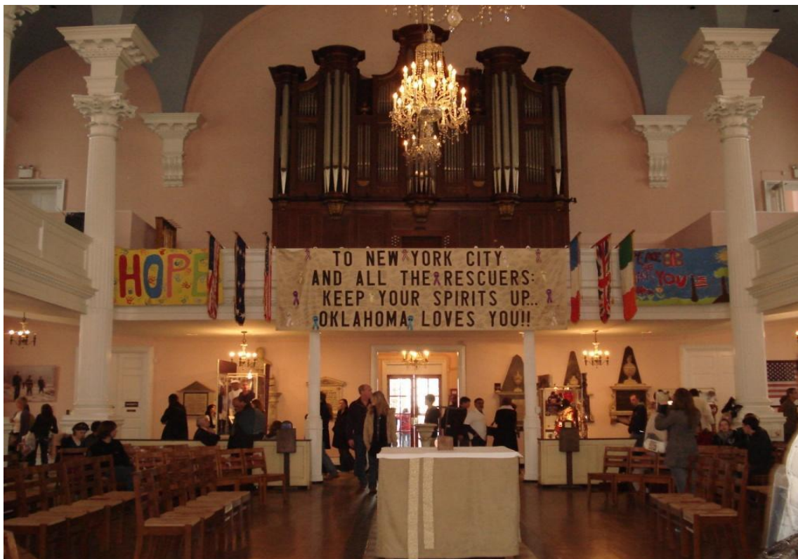
Kirkerummet i St. Paul Chapel er fyldt med minder fra hjælpeindsatsen efter terrorangrebet på World Trade Center

også til overnatning - og hvor de kunne blive stille, bede og komme til hægterne efter endnu en hjertegribende tårn med at grave i ruinerne og finde de døde.