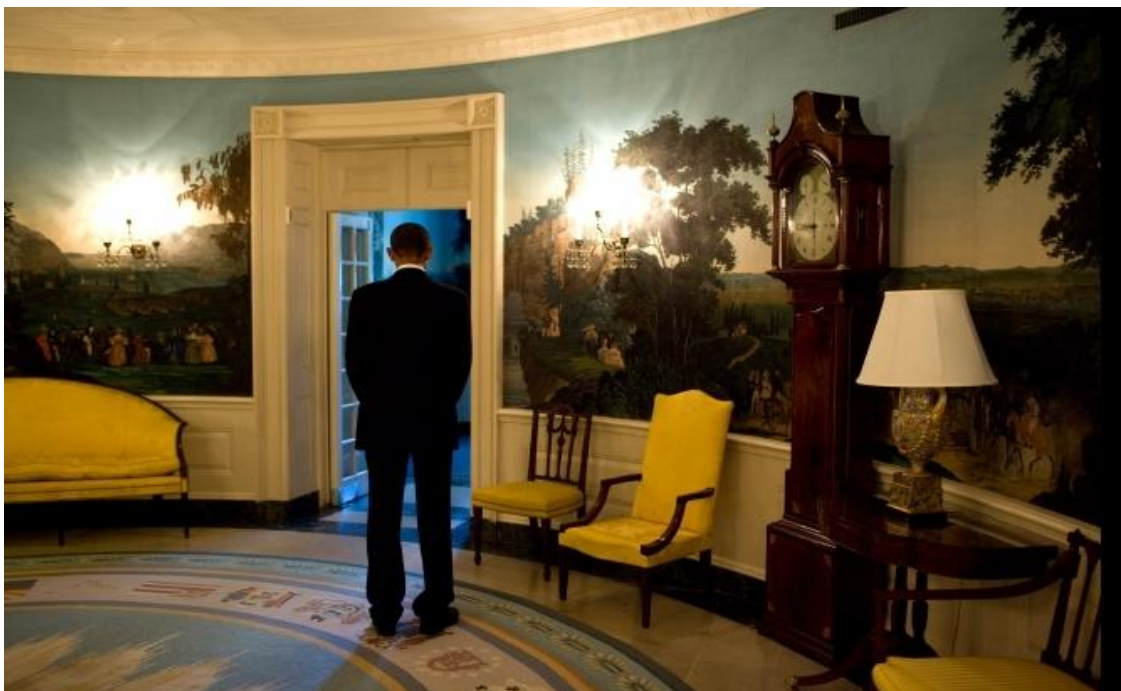
Barack Obama i et øjeblik bøn d. 11. september 2010

Lad os stå vedholdende i vor støtte til Barack Obama. Han har mere brug for det end nok nogensinde tidligere i den intense friktion mellem fornyelse og konservatisme, som han lige nu står i.