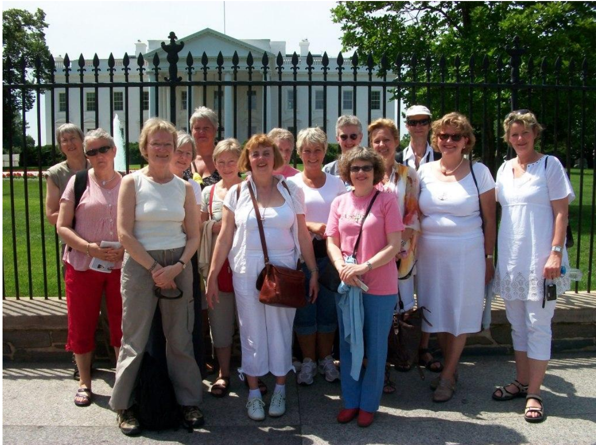
Efter vor første tjeneste ved det Hvide Hus i maj 2010