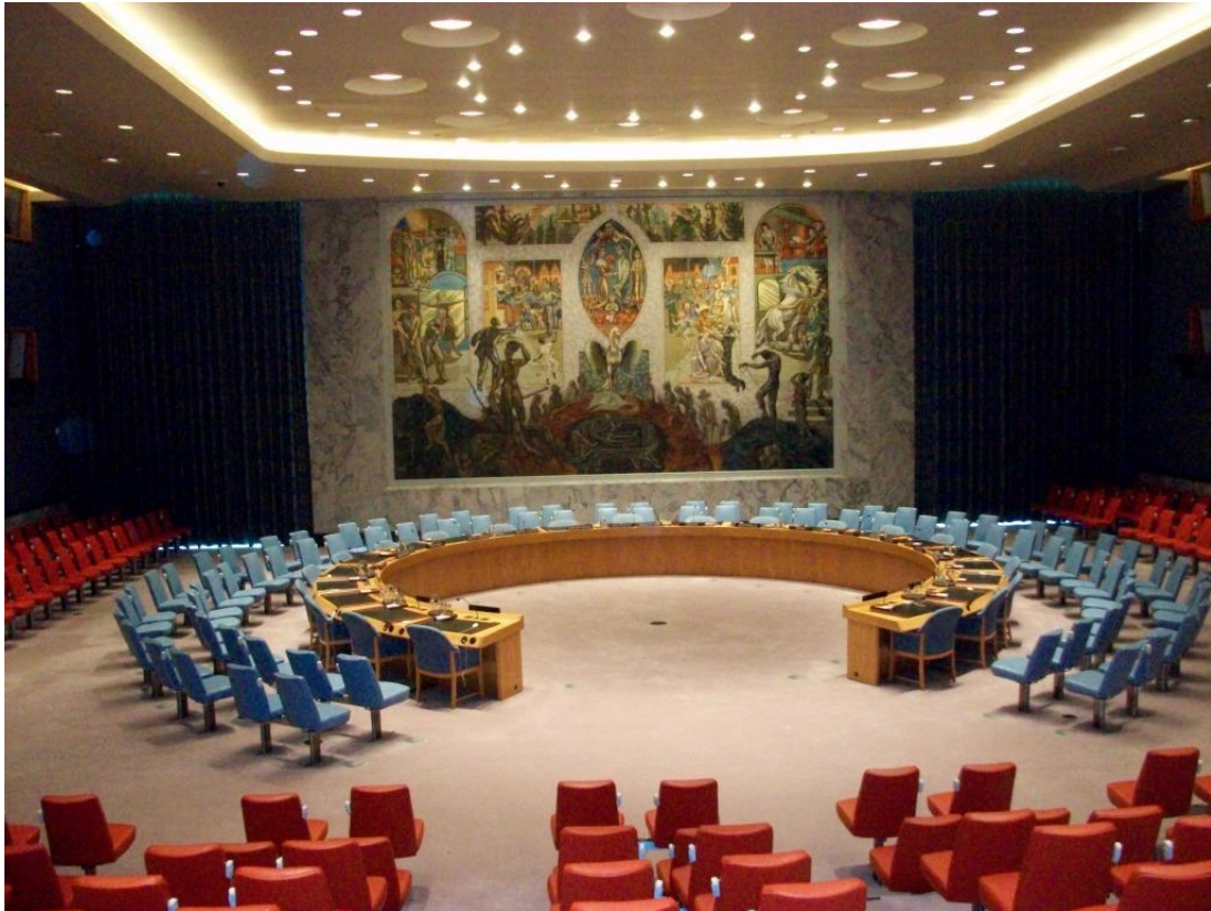
FN, Salen for Sikkerhedsrådet, under vort indre arbejde d. 27. oktober 2014

særligt fokus på situationen i Ukraine, og under flere meget kraftfulde tjenester især på Niepokalanow strømmede der hjælp fra Niepokalanow-gralen til indstrømningsfoki i Ukraine.