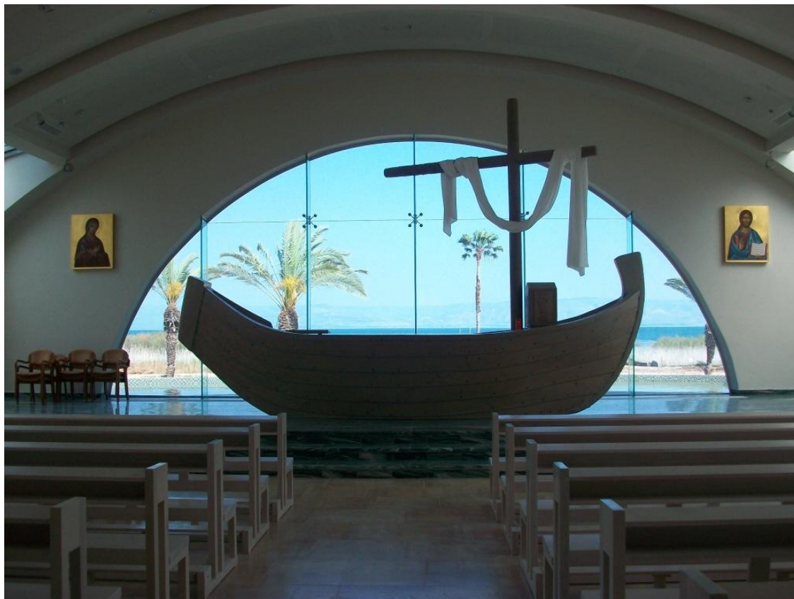
Den meget smukke, nyåbnede kirke i Magdala ved bredden af Geneserat Sø i april 2014. Maria Magdalene kom fra Magdala

Det er naturligvis en særlig stor glæde for mig at tænke tilbage på Assisi Missions aktiviteter med retræter i Assisi og udenlands i 2014. Under disse retræter er det med en følelse af stor mening og nytte, at jeg har delt en længere periode - fra en weekend og op til 12 dage - med søgende mennesker og dermed nået en fælles endnu dybere absorbering ind i "the Spirit of Assisi" . Blandt disse aktiviteter i Assisi Mission i 2014 tænker jeg også tilbage på lysrejserne med særlig stor glæde efter erfaringerne undervejs på rejserne og de indre inspirationer om, at de gjorde en forskel for Guds arbejde med helliggørelse af jorden og menneskeheden. Assisi Missions særlige meditationsgruppe, hyrdegruppen, inviteres altid med i det indre på disse rejser, og således er vi bevidst flere af sted, end de personer, der også i det ydre er med på lysrejsen.