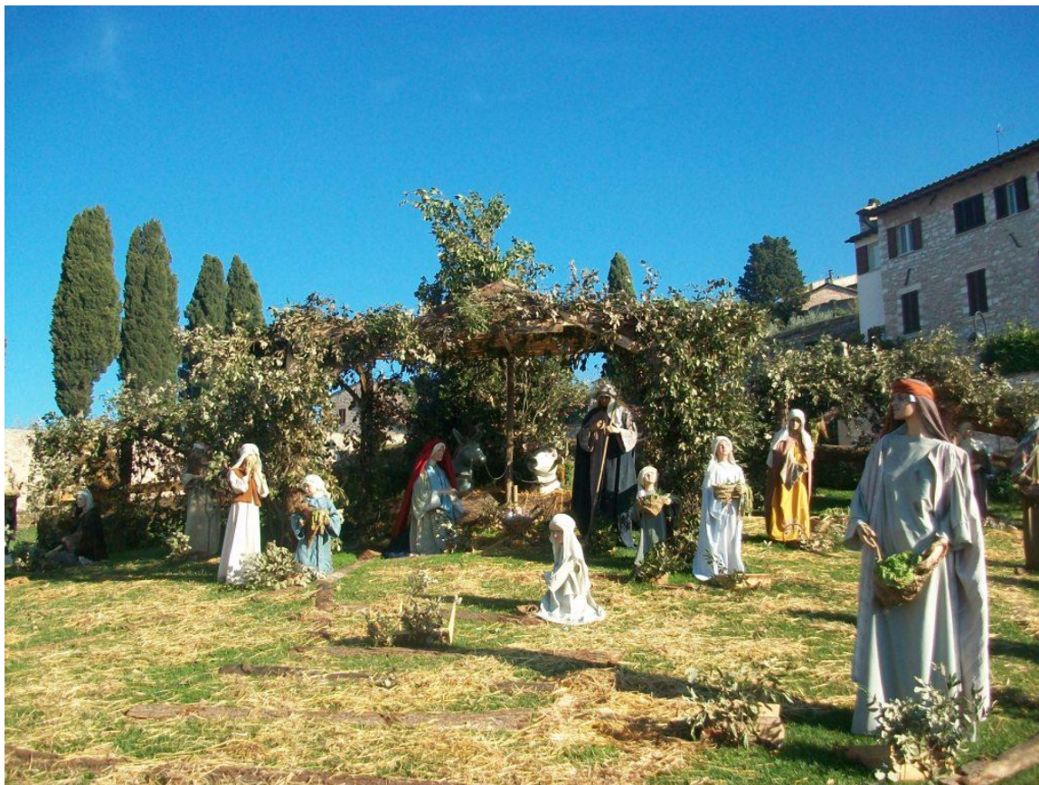
Udsnit af den store Bethlehemscene på plænen foran Overkirken til Basilica di San Francesco i julen 2014