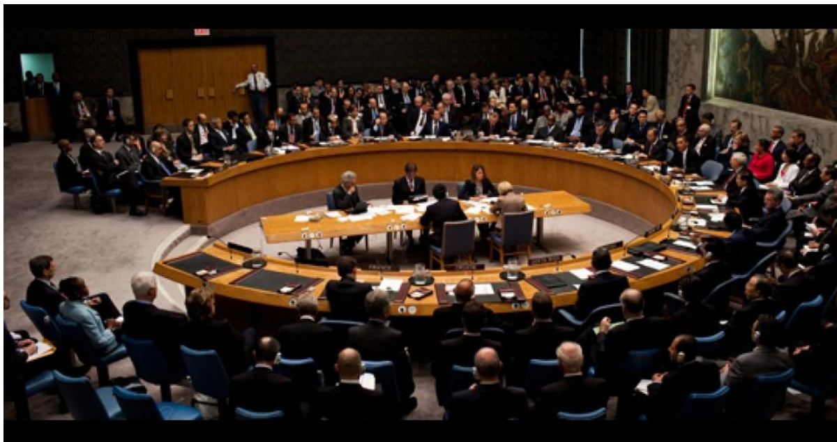
Møde i FN's Sikkerhedsråd d. 12. Juli 2014 om krigen mellem Israel og Gaza. Mødet endte med en enstemmig opfordring til våbenhvile.

Det vises også, at kampen aftager. Lyset vinder frem, og det anbefales vi at holde som en vision. Lyset vinder frem.