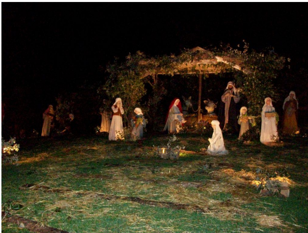
Bethlehems-scenen 2014 ved nattetide

I Assisi er vi således nu ved at gøre os klar til en af årets smukkeste fejringer, Jesu fødsel, der i Italien først ophører d. 6. januar med festen for De Hellige Tre Kongers tilbedelse af Jesusbarnet.