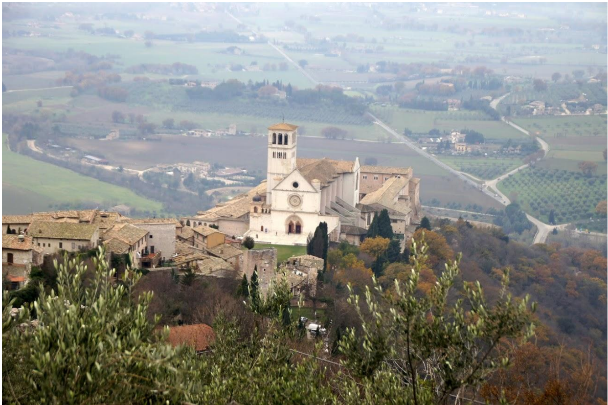
Basilica di San Francesco i julen 2012

Sandsynligvis vil også de største af julens og nytårets højmesser i Basilica di San Francesco, Underkirken, hvor det dygtige kor synger, blive streamet, nemlig følgende: