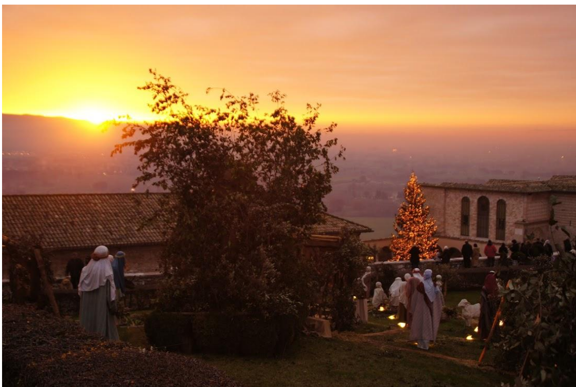
Julestemning ved Basilica di San Francesco i julen 2012

http://www.assisimission.net/images/stories/nyhedsbreve/2008_06_august.pdf