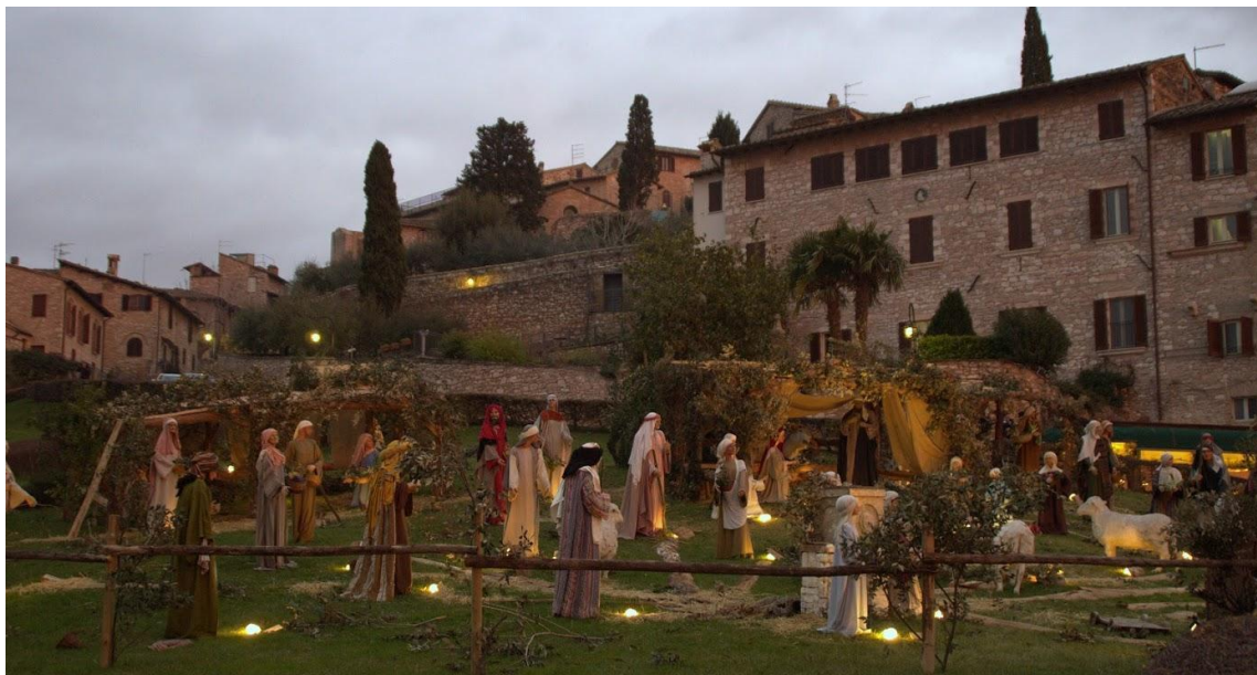
Bethlehemsscenen på plænen foran Basilica di San Francesco i julen 2012