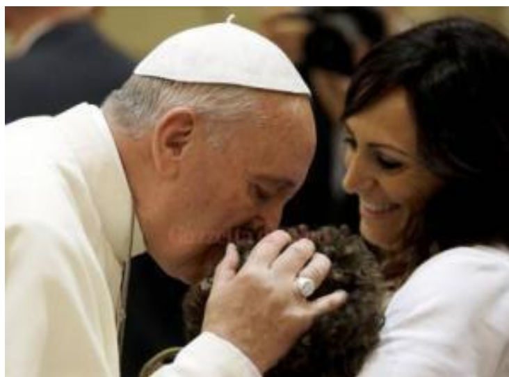
Pave Frans i Assisi d. 4. oktober 2013. Hans første besøg i Frans' by.

Jeg glæder mig fortsat inderligt over den begivenhed i Den Katolske Kirke, der har vækket så meget håb hos millioner af mennesker jorden over, nemlig det overraskende valg i marts 2013 af Pave Frans som Den Katolske Kirkes leder. I hans gennem sit nu 1 år og 10 måneder gamle pontifikat har han i fodsporene på Frans af Assisi ved sit eget eksempel sat et kærlighedens og medfølelsens fokus på de lidende og mest marginaliserede brødre og søstre jorden over, startet vigtige tiltag til reformer i kirkens ledelse og i udtalelser antydet en blødgøring af kirkens forståelser og praksis, der giver meget håb, mod og fortrøstning. Også på den verdenspolitiske scene er han trådt frem, og har - som det netop er afsløret - spillet en positiv rolle i optøningen af forholdet mellem USA og Cuba. Han er dermed trådt i fodsporene på den nyligt helgenkårede Pave Johannes Paul II, der spillede en afgørende rolle omkring Murens fald. Pave Frans beder altid mennesker, han møder, om at bede for sig, for han er bevidst om sin store og vanskelige opgave. Denne opfordring til indre støtte kan vi prioritere også i 2015.