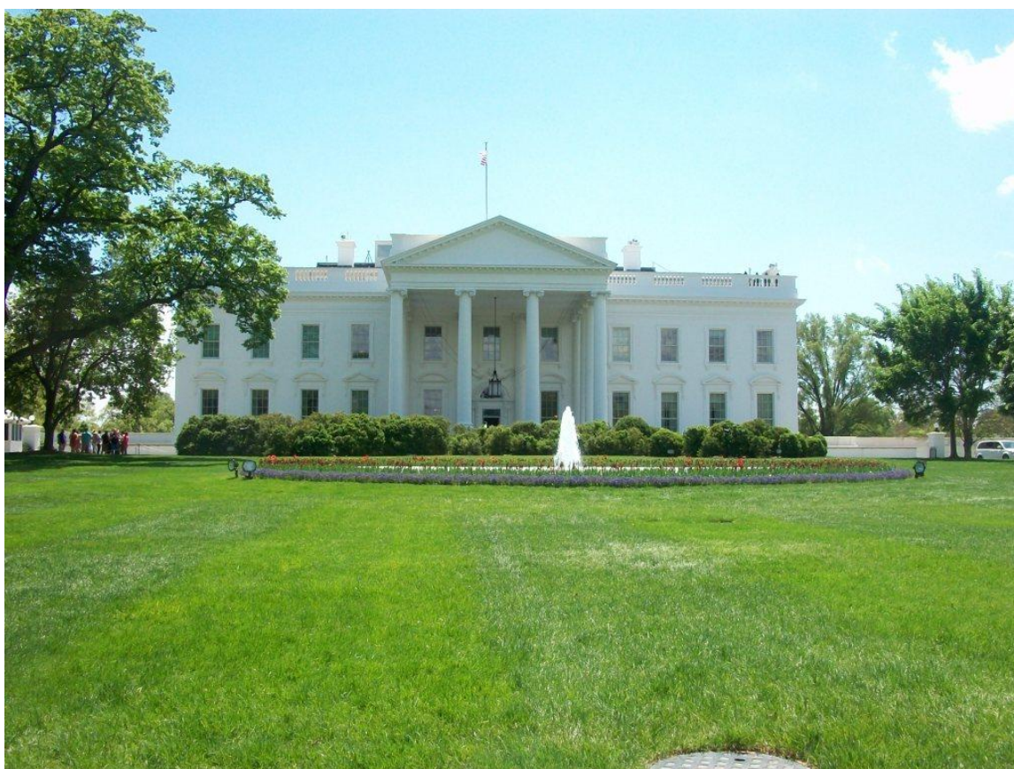
Det Hvide Hus d. 3. maj 2014 set fra Pennsylvania Avenue

http://www.assisimission.net/images/stories/nyhedsbreve/2014_Det_Hellige_Land.pdf