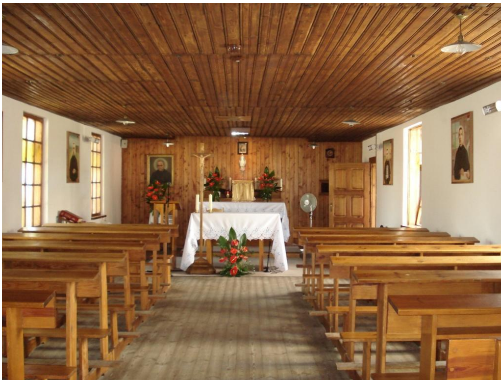
Maximilian Kobles ydmyge trækirke fra 1927 på Niepokalanow, hvor han celebrerede utallige messer