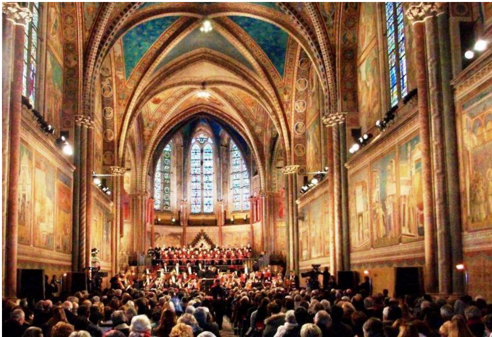
Julekoncert i Basilica di San Francesco, december 2010

I den uendeligt smukke julenat, hvor engleriget sitrer intenst i himmelsk glæde, og de efterfølgende juledage intensiveres hjælpen fra Gudsriget, som stimulerer det enkelte menneske og menneskeheden som helhed til de levendegørelser, der fører til fødslen af Kristus som Kærlighedens og Medfølelsens Herre i hjertecenter efter hjertecenter over hele Jorden. Vi kan år for år vælge at gå mere og mere indad og lade os absorbere dybere og dybere ind i englerigets uendeligt smukke indstrømning af ekstatisk glæde, kærlighed og fred og dermed lade Kristus fødes på dybere og dybere niveauer. Samtidigt med, at vore hjerter fyldes af det indre Kristusliv, kan vi lade dette liv strømme videre ud i menneskeheden kollektive hjertelag. Denne indre opmærksomhed og tjeneste er for mange af os den største gave, som vi kan give ikke blot til vore nærmeste, men også til alle vore øvrige brødre og søstre på vor smukke men lidelsesfyldte og trængselsplagede jord.