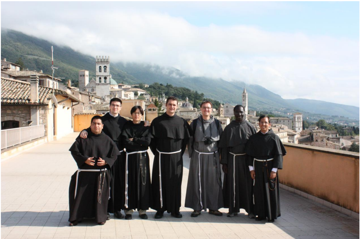
En gruppe unge brødre fra flere lande, der studerer på Ordenens universitet i Rom, er kommet til Assisi for bl.a. at blive undervist i interreligiøs dialog. Her ses de på CEFID's terrasse.