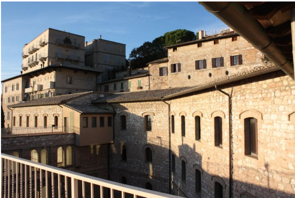
CEFID set fra tagterrassen.

Denne istandsættelse af CEFID skal hvis muligt gerne være færdig inden festdagen d. 28. marts og naturligvis også før de første overnattende grupper kommer til CEFID fra maj måned.