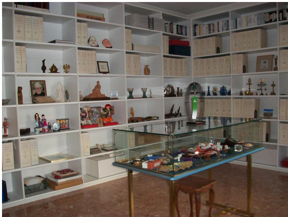
Pater Mizzis museum på CEFID i januar 2015.