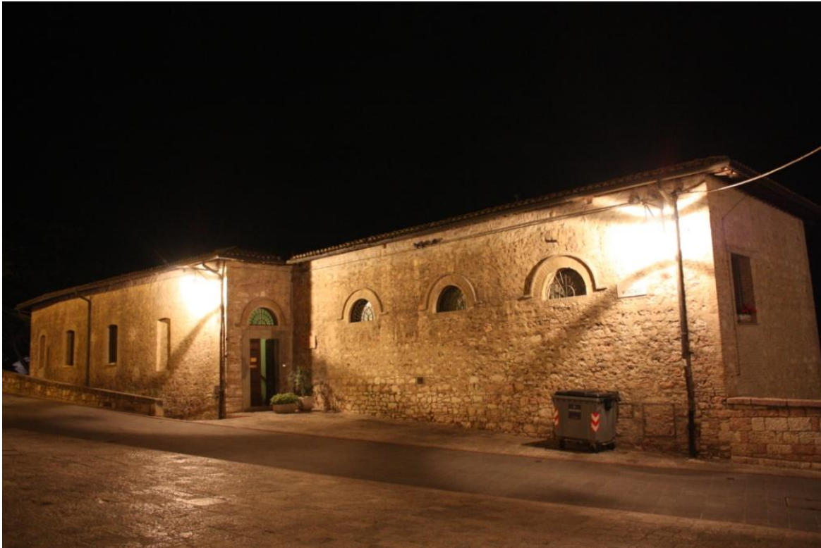
Indgangen til CEFID's øverste etage med mødesal, kapel, museum og kontorer.