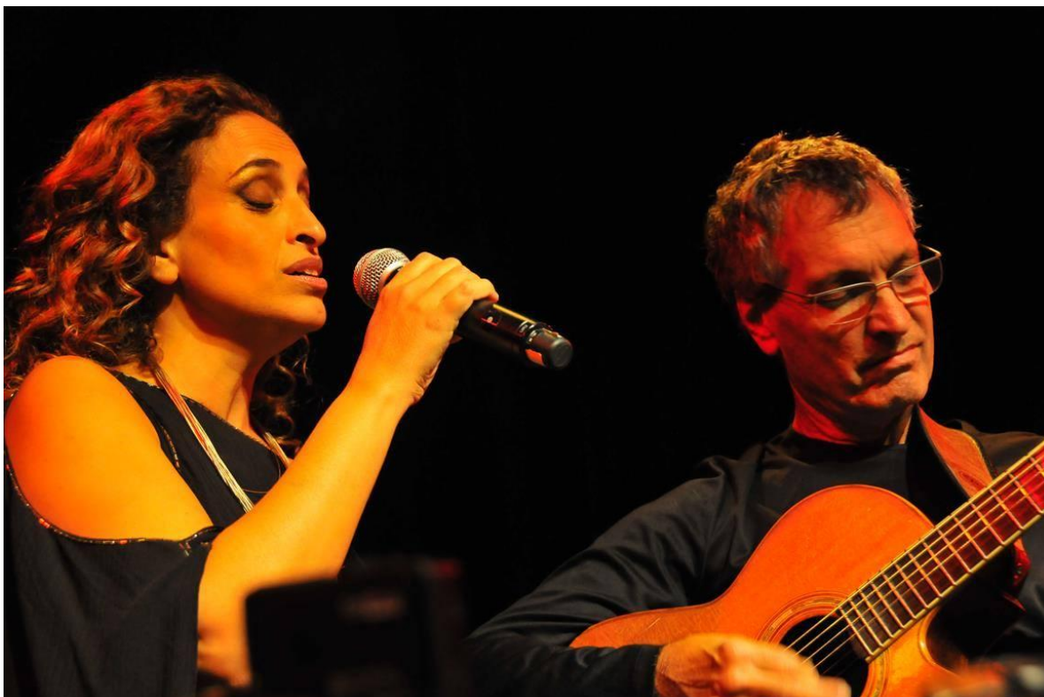
Den israelske sangerinde Noa, der også er good will ambassadør for FAO, FN's fødevareorganisation. Noa er dybt engageret i at fremme dialogen mellem Israel og Palæstina, og en af de i Israel mest kendte fortalere for en to-stats løsning.

Den redigerede koncert, der transmitteres 1. juledag, er suppleret med smukke billeder fra Assisi og fra freskerne i Basilikaen, der gør den endnu mere stemningsfyldt og inderlig. Flere lande jorden over sender koncerten direkte d. 25. december eller senere. De modtagere i Skandinavien, hvis tv-programpakke indeholder Rai1 vil kunne se koncerten, og det ved jeg, at nogle af jer ser frem til hvert år.