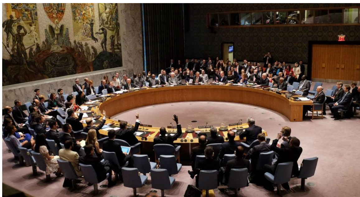
D. 19. december 2015 vedtog FN’s Sikkerhedsråd eenstemmigt en køreplan for fred i Syrien – den første resolution, som det er lykkedes at skabe flertal for.

I hele 2015 er borgerkrigen i Syrien fortsat med ufattelige menneskelige lidelser, der får ethvert følsomt hjerte til at bløde, og det påvirker nu i endnu større grad og mere direkte Europa med de tusinder af flygtninge, der søger beskyttelse og en fremtid for deres børn ved at bede om asyl på vort kontinent. Selvom vi kan nære stor glæde over, at Verdenssamfundet tog et stort og vigtigt skridt mod kærlighedens civilisation, da det i efteråret 2013 lykkedes at starte processen med fredelig destruktion af Syriens kemiske våben, og at den blev tilendebragt i 2014, er den syriske befolkning stadigvæk i stor lidelse som følge af den fortsatte krigsførelse med konventionelle våben. Her i december måned kan vi dog nære forhåbning om, at den 5 år lange borgerkrig kan afsluttes i 2016, og en fredsproces kan starte. Efter intenst og vedholdende diplomatisk arbejde, ikke mindst USA’s udenrigsminister John Kerry roses for sin indsats af kommentatorer, er det for første gang i de 5 år lykkedes for FN’s Sikkerhedsråd at nå til enighed om en resolution, der skitserer en køreplan for fred i landet. Forhandlingerne med de involverede parter starter straks efter, at vi er gået ind i det nye år. Lad os holde visionen.