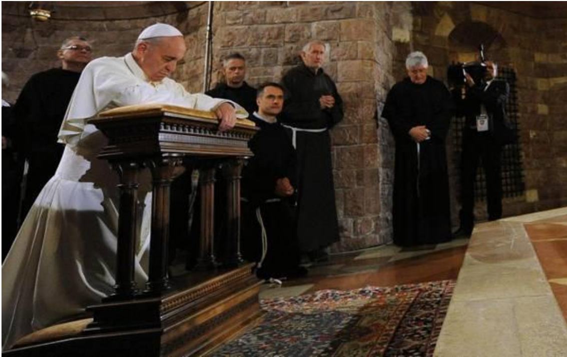
Pave Frans beder ved Frans' grav i Assisi d. 4. oktober 2013.

Det blev meget smukke, dybe og meningsfulde dage i et dybt indre samarbejde. Undervejs i vor fordybelse modtog jeg en inspiration fra rådet om Europas krise med de store flygtningestrømme. Dele af den gengives her, da den stadigvæk er aktuel som følge af, at EU-landene fortsat arbejder – sammen og enkeltvis – med at finde løsninger: