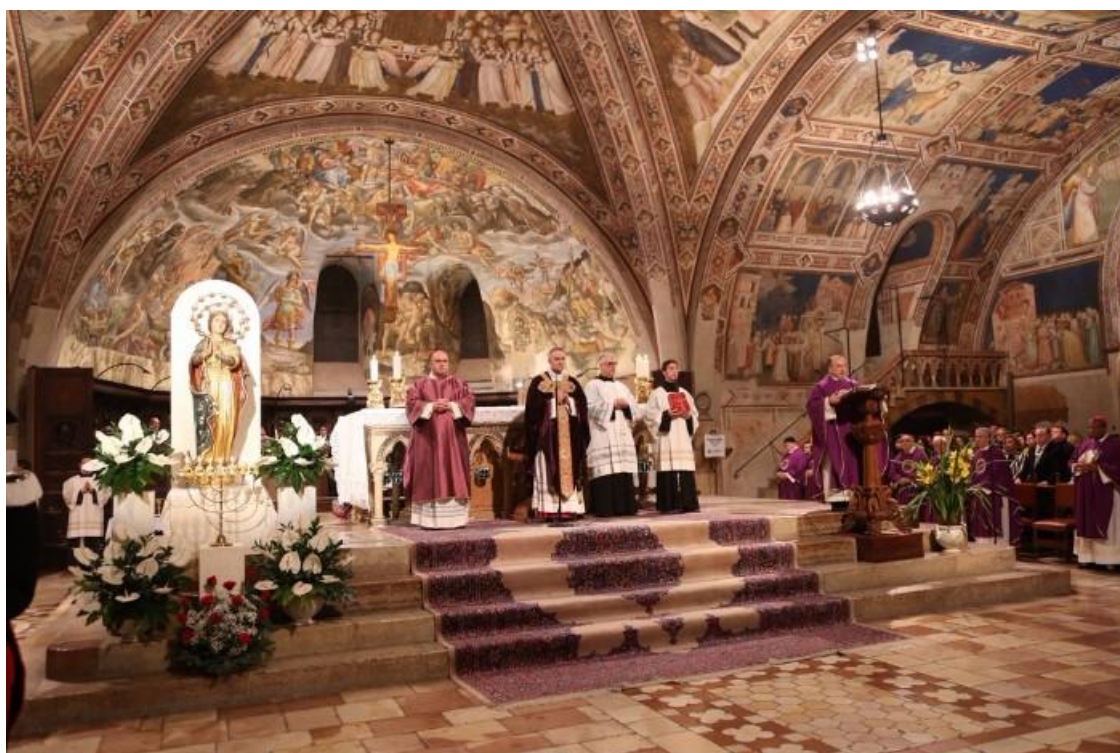
2. søndags adventshøjmesse i Basilica di San Francesco, d. 6. december 2015. Vi var heldige og fik rigtigt gode pladser på nogle af de første bænkerækker. Kardinal Gänswein afsluttede messen ved at bede foran Maria, mens koret sang den berømte franciskanske hymne "Tota Pulchra".

Det blev en meget dyb og smuk adventshøjmesse, hvor Basilikaens kor sang, så engleriget steg ned i al sin skønhed under den meget dybe tjenesteledelse af kardinal Gänswein, som vi naturligvis blev brugt til at intensivere. Det var under hele messen tydeligt, at kardinalen er et dybt spirituelt, meget hjertevarmt menneske, og han overraskede bl.a. ved på vejen op mod højalteret et stoppe processionen flere gange, fordi han lige skulle hilse på et barn. Også før og efter messen var kardinalens kærlighed til mennesker, ikke mindst børn, åbenbar, og da han gik ud af kirken, faldt hans blik direkte på mig. Jeg fornemmede dybden, visdommen og mildheden i hans øjne.