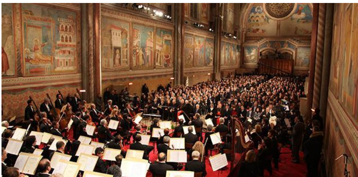
Fra en tidligere julekoncert i Overkirken med solister og RaiUno's store symfoniorkester

I den uendeligt smukke julenat, hvor engleriget sitrer intenst i himmelsk glæde, og de efterfølgende juledage intensiveres hjælpen fra Gudsriget, som stimulerer det enkelte menneske og menneskeheden som helhed til de levendegørelser, der fører til fødslen af Kristus som Kærlighedens og Medfølelsens Herre i hjertecenter efter hjertecenter over hele Jorden. Vi kan år for år vælge at gå mere og mere indad og lade os absorbere dybere og dybere ind i englerigets uendeligt smukke indstrømning af ekstatiske glæde, kærlighed og fred og dermed lade Kristus fødes på dybere og dybere niveauer. Samtidigt med, at vore hjerter fyldes af det indre Kristusliv, kan vi lade dette liv strømme videre ud i menneskeheden kollektive hjertelag. Denne indre opmærksomhed og tjeneste er for mange af os den største gave, som vi kan give ikke blot til vore nærmeste, men også til alle vore øvrige brødre og søstre på vor smukke men lidelsesfyldte og trængselsplagede jord.