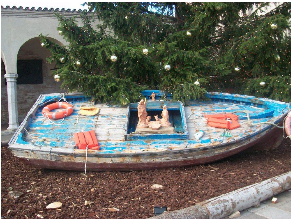
Den Hellige Familie i den ramponerede flygtningebåd.

De ankom til Italiens sydligste ø Lampedusa – i live, hvad tusinder af øvrige flygtninge ikke har gjort det i de år, hvor mennesker er flygtet fra krig og fattigdom i Afrika og Mellemøsten for at søge sikkerhed i det forjættede land, Europa.