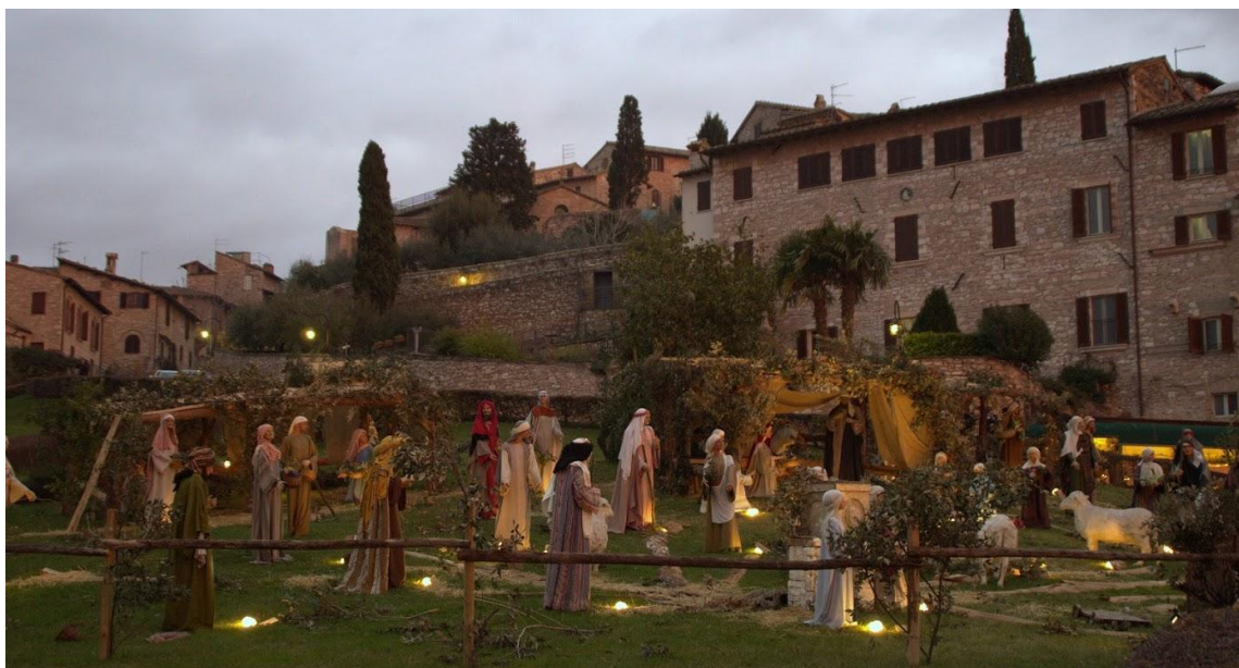
Bethlehemsscenen på plænen foran Basilica di San Francesco i julen 2012.