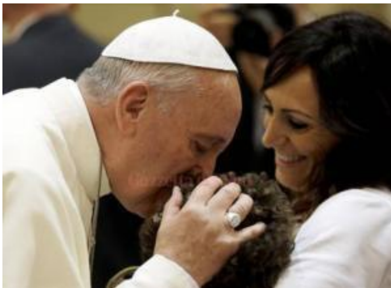
Pave Frans i Assisi d. 4. oktober 2013.

Jeg glæder mig fortsat inderligt over den begivenhed i Den Katolske Kirke, der har vækket så meget håb hos millioner af mennesker jorden over, nemlig det overraskende valg i marts 2013 af Pave Frans som Den Katolske Kirkes leder. I hans gennem sit nu 2 år og 10 måneder gamle pontifikat har han i fodsporene på Frans af Assisi ved sit eget eksempel sat et kærlighedens og medfølelsens fokus på de lidende og mest marginaliserede brødre og søstre jorden over, startet vigtige tiltag til reformer i kirkens ledelse og i udtalelser og møder stået en blødgøring af kirkens forståelser og praksis, der giver meget håb, mod og fortrøstning. Også på den verdenspolitiske scene er han trådt frem, og har som nævnt spillet en positiv rolle i optøningen af forholdet mellem USA og Cuba. Han er dermed trådt i fodsporene på den nyligt helgenkårede Pave Johannes Paul II, der spillede en afgørende rolle omkring Murens fald. Pave Frans beder altid mennesker, han møder, om at bede for sig, for han er bevidst om sin store og vanskelige opgave. Denne opfordring til indre støtte i pavens store opgave kan vi prioritere også i 2016.