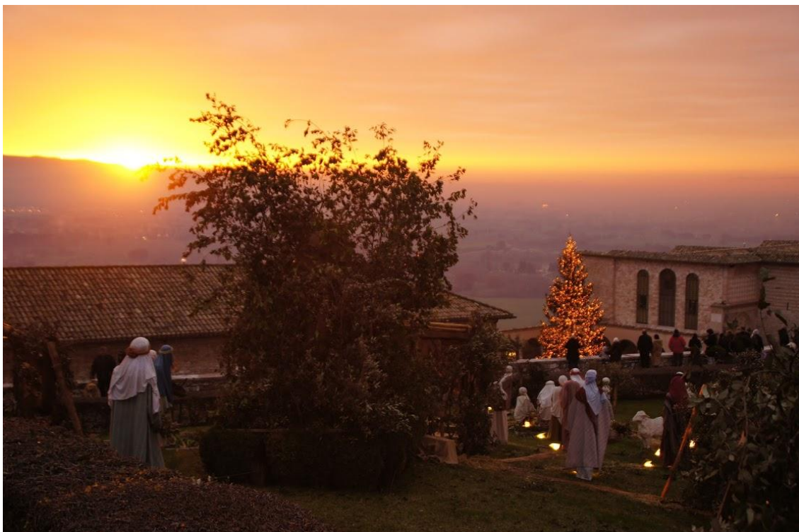
Julestemning ved Basilica di San Francesco i julen 2012.

http://www.assisimission.net/da/nyhedsbreve/nyhedsbrevsarkiv