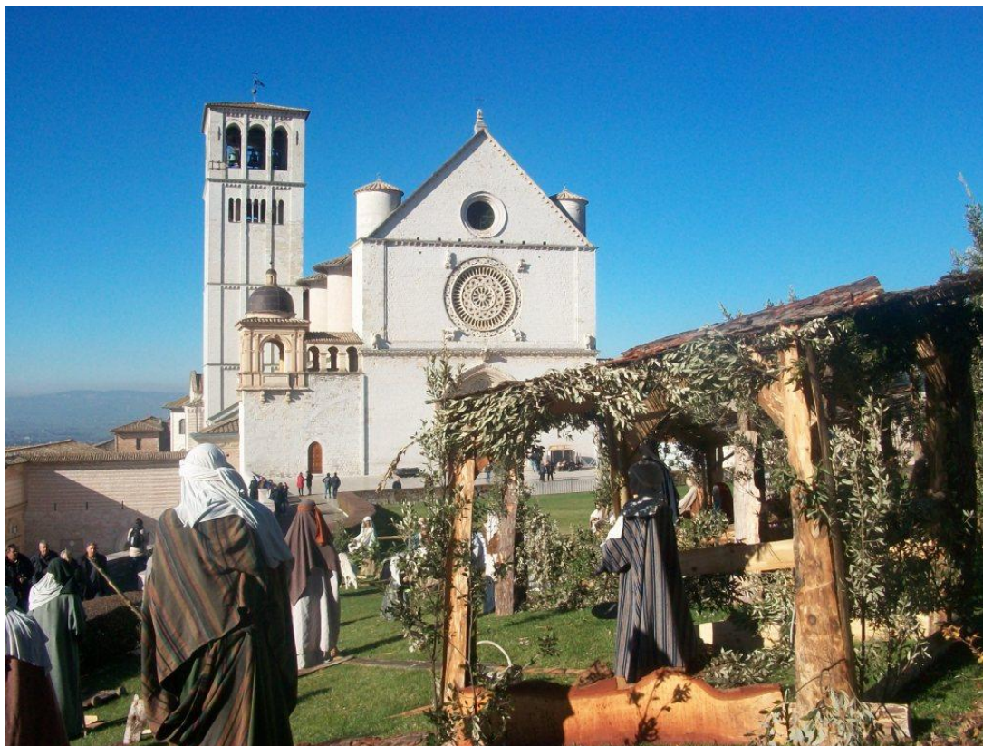
Også i år pryder den store Betlehemsscene plænen foran Basilica di San Francesco. De ca. 40 figurer i naturlig størrelse bærer dragter syet af kvinder i Det Hellige Land. Fotoet er taget på en meget smuk vinterdag, d. 11. december 2015.