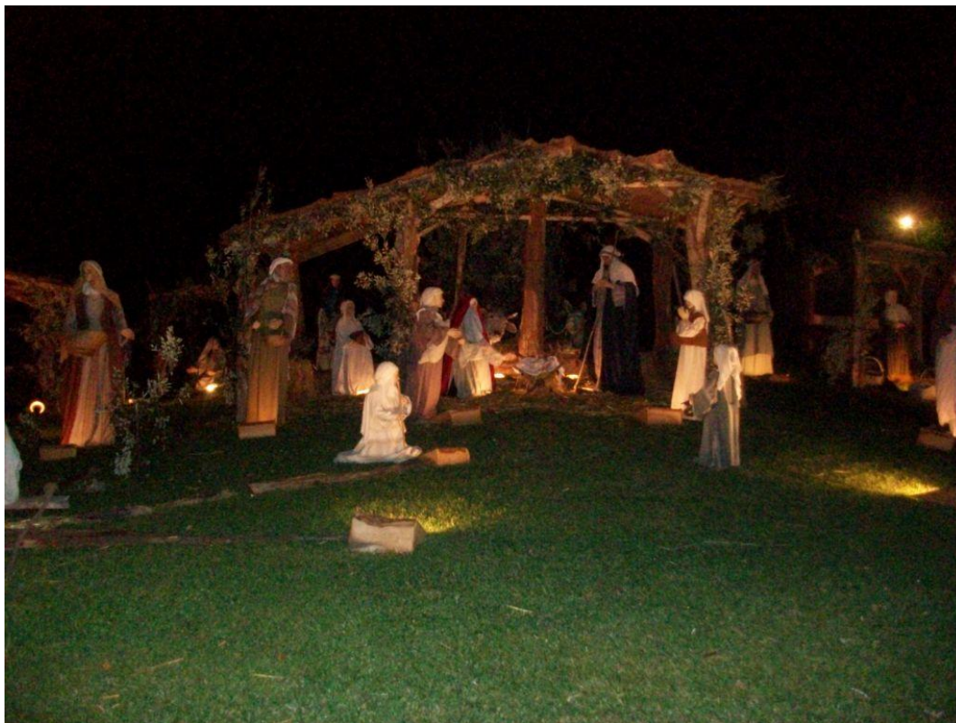
Betlehems-scenen 2015 ved nattetide

Under Maria-retræten blev julebelysningen tændt overalt i Assisi, og forretninger, hjem og udendørsarealer er nu smykket med Italiens vigtigste juledekoration: Kunstfærdige julekrybber med Jesusbarnet, Maria, Josef, De Hellige Tre Konger, børn, mænd og kvinder. På plænen foran Basilica di San Francesco er traditionen tro igen opsat den store Betlehemsscene med personer og dyr i naturlig størrelse, stald, krybbe, værksteder og brønde. Når vinden bevæger de af palæstinensiske kvinder syede klæder på de ca. 40 figurerer i naturlig størrelse af mænd, kvinder og børn, virker den store Bethlehem-scene levende til stor jubel for de mange børn, der sammen med deres lærere eller familie hvert år besøger Frans' gravkirke i tiden op mod jul. Jeg tror, at der er en af de mest fotograferede Bethlehem-scener i verden, og også jeg kan da heller ikke lade være med år efter år at tage billeder af den, som det ses også i dette brev til jer.