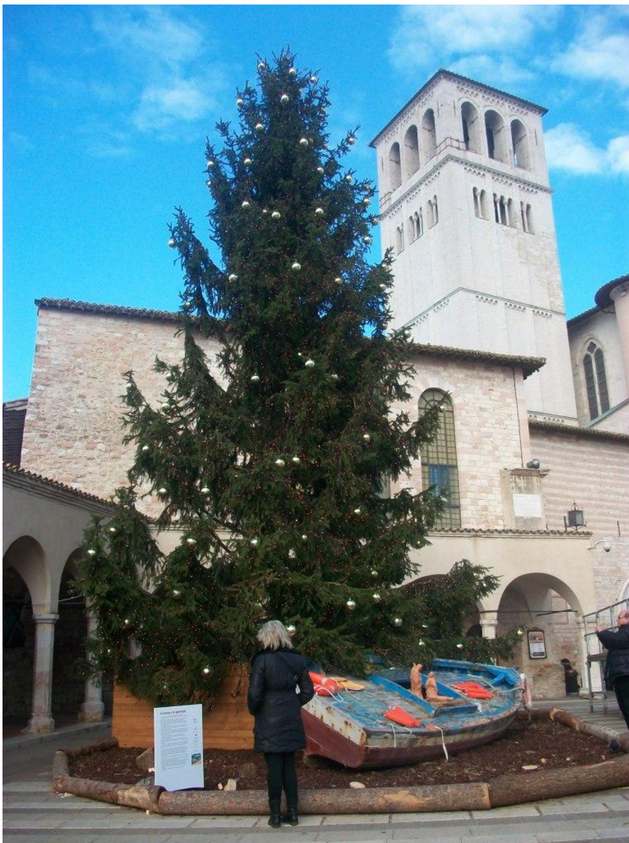
Refleksion over flygtninges vilkår foran juletræet på Piazza Inferiore i julen 2015.

ASSISI MISSION ♦ c/o Bente Wolf Via Fortini 7 ♦ I-06081 Assisi (PG) ♦ Italy tel: +39 075 8155 278 ♦ e-mail: bente@assisimission.net web: www.assisimission.net