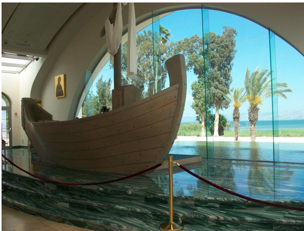
Den meget smukke, nyåbnede kirke i Magdala ved bredden af Genesaret Sø i april 2015. Maria Magdalene kom fra Magdala

Det er naturligvis en særlig stor glæde for mig at tænke tilbage på Assisi Missions aktiviteter med retræter i Assisi og udenlands i 2015. Under disse retræter er det med en følelse af stor mening og nytte, at jeg har delt en længere periode - fra en weekend og op til 14 dage - med søgende mennesker og dermed nået en fælles endnu dybere absorbering ind i "the Spirit of Assisi" . Blandt disse aktiviteter i Assisi Mission i 2015 tænker jeg også tilbage på lysrejserne med særlig stor glæde efter erfaringerne undervejs på rejserne og de indre inspirationer om, at de gjorde en forskel for Guds arbejde med helliggørelse af jorden og menneskeheden. Assisi Missions særlige meditationsgruppe, hyrdegruppen, inviteres altid med i det indre på disse rejser, og således er vi bevidst flere af sted, end de personer, der også i det ydre er med på lysrejsen.