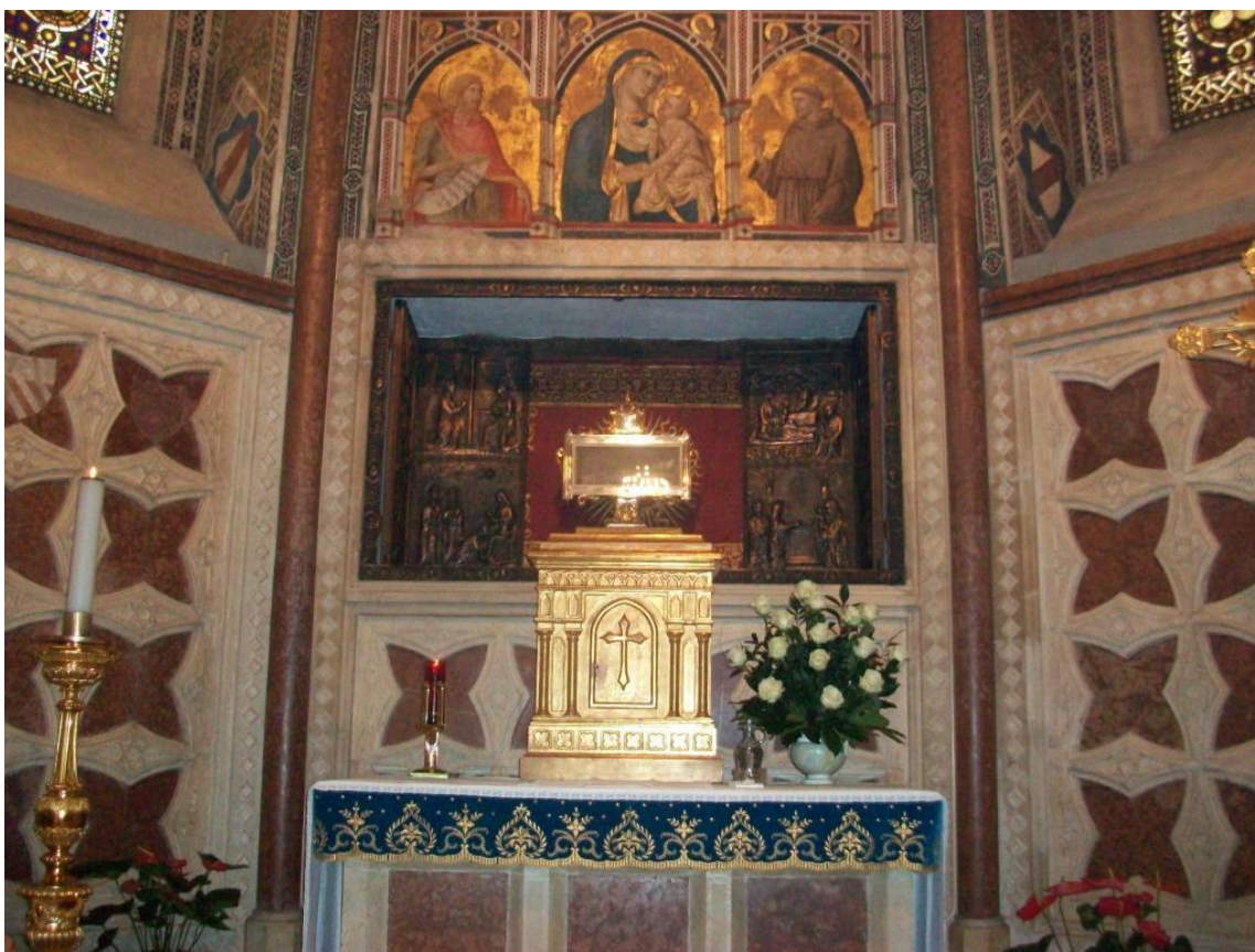
Marias sjal er åbenbaret d. 8. december 2016, i Johannes Døberens kapel i Basilica di San Francesco.

Den berømte franciskanske helgen Skt. Josef af Copertino (1600-1660), som i mange år boede på Sacro Convento, og som er berømt for sine mystiske erfaringer (bl.a. leviterede han), når han bad til Maria, spurgte engang Maria om det virkelig var hendes sjal. Maria svarede: "Tro mig, min søn, det er mit sjal, som jeg svøbte om Jesus-barnet" .