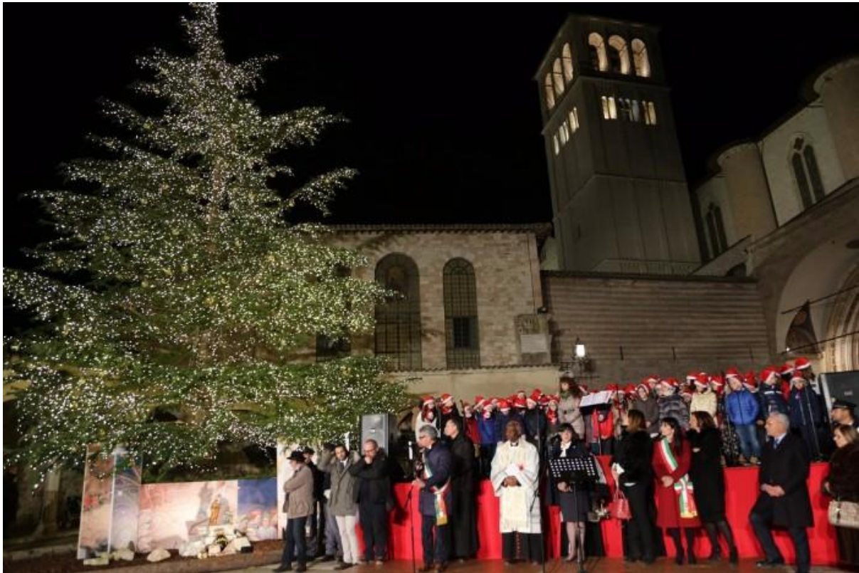
Juletræet er netop blevet tændt, og børnekoret synger populære børne-julesalmer.

Efter messen var det tiden for velsignelse og tænding af Basilikaens store juletræ. Det er altid en højtidelig stund, og efter at Betlehems borgmester havde talt så smukt om broder-/søsterskab og medfølelse med alle lidende, især børnene, inkl. dem, der er ramt af jordskælvne i Italien og de palæstinensiske børn på Vestbredden, gik Peter Turkson til træet og velsignede det, hvorefter Betlehems borgmester trykkede på knappen, således at træets tusinder af lys i et splitsekund lyste den mørke aften op.