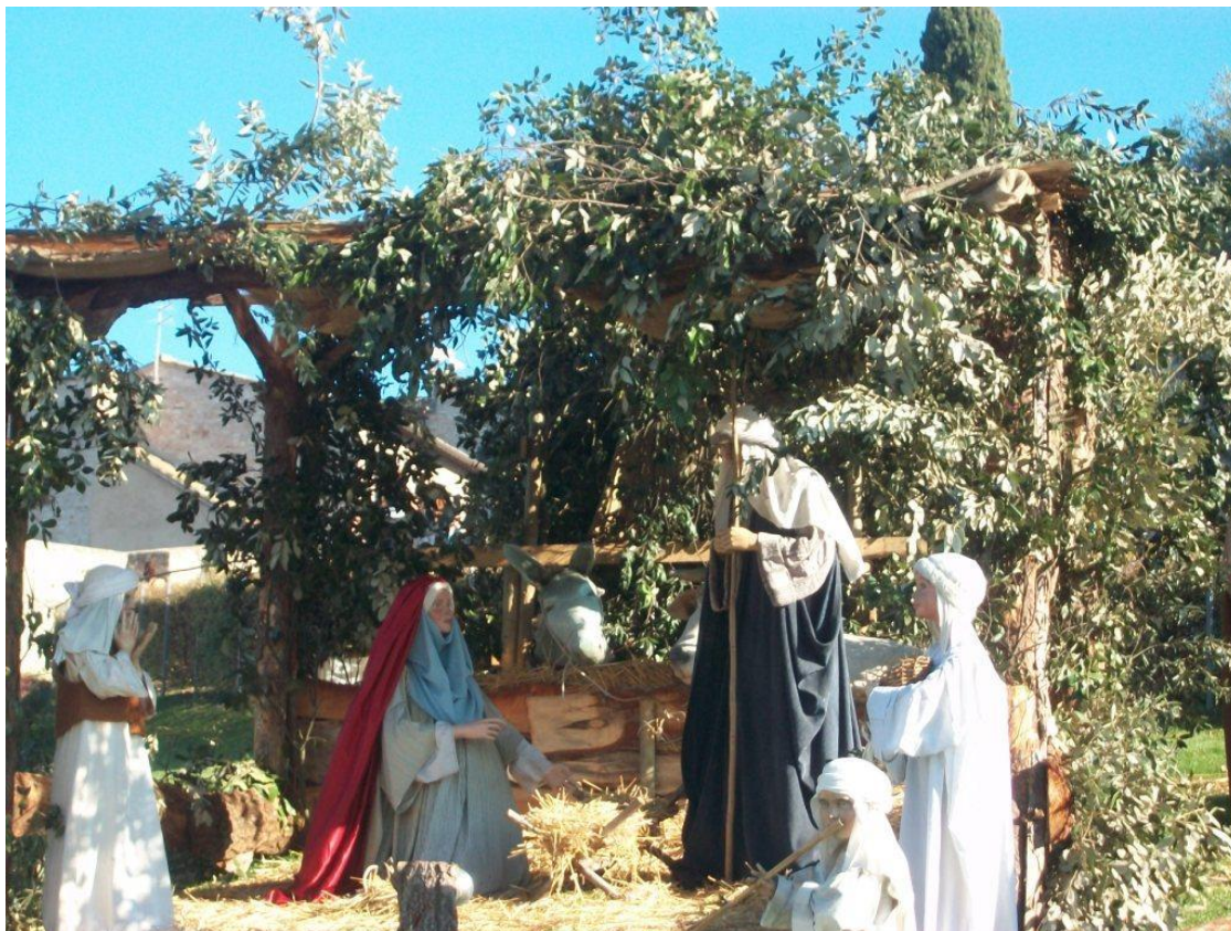
Maria og Josef i stalden i Betlehem. Jesus-barnet lægges i krybben jule-nat. Udsnit af den store Betlehems-scene på plænen foran Basilica di San Francesco i 2016.

Jeg har tillid til, at de vanskelige og dyrekøbte erfaringer, som vi som mennesker går igennem, vil medvirke til en erfaringsdannelse, der modner større befolkningsgrupper og gradvist erstatter egoets mere primitive kræfter med en større hjertesensitivt, broder-/søsterskab og solidaritet.