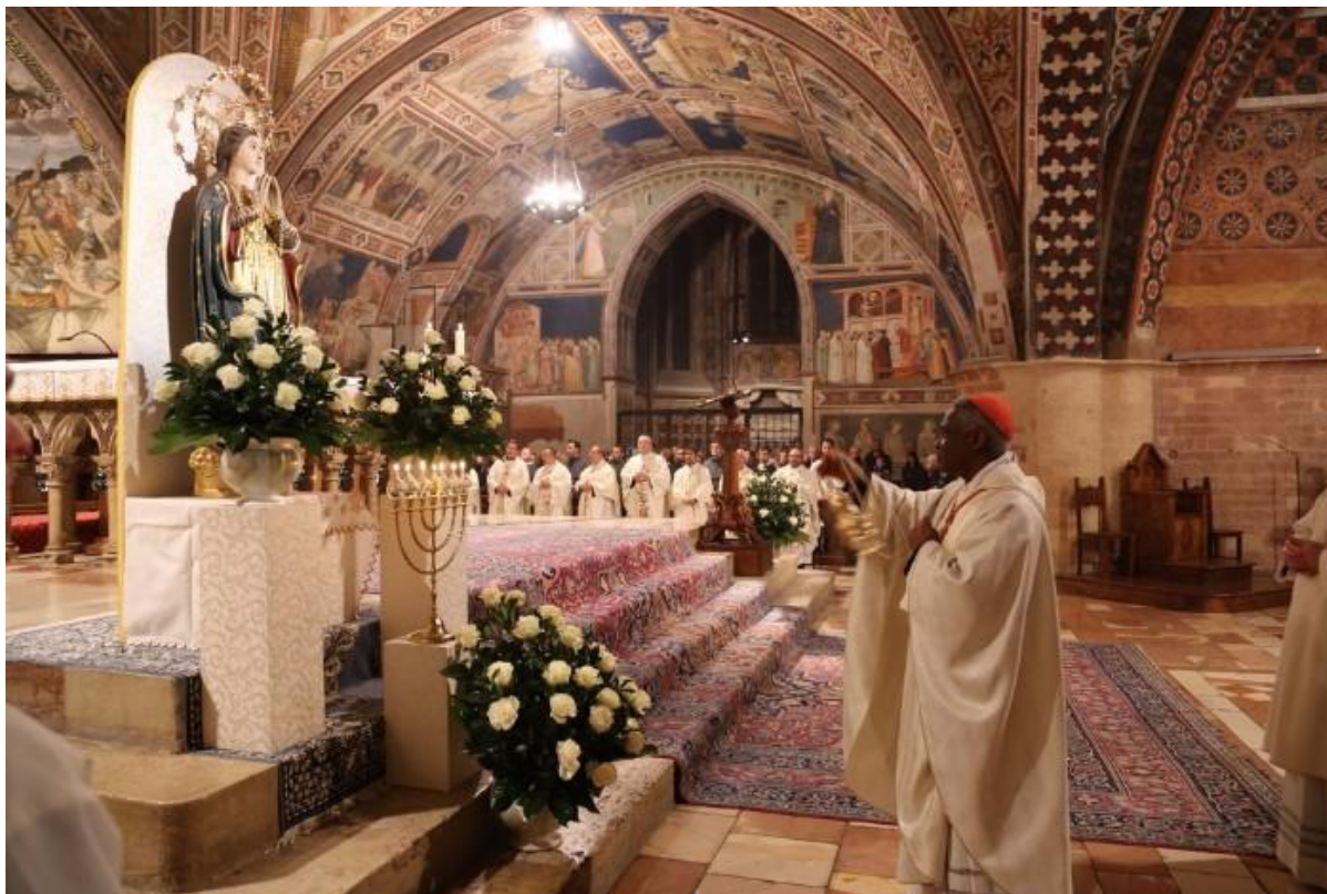
Kardinal Peter Turkson ved Maria under festmessen d. 8. december 2016 i Basilica di San Francesco.