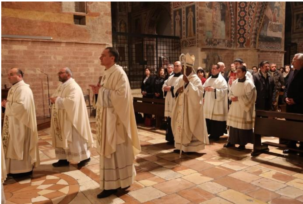
Processionen af præster og Kardinal Peter Turkson som indledning til messen d. 8. december 2016.