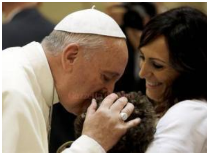
Pave Frans i Assisi d. 4. oktober 2013.

Jeg glæder mig fortsat inderligt over den begivenhed i Den Katolske Kirke, der har vækket så meget håb hos millioner af mennesker jorden over, nemlig det overraskende valg i marts 2013 af Pave Frans som Den Katolske Kirkes leder. I hans gennem sit nu 3 år og 10 måneder gamle pontifikat har han i fodsporene på Frans af Assisi ved sit eget eksempel sat et kærlighedens og medfølelsens fokus på de lidende og mest marginaliserede brødre og søstre jorden over, startet vigtige tiltag til reformer i kirkens ledelse og i udtalelser og møder stået for en blødgøring af kirkens forståelser og praksis, der giver meget håb, mod og fortrøstning. Også på den verdenspolitiske scene er han trådt frem, og har bl.a. spillet en positiv rolle i optøningen af forholdet mellem USA og Cuba. Han er dermed trådt i fodsporene på den nyligt helgenkårede Pave Johannes Paul II, der spillede en afgørende rolle omkring Murens fald. Pave Frans beder altid mennesker, han møder, om at bede for sig, for han er bevidst om sin store og vanskelige opgave. Denne opfordring til indre støtte i pavens store opgave kan vi prioritere også i 2017.