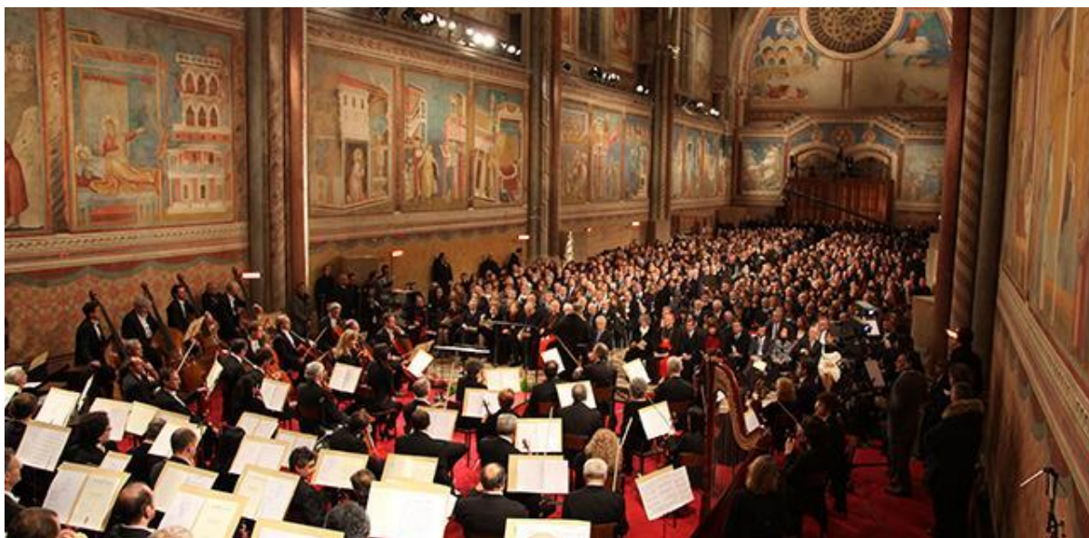
Fra en tidligere julekoncert i Overkirken med solister og Rai1's store symfoniorkester

For mig er det tydeligt, at Pave Frans knyttes dybere og dybere til Frans af Assisi. Mon han også kommer til Assisi i 2017?