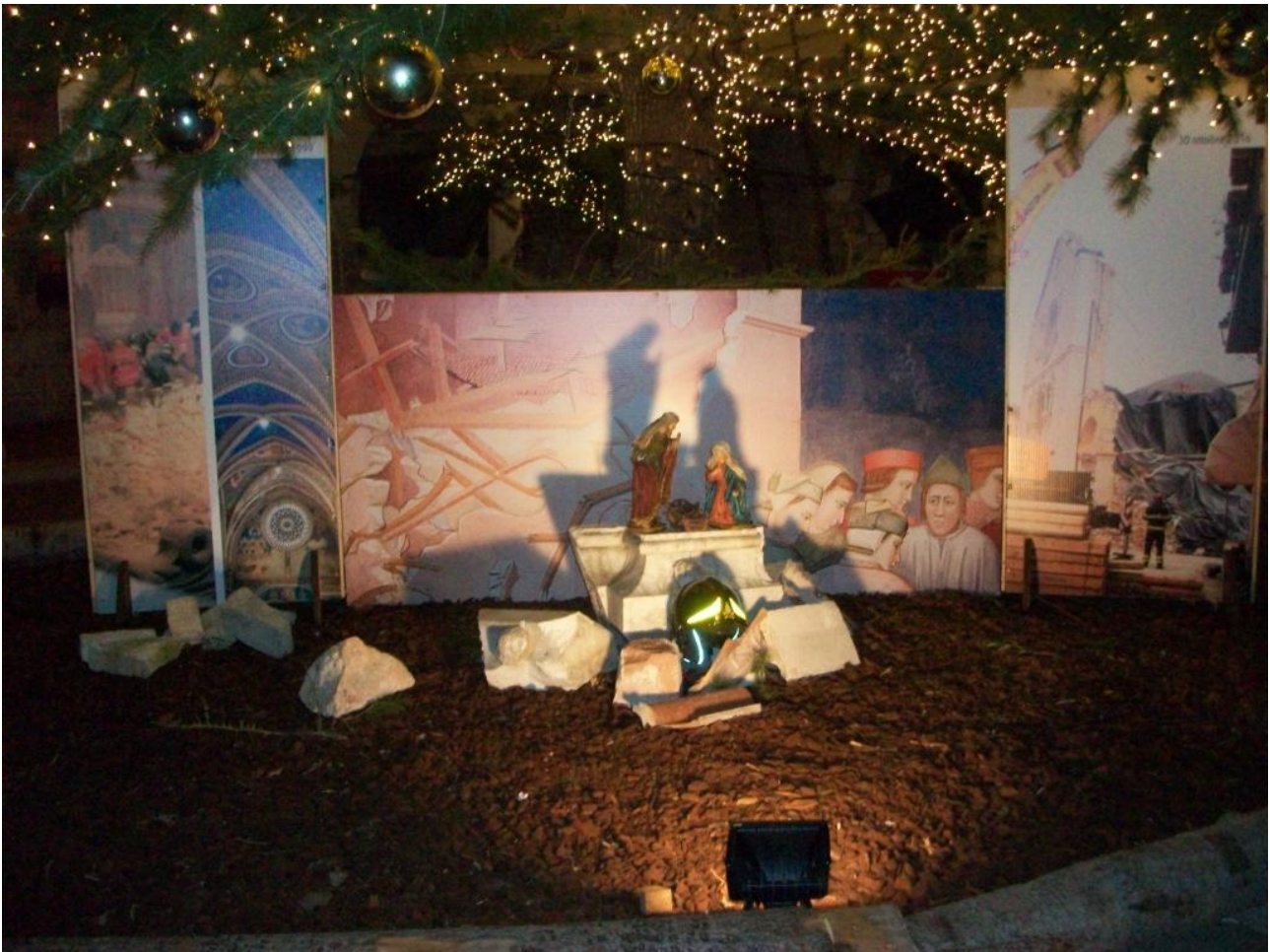
Julekrybben under Basilikaens juletræ dedikeret til jordskælvsfrene og redningspersonalet i Italien i 2016.