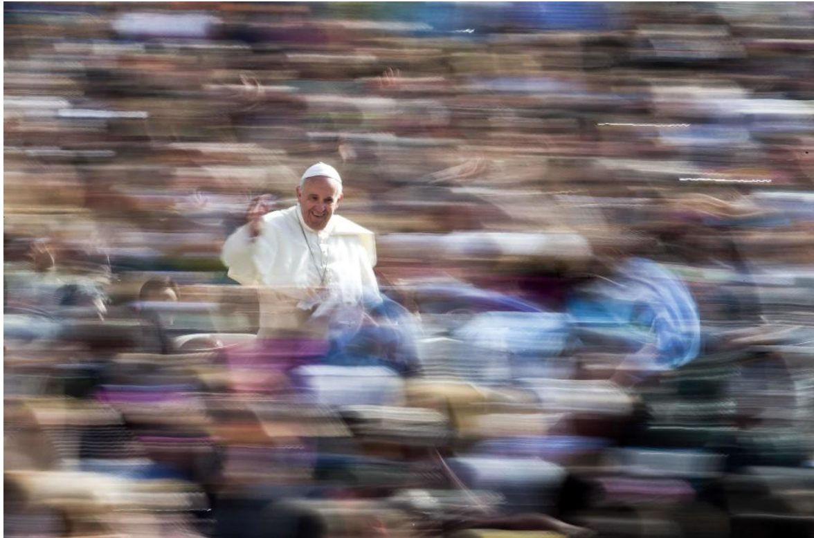
Pave Frans på Peterspladsen i en audiens i april 2016.