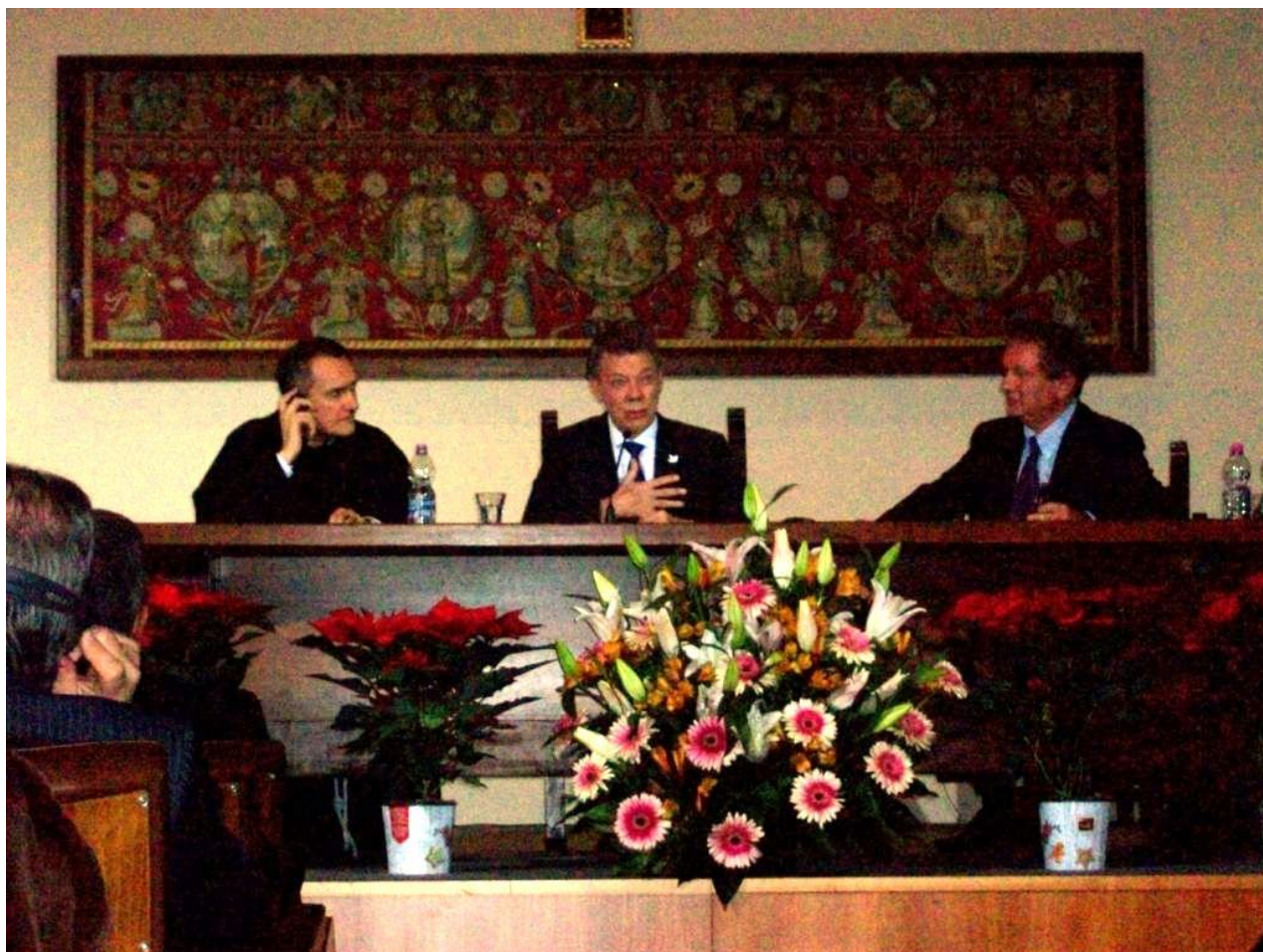
Præsident Santos taler på Sacro Convento d. 17. december 2016.

Denne fredsaftale lyser som et håb i mørket i et år 2016, og i det hele taget i vort indeværende årti, hvor intense konflikter og borgerkrige udspilles flere steder på jorden. Det var også tydeligt for mig, at under mødet intensiveredes "the Spirit of Assisi" meget markant som en hjælp til præsidenten og hans team i at fortsætte den kommende implementering af aftalen, som naturligvis også vil byde på vanskeligheder. Må "the Spirit of Assisi" nære den fortsatte fredsproces.