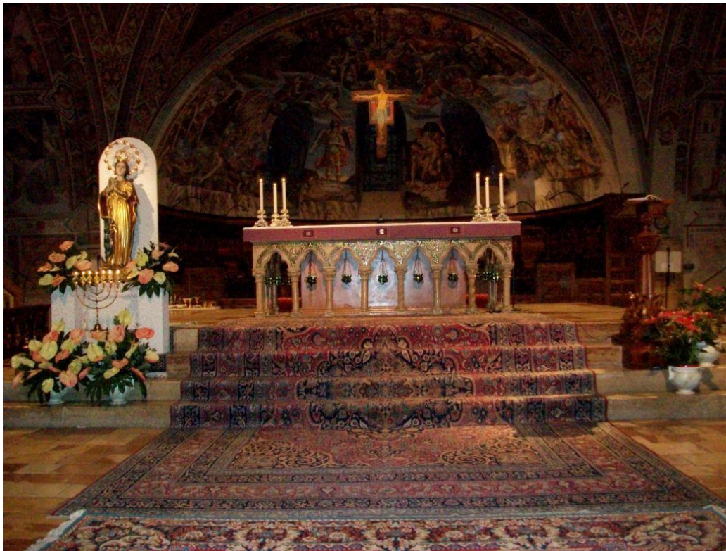
Et af Assisis hellige steder, Underkirken i Basilica di San Francesco, d. 8. december 2016.