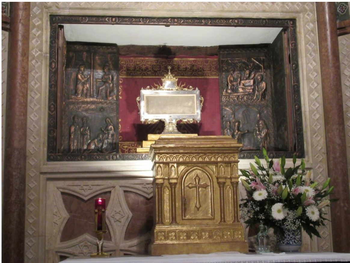
Marias sjal er åbenbaret d. 8. december 2017, i Johannes Døberens kapel i Basilica di San Francesco.