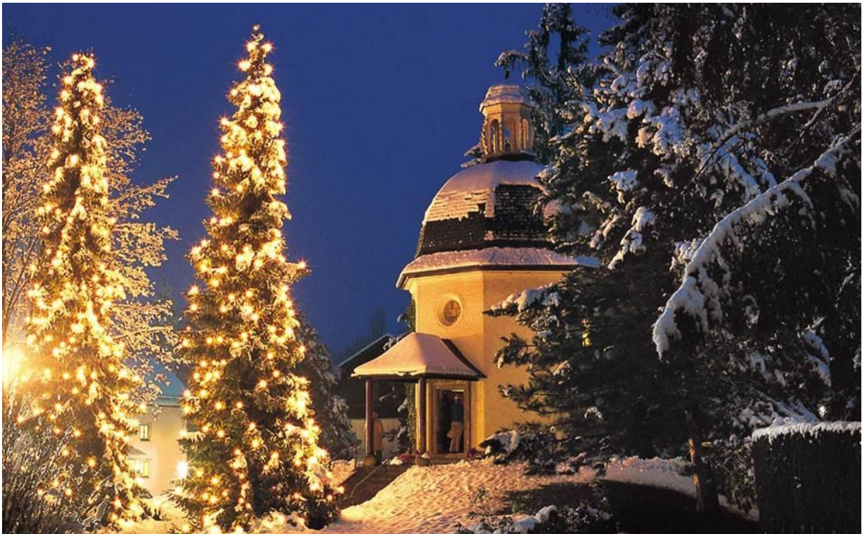
Kapellet til minde om den første opførelse af verdens nok mest berømte julesalme "Stille Nacht". Kapellet og det lille museum ligger i Oberndorf tæt på Salzburg i Østrig.

Jeg har tillid til, at de vanskelige og dyrekøbte erfaringer, som vi som mennesker går igennem, vil medvirke til en erfaringsdannelse, der modner større befolkningsgrupper og gradvist erstatter egoets mere primitive kræfter med en større hjertesensitivt, broder-/søsterskab og solidaritet.