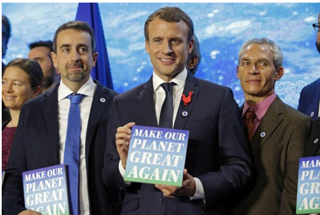
Aftenen før topmødet samlede den franske præsident Macron de amerikanske forskere, som Frankrig støtter med stipendier og muligheder for at flytte til Frankrig.

Det nyeste internationale klimatopmøde fandt sted i Paris på 2 årsdagen, d. 12. december, for indgåelse af Paris-aftalen i 2015. Præsident Macron inviterede verdens statsledere (dog ikke præsident Trump), andre højtstående politikere, erhvervsfolk og kendte klimaforkæmpere samt mange forskere til mødet, og det var opløftende at se nogle tv-optagelser, der gav minder om idealismen og entusiasmen under Klimatopmødet COP21, der førte til den historiske Paris-aftale.