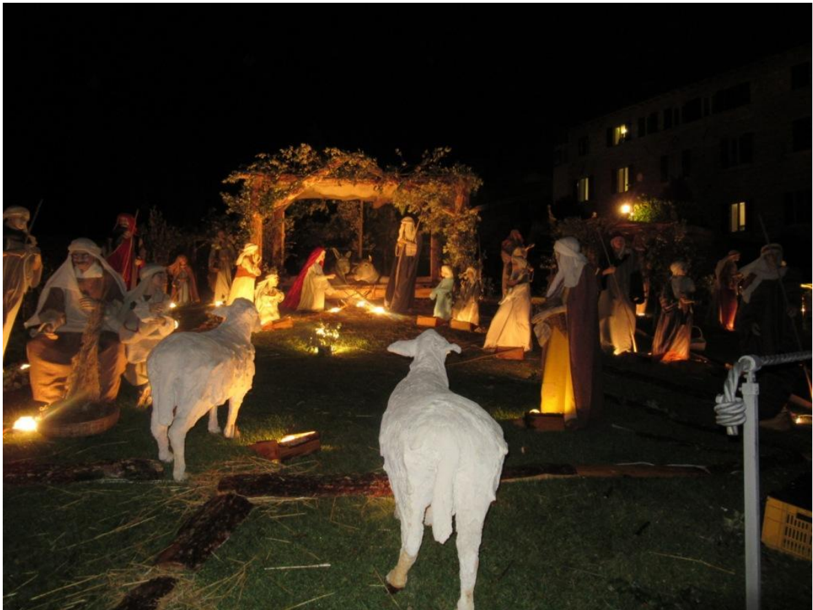
På Marias festdag d. 8. december blev lysene tændt.

Da jeg vandrede hjem efter den store Maria-festmesse og en skøn festmiddag på Ristorante San Francesco med en ven, glædede jeg mig over de mange lys over Assisis gader, som nu var tændt, og som hver aften og nat vil lyse julens glade budskab – lige indtil Hellig Tre Konger, d. 6. januar.