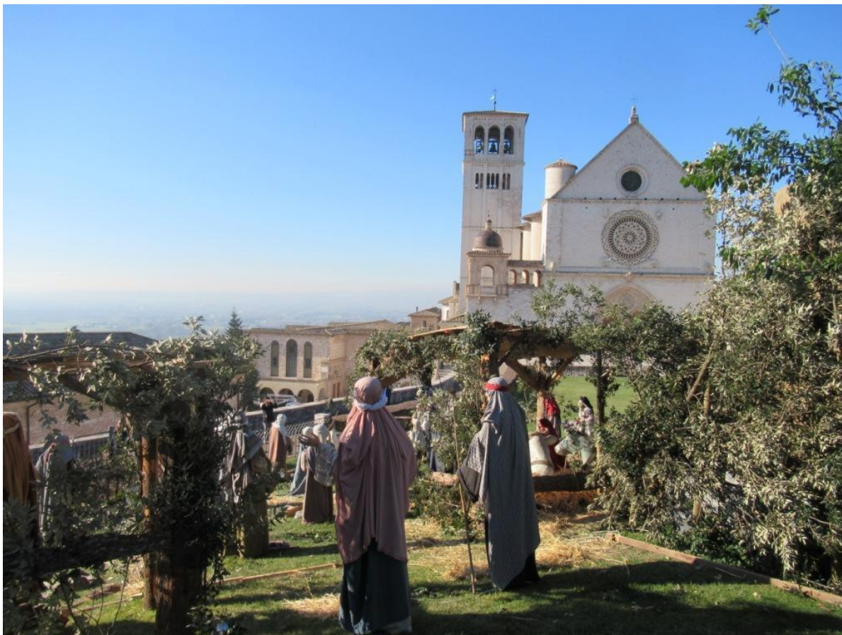
Under smuk vintersol d. 6. december 2017 stod den store Betlehemsscene færdig.