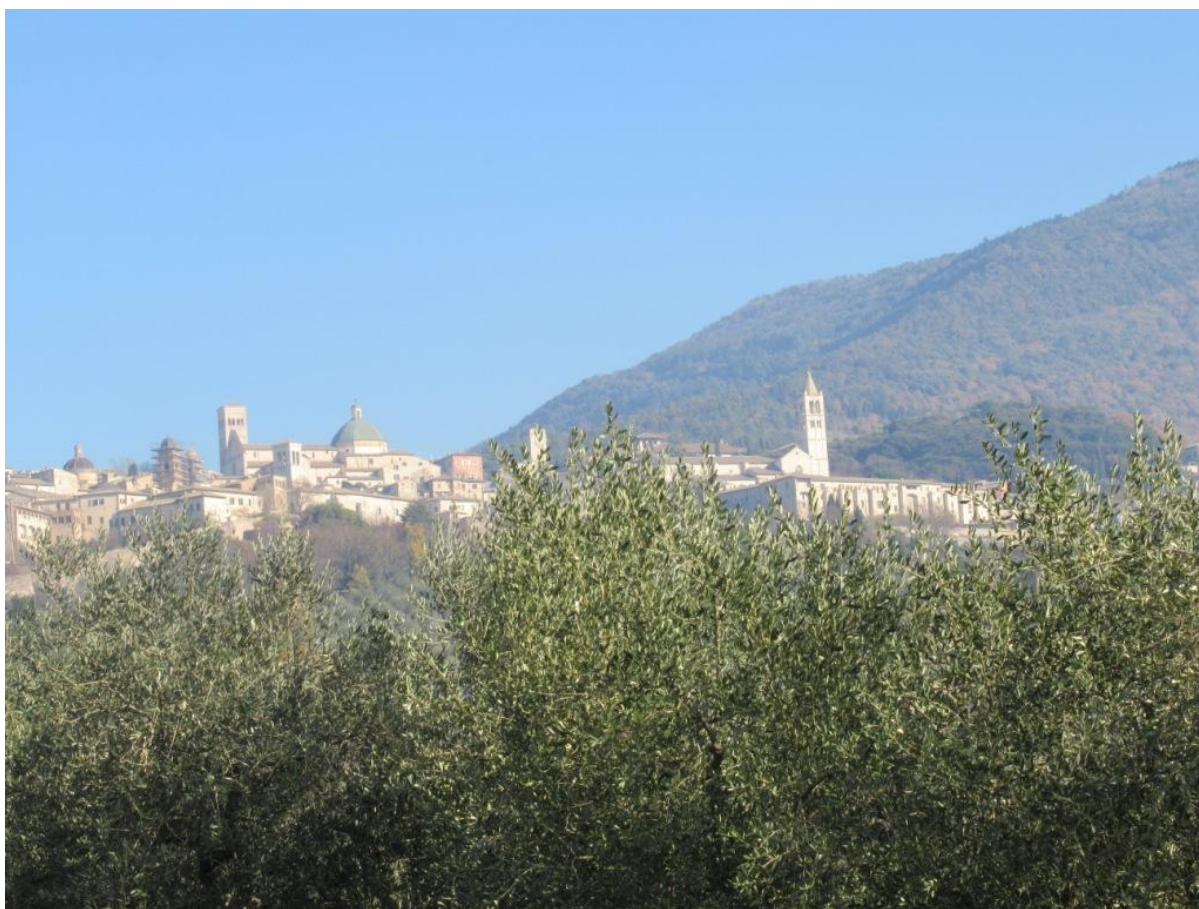
Basilica di Santa Chiara i vintersol i begyndelsen af december 2017.