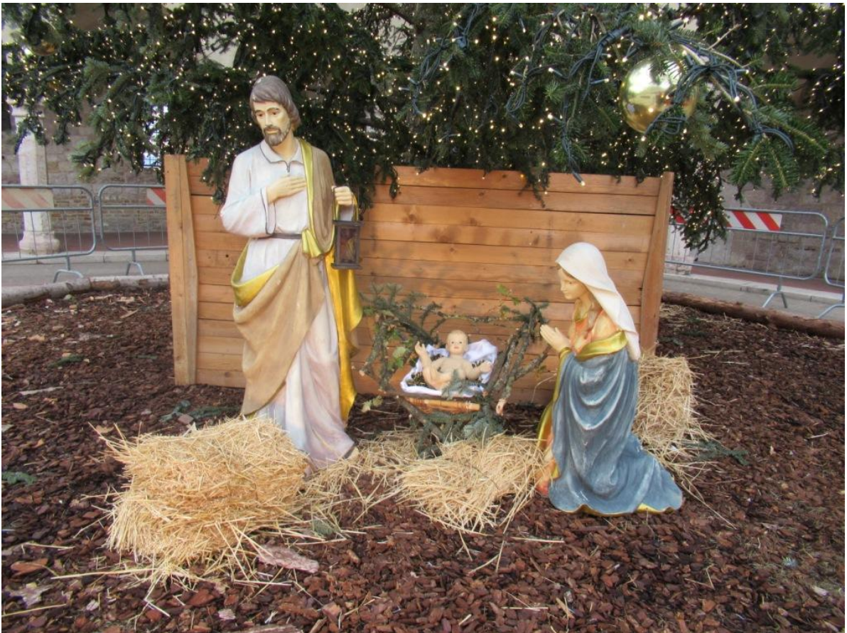
Under juletræet på Piazza Inferiore ligger Jesus-barnet på 445 gyldne patronhylstre.

For to år siden var julekrybben under Basilikaens juletræ dedikeret til alle de flygtningene, der strømmede ind i Europa, og en ramponeret flygtninge-båd var placeret under juletræet. Denne