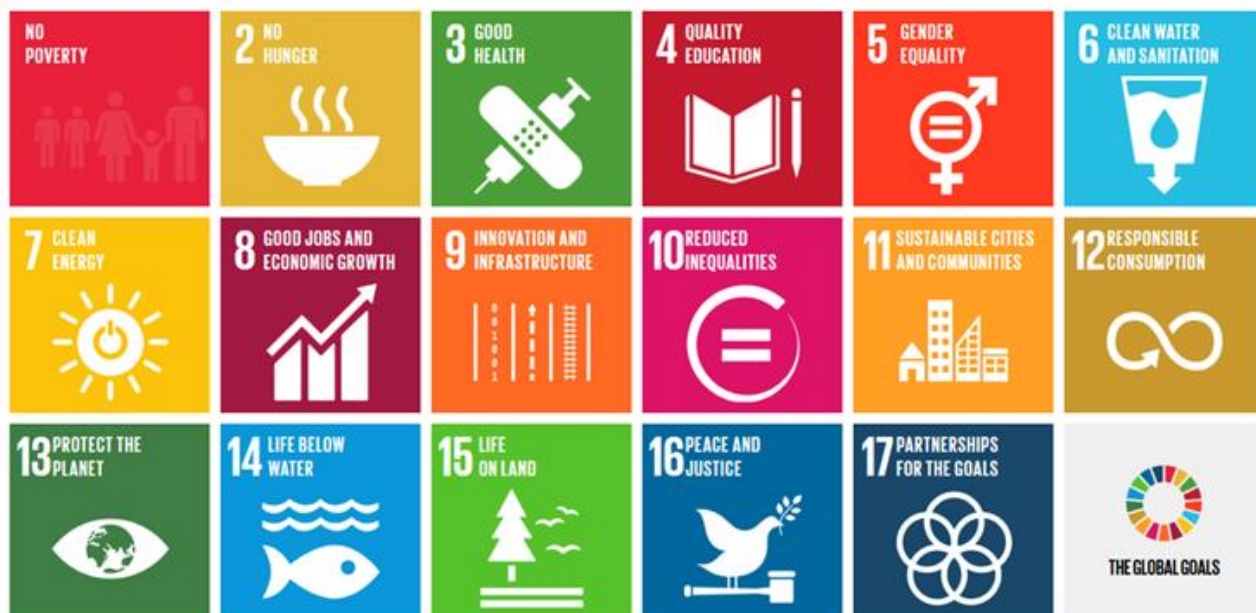
FN's 17 bæredygtighedsmål.

jord. 2015 viste også, at det lykkedes at indgå den historiske og vigtige Klimaaf tale i Paris , og i løbet af 2016 ratificerede så mange lande aftalen, at den er gældende. Der arbejdes intenst i FN, i øvrige organisationer og regeringer samt i store dele af det øvrige samfundsliv på at komme længere på vejen mod en fremtid, som gør vor planet til at være et bedre sted for alle riger. Må dette idealistiske virke blive styrket i det nye år, og må vi tage nye skridt på vejen mod global bæredygtighed.