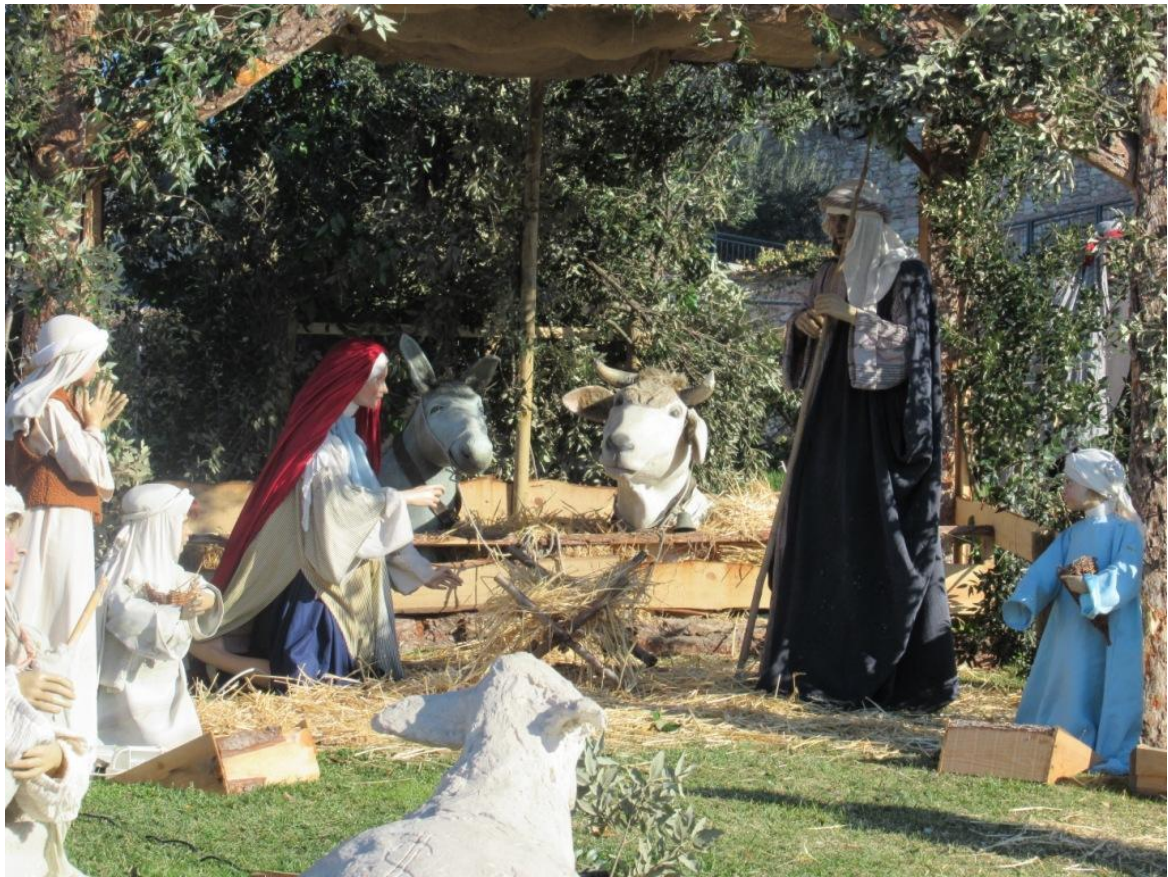
Jesus-barnet er endnu ikke kommet i krybben.