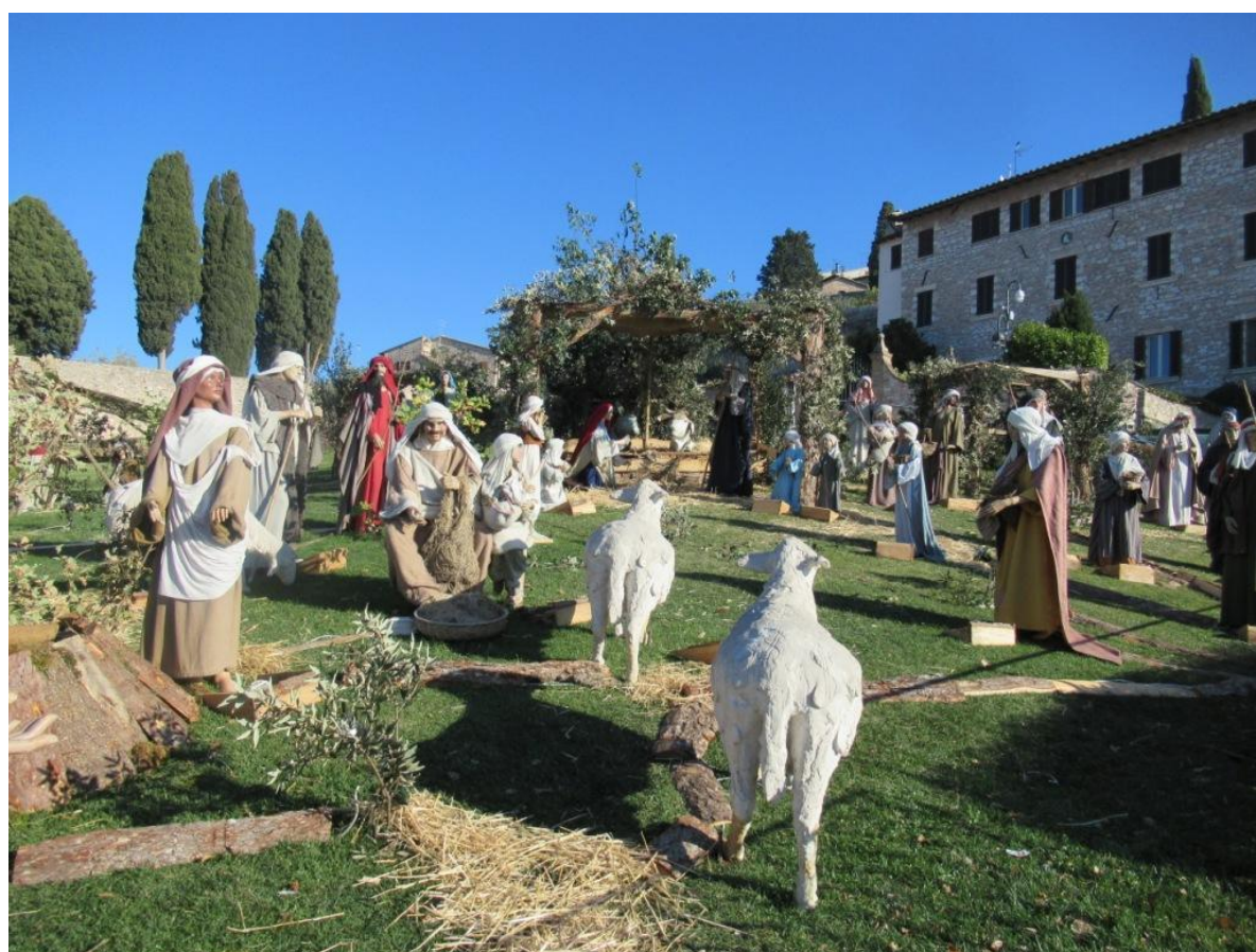
40 figurer iklædt jødiske dragter fra Jesu tid og masser af dyr er at finde på Betlehemsscenen.