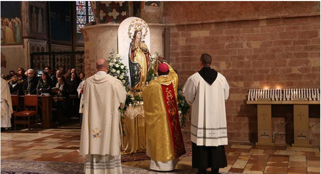
Den congolesiske biskop velsigner Maria med røgelse under kl. 10.30 messen på Marias festdag d. 8. december 2017.