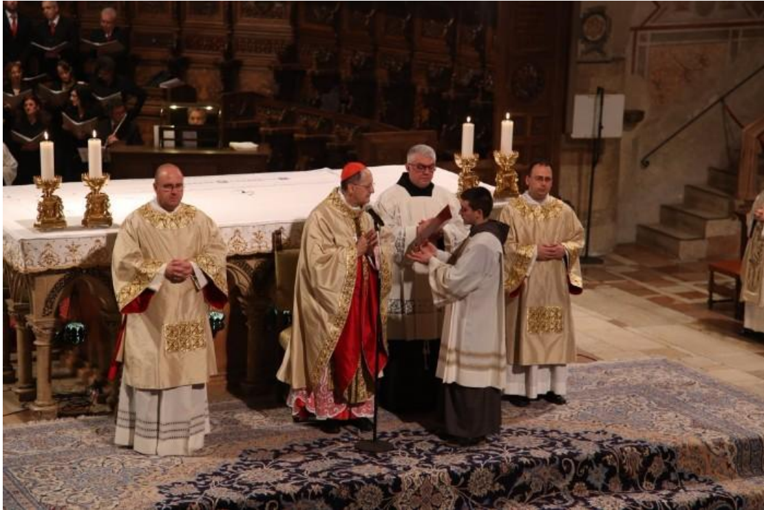
Kardinal Beniamino Stella under højmessen om eftermiddagen på Marias festdag d. 8. december 2017.