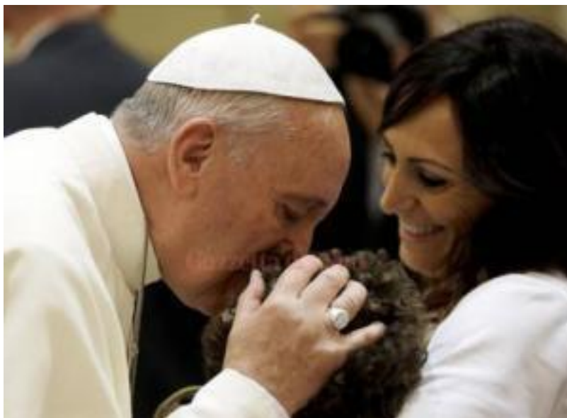
Pave Frans i Assisi d. 4. oktober 2013.

Jeg glæder mig fortsat inderligt over den begivenhed i Den Katolske Kirke, der har vækket så meget håb hos millioner af mennesker jorden over, nemlig det overraskende valg i marts 2013 af Pave Frans som Den Katolske Kirkes leder. I hans gennem sit nu 4 år og 10 måneder gamle pontifikat har han i fodsporene på Frans af Assisi ved sit eget eksempel sat et kærlighedens og medfølelsens fokus på de lidende og mest marginaliserede brødre og søstre jorden over, startet vigtige tiltag til reformer i kirkens ledelse og i udtalelser og møder stået for en blødgøring af kirkens forståelser og praksis, der giver meget håb, mod og fortrøstning. Også på den verdenspolitiske scene er han trådt frem, der lyttes til ham, og han anerkendes bredt for sin indsats i fredens og broder-/søsterskabets ånd. Pave Frans beder altid mennesker, han møder, om at bede for sig, for han er bevidst om sin store og vanskelige opgave. Denne opfordring til indre støtte i pavens store opgave kan vi prioritere også i 2018.