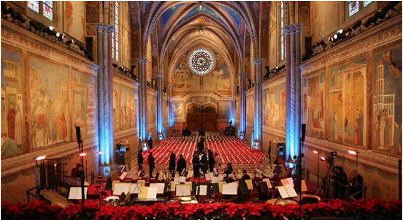
Frans' Overkirke gøres klar til lørdagens koncert.