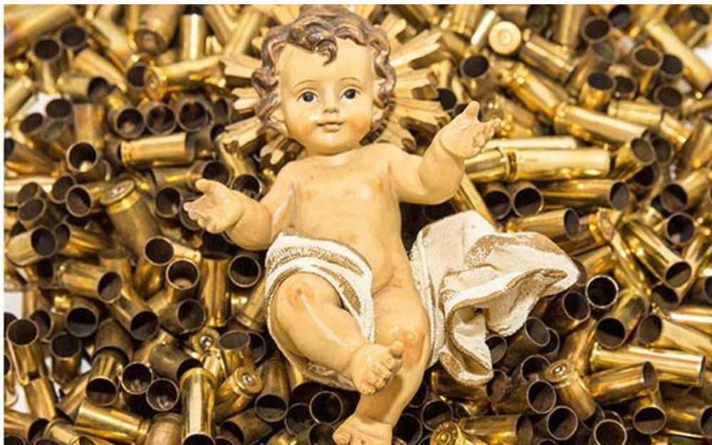
Jesus-barnet fødes ud af smerten – symboliseret som 445 patronhylstre.

Jeg var spændt på dette års dedikation af julekrybben under træet. En fotostat gav svaret: