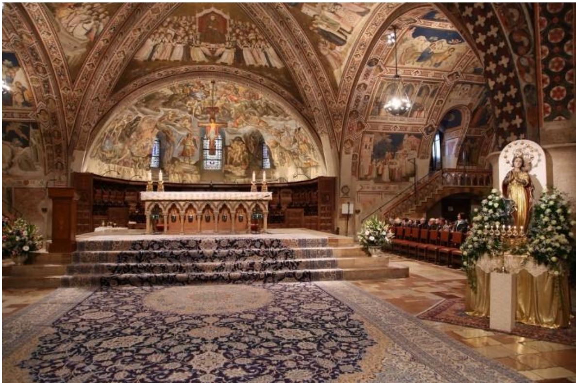
Maria stod fortsat ved højalteret 2. søndag i advent – to dage efter hendes fest.

Da jeg vandrede hjem efter den store Maria-festmesse og en skøn festmiddag på Ristorante San Francesco med en ven, glædede jeg mig over de mange lys over Assisis gader, som nu var tændt, og som hver aften og nat vil lyse julens glade budskab – lige indtil Hellig Tre Konger, d. 6. januar.