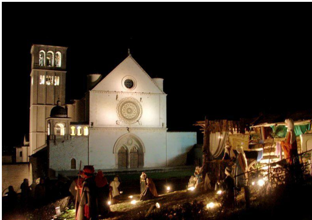
Bethlehemsscenen på plænen foran Basilica di San Francesco.

de yderligere besøg med weekend-retræter i Danmark og evt. Norge, som vil komme i løbet af året. På hjemmesiden www.assisimission.net under menupunkterne "Kurser i Assisi," "Kurser i Skandinavien" og "Lysrejser" er de forskellige muligheder publiceret. En kursusplan med tilbuddene opstillet i datoorden vedhæftes, ligesom den kan åbnes ved at klikke her..