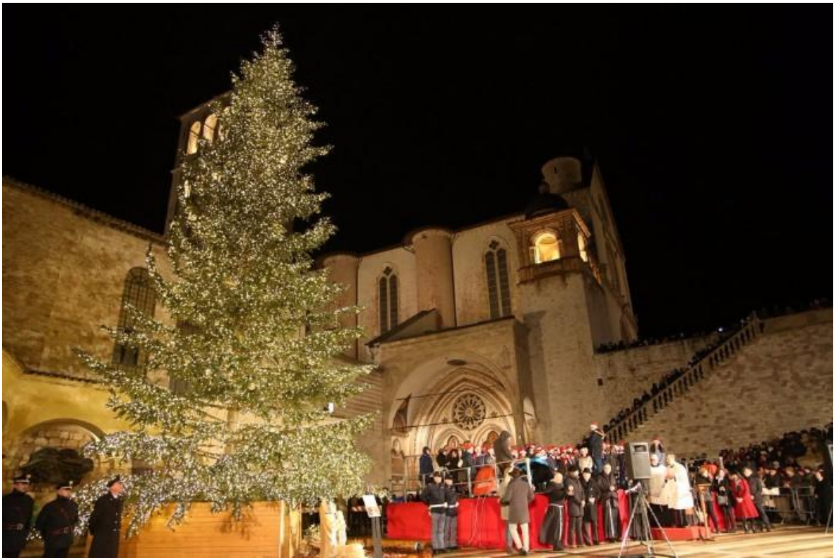
Juletræet på Piazza Inferiore er netop blevet tændt d. 8. december 2017.