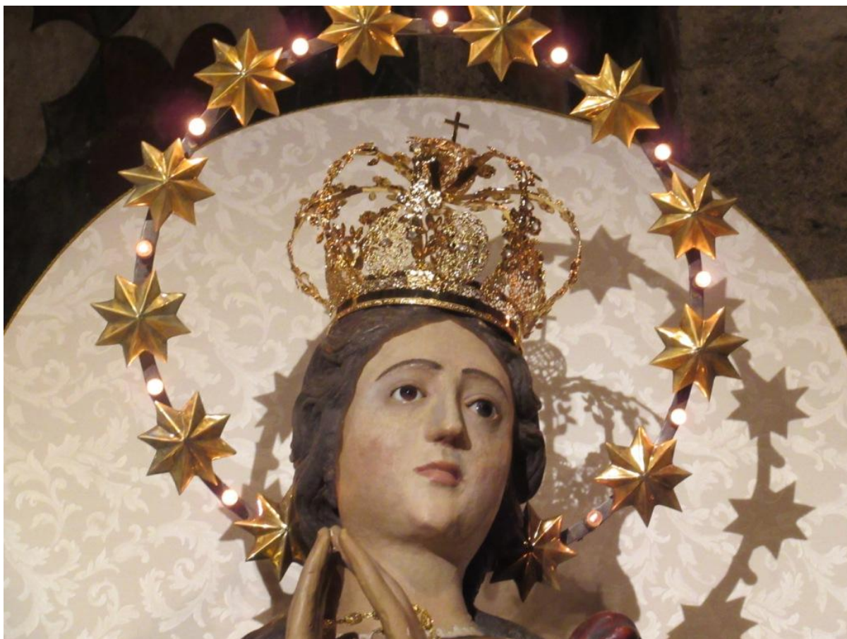
Marias øjne lyser under festen for hendes uplettede undfangelse d. 8. december 2017. Også ved Basilikaens smukke Maria-statue er der gennem tiderne sket mange mirakler.